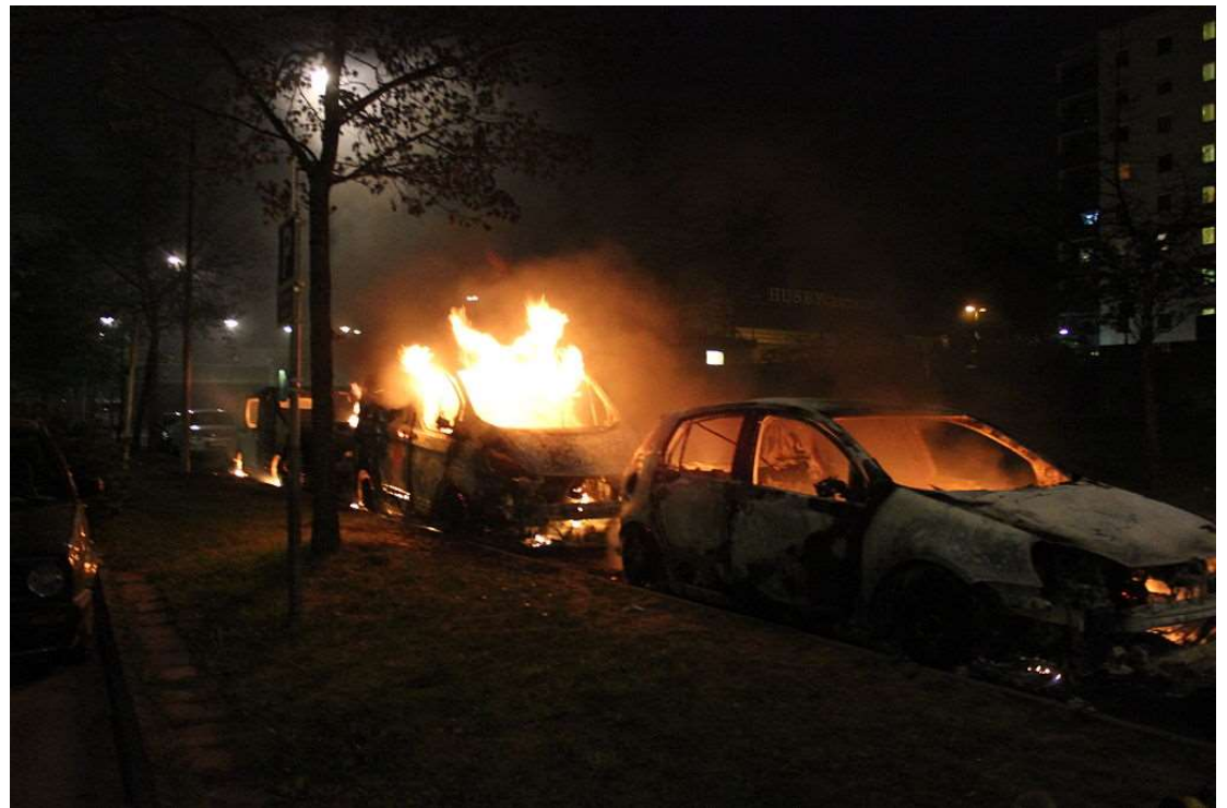
Husbyn mellakat 2013