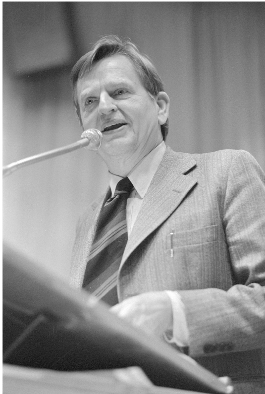
Olof Palme 1981