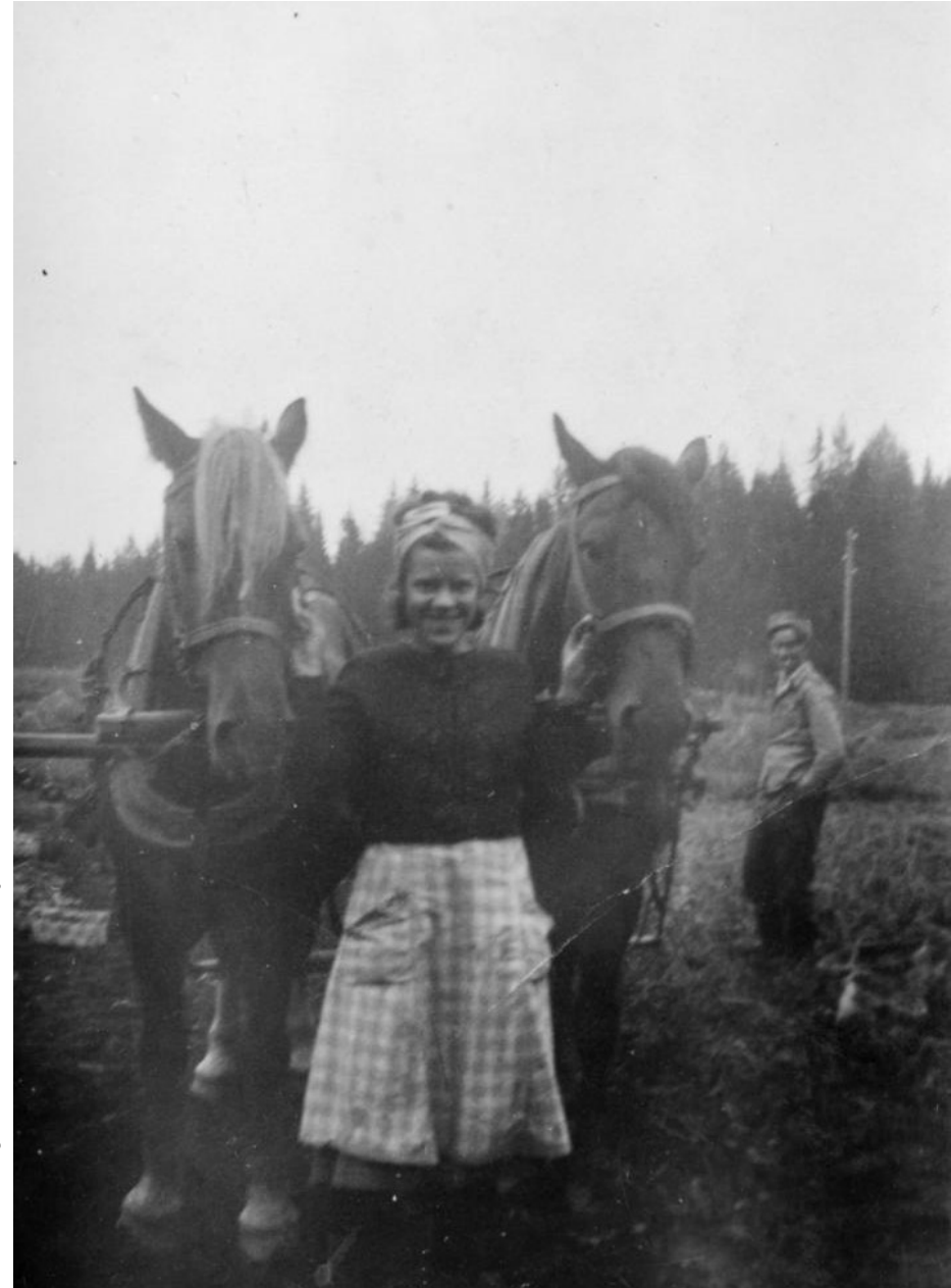
Nurmijärven museo, perunataalkoot 1941