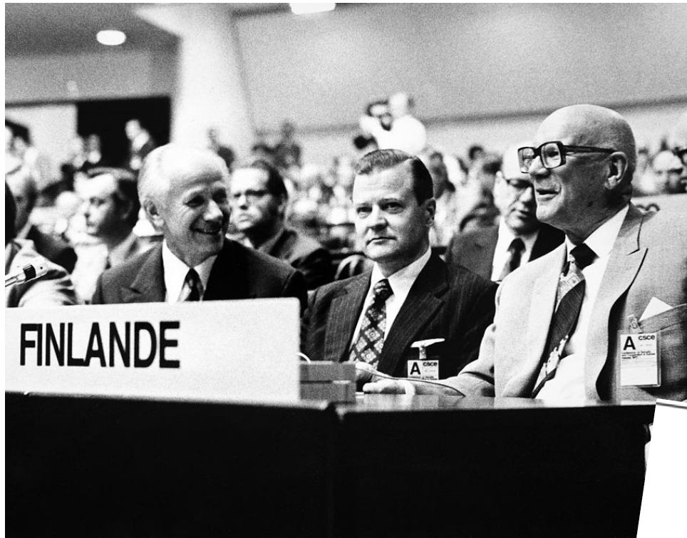
Tapio Korpisaari / Helsingin kaupunginmuseo