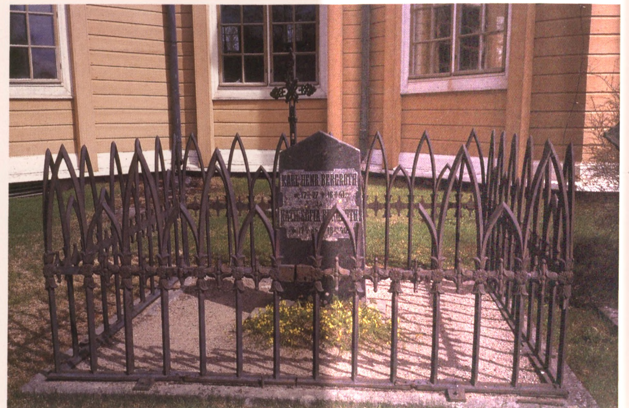
Hautaa ympäröivä valurauta-aitaus Ruoveden kirkon vierellä.