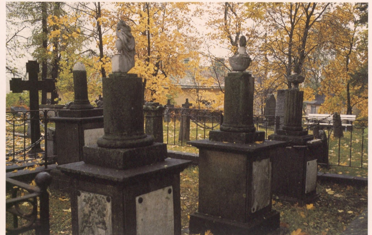
Haminan Hietäkylän hautausmaan vanhoissa hautakivissä on marmorista tehtyjä nimilaittoja ja veistoksia.

kertovat alueen väestöstä ja elinkeinoista. Vanhoissa hautamerkeissä näkyy vielä perinteiseen tapaan vainajan nimen, syntymä- ja kuolinaikojen ohella myös hänen ammattinsa. Hautakivet, muistamisen merkit, kuvastavat ihmisten yhteiskunnallista asemaa, todellista tai jossain tapauksissa myös toivottua. 1800-luvun yhteiskuntarakenteista ja arvostuksista kertoo mm. pienen seurakunnan hautausmaalle ylioppilaalle pystytetty kookas muistomerkki. Torpparin haudalla saattaa jossain olla lähes yhtä komea kivi kuin rusthollarilla.