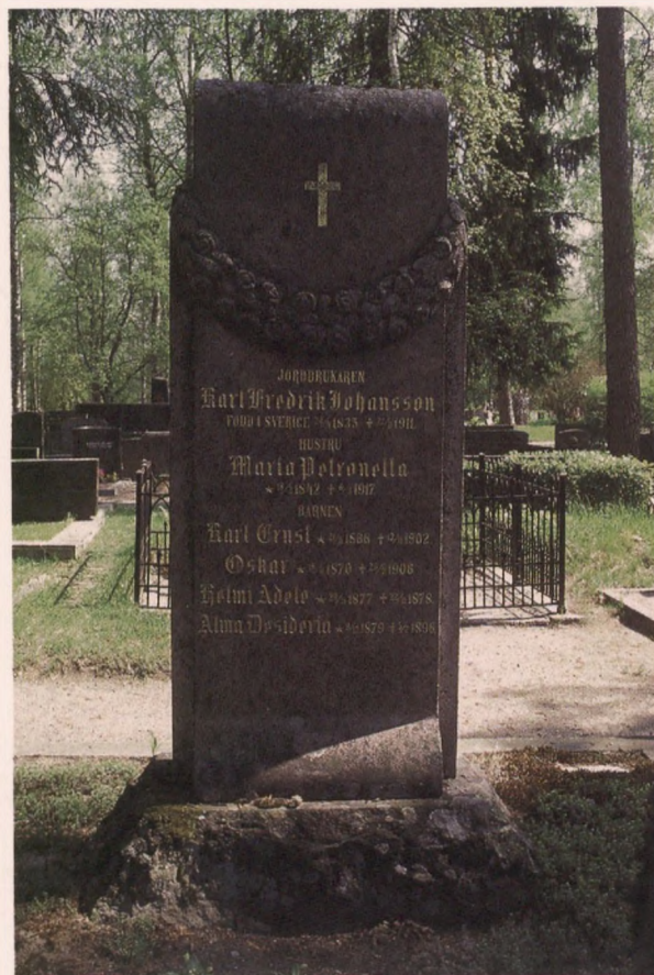
Esimerkki Mäntsälän hautausmaalta kertoo, miten vanhan hautakiven taustaa voidaan käyttää hyväksi uuden haudauksen yhteydessä.