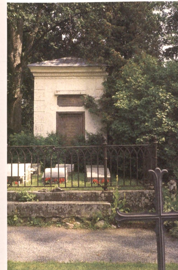
Vanajan kirkon luona oleva Harvialan kartanolle kuulunut hautakappeli on 1810-luvulta.

Kirkkojen luona olevista säätyläisten, suurtalallisten tai viranhaltijoiden itselleen ja jälkeläisilleen rakennuttamista hautakappeleista vanhimmat ovat 1600-luvun puolelta ja nuorimmat on rakennettu vasta 1900-luvun alkupuolella. Eniten niitä on Etelä-Suomen kartanoseuduilla. Rakennustaiteellisesti arvokkaat kappelit ovat paikkakunnan historiasta kertova arvokas lisä kirkkotarhassa. Monet yksityisten rakennuttamat hautakappelit kuuluvat nykyisin seurakunnille. Osa niistä on edelleen omistajasukujensa hallussa ja niitä käytetään uurnahautauksiin.