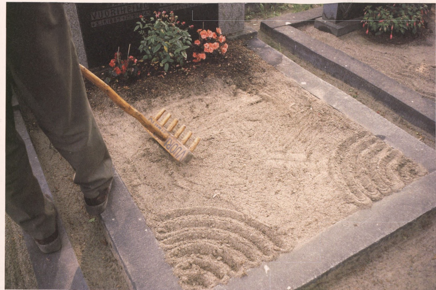
Nummen hautausmaalla on säilynyt perinteiset hoitotavat monella haudalla.