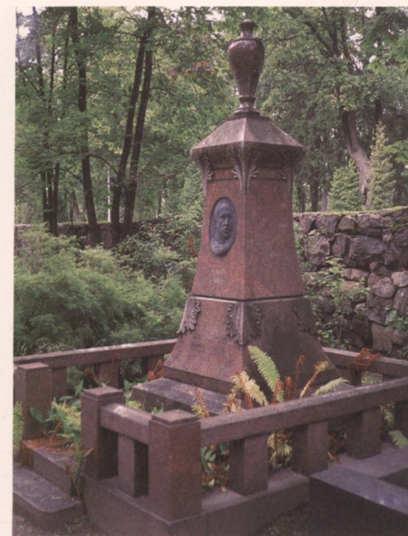
Punagraniittisessa hautamuistomerkin on vainajan pronssiin valettu muotokuvareliefi.

Mikäli puisen muistomerkin teksti halutaan maalata uudelleen, kannattaa se sivellä ohuesti perinteisellä pellavaöljymaalilla tai taiteilijatarvikkeena saatavalla sinkkivalkoisella. Tekstit uusitaan pinnan kuivuttua karkisiveltimellä ja maaliksi sopii parhaiten taulumaalauksessa käytetty nokimusta.