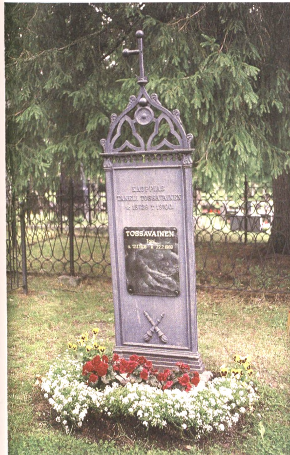
Vanhaan valurautamuistomerkkiin lisätty uusi nimilaatta, esimerkki Pielaveden hautausmaalta.

Seurakunnalle palautuneita haudalta poistettuja hautakiviä voitaisiin nykyistä enemmän käyttää hävittämisen sijasta uudelleen. Kivien uudelleen käyttö edellyttää kuitenkin niissä olevien nimien pois hiomista tai peittämistä esim. metalli- tai kivilaatalla.