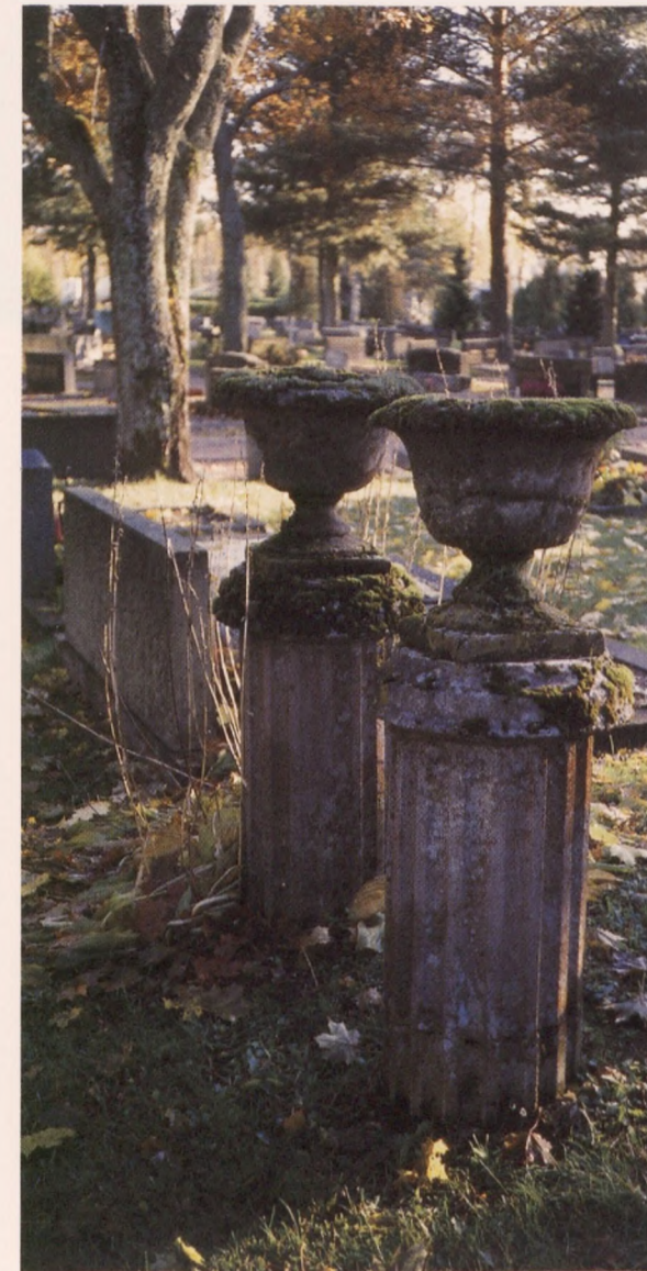
Betonista valetut hautamuistomerkit vaativat puhdistamista sekä usein myös paikkausta ja vahvistamista, mikäli niiden toivotaan säilyvän.

Hiekkapainepesua tai hiekkapuhallusta ei saa käyttää kivipinnoille, sillä se tuhoaa kiillotetut pinnat sekä hävittää tekstien kultaukset ja muut yksityiskohdat.