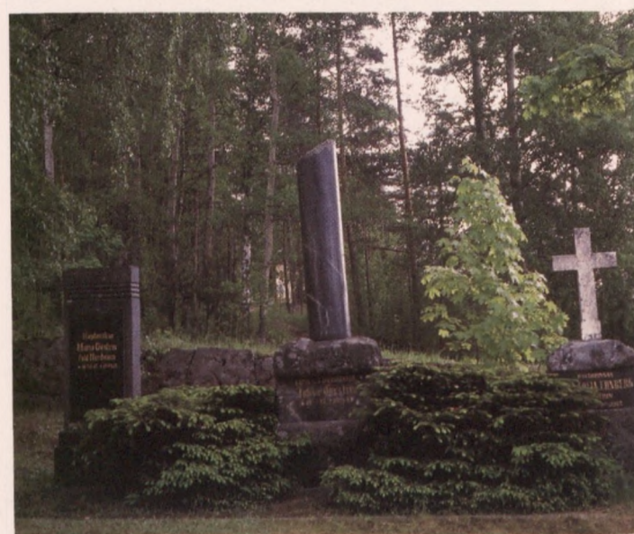
Erityyppisiä hautakiviä Jaalan kirkkotarhassa olevalla sukuhaudalla.

Vaikka kivi koetaankin "ikuiseksi" materiaaliksi, tarvitsee myös kivinen hautamuistomerkki huoltamista pysyäkseen kunnossa ja ehjänä.