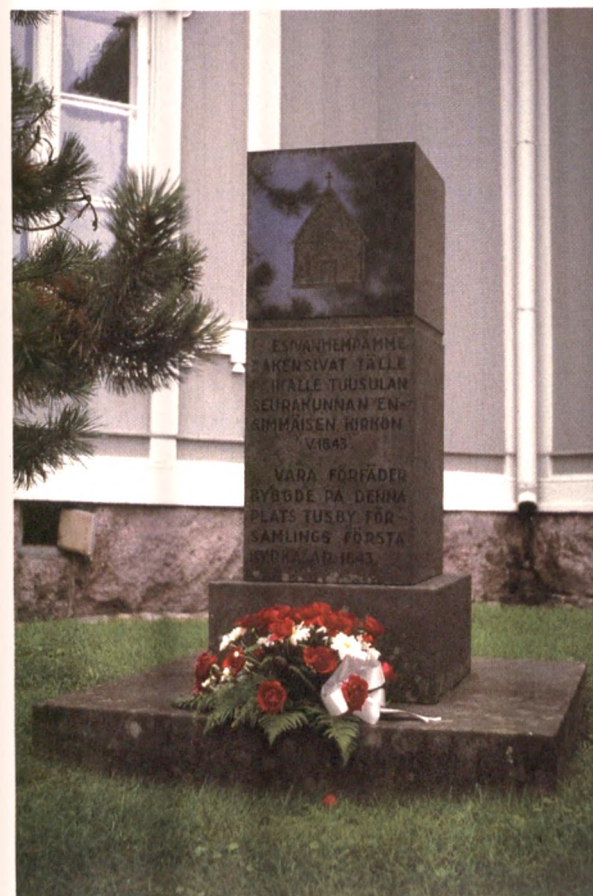
Tuusulan ensimmäisen kirkon muistokivi nykyisen ristikirkon vierellä.

Sankarihauta-alueen ohella kirkkotarhassa on usein myös muita yhteisiä muistomerkkejä. Esimerkiksi vuoden 1920 kirkkolaki edellytti vanhojen kirkonpaikkojen merkitsemistä muistokivellä. Karjalan Liitto on paikalliseurojensa välityksellä huolehtinut luovutetulle alueelle jääneiden vainajien muiston säilyttämisestä siirtoväen sijoitusseurakuntien kirkkojen läheisyyteen pystytetyillä muistomerkeillä. Useimmat niistä toteutettiin Karjalan Liiton paikalliseurojen tarpeisiin laatimilla mallipiirustuksilla. Lisäksi muistomerkkejä on pystytetty nälkävuosien uhreille,