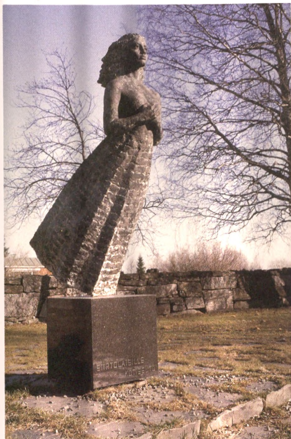
Kotiseudun siirtolaisille pystyttämä muistomerkki Alajärven kirkkotarhassa.

Laajojen kansalaispiirien perustama Sankarivainajien Muistotoimikunta välitti seurakunnille apua alueiden suunnitteluun. Arkkitehtien ja kuvanveistäjien yhteistyönä syntyneet myös taiteellisesti korkeatasoiset sankarihauta-alueet patsaineen ovatkin ainutlaatuinen todistus kansakunnasta, joka haudasi sodissa kaatuneet vainajansa oman kotipitäjän kirkkotarhaan.