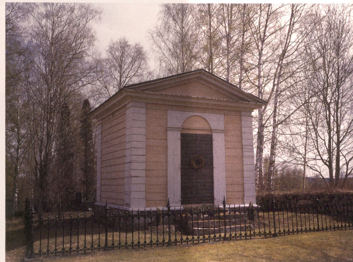
Pekkalen kartanon 1840-luvulla rakennettu uusklassillinen hautakappeli Ruoveden kirkkotarhassa.