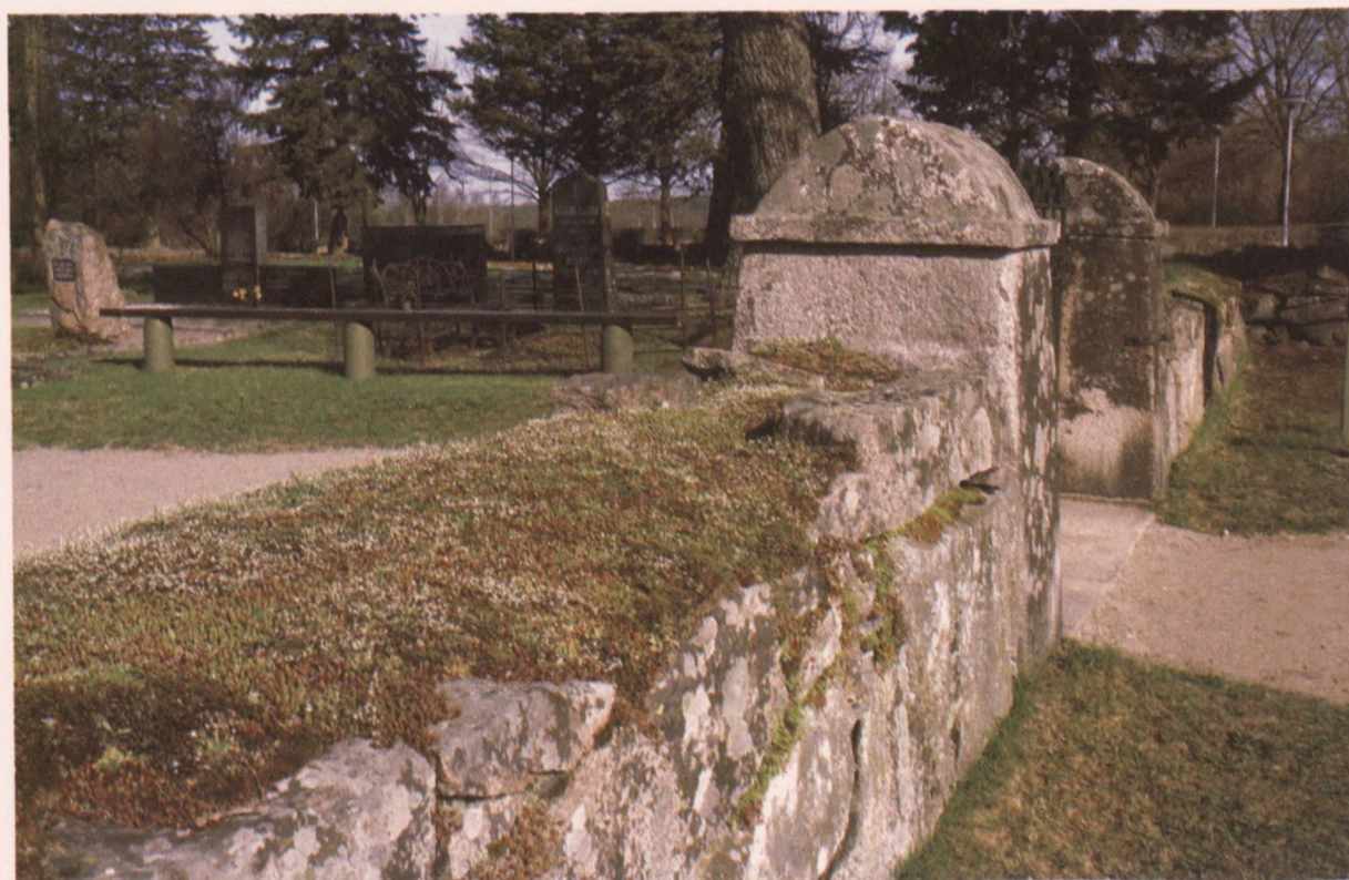
Inkoon kirkkotarhan kauniisti ladottu kiviainetta portinpylväineen.

Jo vuoden 1686 kirkkolaissa ja järjestyksessä todetaan, että kirkkotarhat pitää aidata hyvin ja hoitaa kunniallisesti niiden tähden, jotka niissä lepäävät. Kirkkotarhan aita on tärkeä elementti, jonka kunnosta ja hoidosta kannattaa huolehtia.