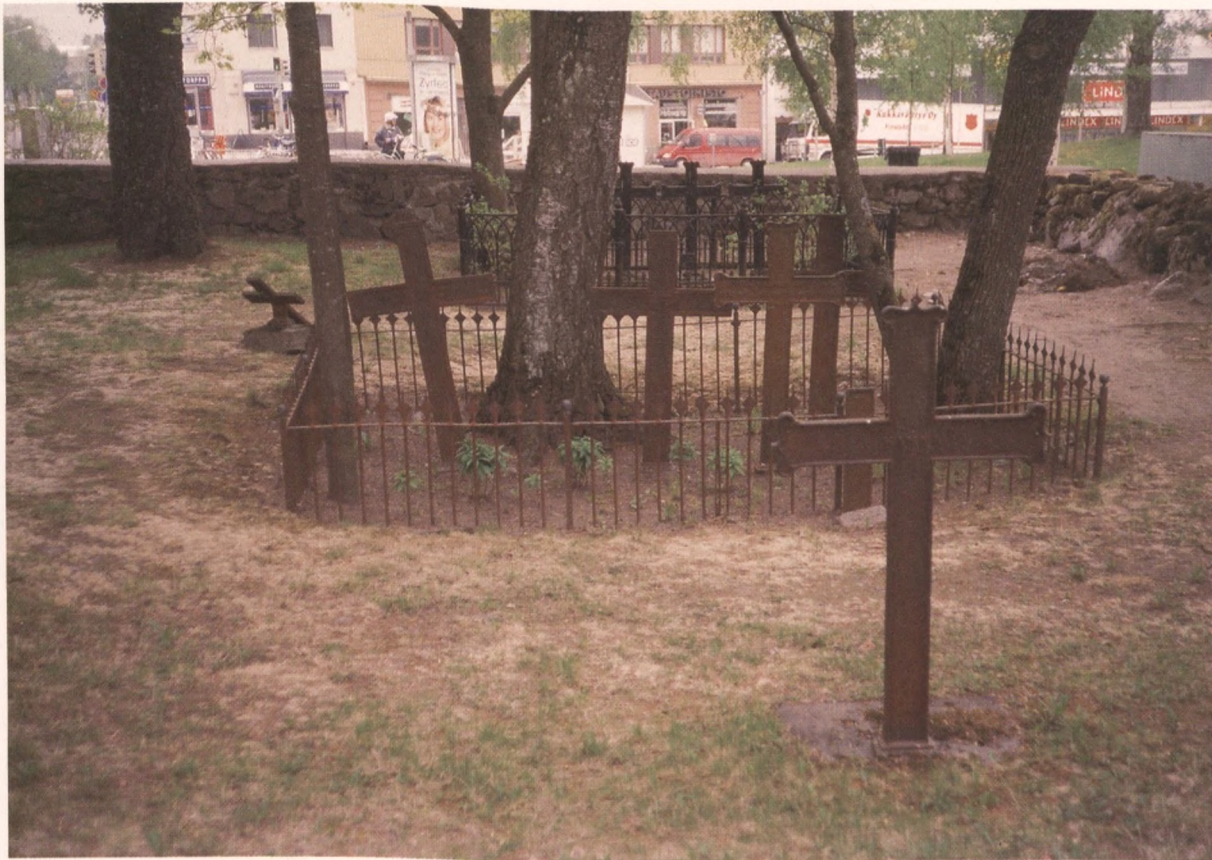
Maan sisään osittain uponnut valurauta-aitaus ja vinot ruosteiset ristit kertovat hoitamattomuudesta.

Professoreilla ja kirkkoherroilla on lähes kaikilla samankaltaiset arvokkaat hautakivet, joihin heidän kaikki arvonimensä ovat tarkasti merkityt. Suurissa kaupungeissa tieteen, taiteen tai muun arvokkaan yhteiskunnallisen toiminnan henkilön hautakiven saattoi pystyttää lähipiiri, ystävät tai tiedeyhteisö. Maaseudulla taas moni seurakunta on pystyttänyt muistomerkin pidetyn ja arvostetun sielunpaimenensa haudalle.