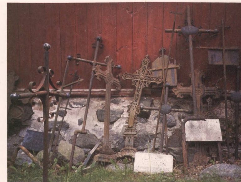
Kirkon seinustalle kerätyt vanhat hautamuistomerkit eivät ole kenellekään kunniaksi.

Vanhimmat hautamuistomerkit ovat yleensä kirkon läheisyydessä. Ne ovat myös komeimmat ja muodostavat arvokkaan osan paikallista kulttuurihistoriaa ja perinnettä. Monet seurakunnat ovat rauhoittaneet tämän alueen uudistuksilta ja ottaneet muistomerkit hoitoonsa. Hautamuistomerkit