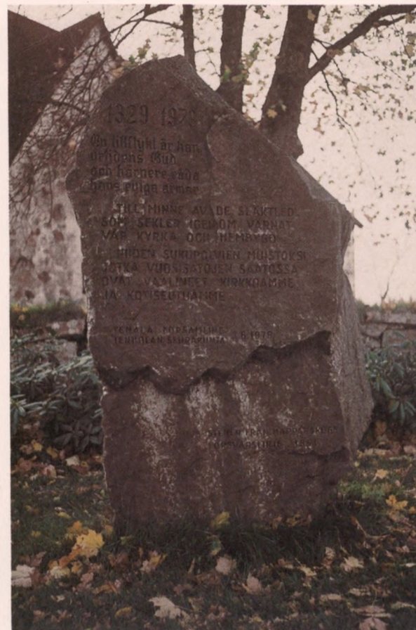
Tenholan seurakunnan menneille sukupolville pystyttämä muistomerkki.

suoronnettomuuksissa menehtyneille, menneille sukupolville, unohdetuille vainajille, selkien soutajille, siirtolaisille tai pitäjässä syntyneille merkkihenkilöille. Kirkkotarhojen uusimpia muistomerkkejä ovat muistelupaikat, joihin voi jättää kynttilätervehdyksen muualle haudatuille omaisille sekä viime sotiin liittyvät erilaiset veteraanimuistomerkit.