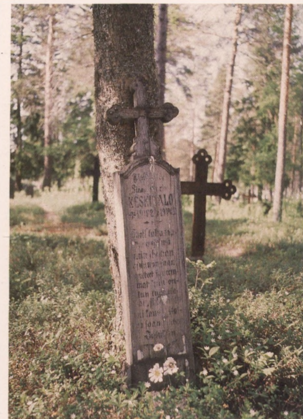
Puiset hautalaudat ovat häviävää hautausmaakulttuuria kaikkialla Suomessa.

Puisia hautamerkkejä uusittaessa materiaalina ei pidä käyttää painekyllästettyä puuta. Vihertäväsävyinen puuristi ei ole kaunis katsella ja mikä pinta käsittely ei sen päällä pysy.