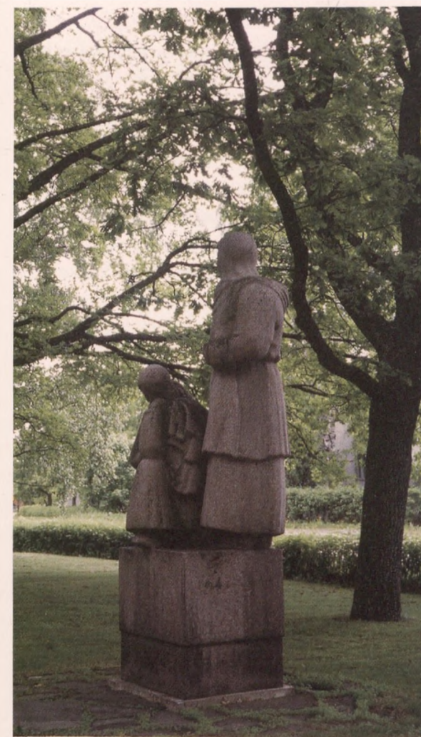
Hautakiven tai myös sankaripatsaan vesipesu harjalla kerran vuodessa on yksinkertainen ja halpa hoitotapa.

Puhdistaminen aloitetaan kastelemalla kiveä perusteellisesti ja kosteuden annetaan pehmittää lika- ja kasvukerroksia muutaman tunnin ajan. Kosteutus- ja pesuveteen voidaan vaikutuksen parantamiseksi sekoittaa pieni määrä mäntynestesaippuaa tai neutraalia pesuainetta, esim. tavallista astianpesunestettä. Kiven peittäminen märällä kankaalla tai säkillä sekä sen päälle laitettulla muovilla edesauttaa kostumista. Tämän jälkeen märkä kivi harjataan puhtaaksi esimerkiksi astianpesu- tai juuriharjalla, pinttyneimmät kohdat