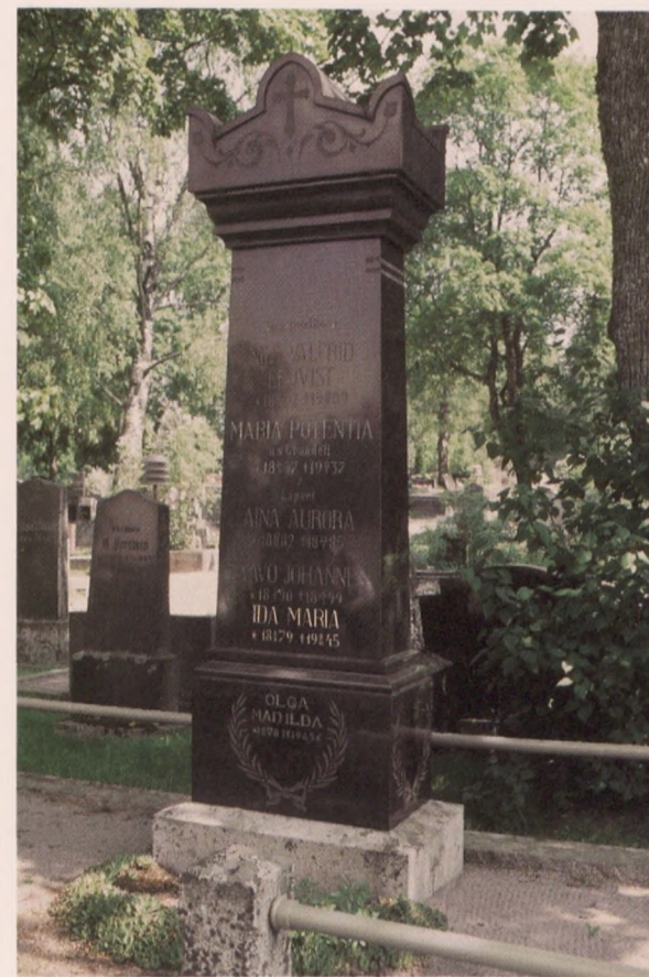
Kaikkia kultauksia ei tarvitse kerralla uusia. Eri sukupolvet voivat erottua myös eri-aikaisissa kultauksissa. Mustasta kiillotetusta graniitista tehty hautakivi Karjalohjan hautausmaalla.

kynsiharjalla. Harjauksen jälkeen kivi huuhdellaan hyvin vaikkapa kaatamalla puhdasta vettä kastelukannusta. Huuhtelua voidaan tehostaa hankaamalla kiveä pesusienellä. Vasta kiven kuivumisen jälkeen nähdään, onnistuiko työ ja tuliko pesu ja harjaus tehtyä tasaisesti. Jos kivessä on edelleen lika- tai levälaikkuja, kannattaa käsitellä toistaa, kunnes tyydyttävä tulos on saavutettu.