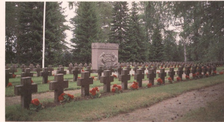
Vieremän hautausmaan sankarihauta-alue kiviristeineen.

Hautausmaille aiottuja uudistuksia suunniteltaessa lähtökohtana pitäisi olla hautamuistomerkkien inventointi, johon sisältyy myös selvitys alueen historiallisista vaiheista ja erityispiirteistä. Sen pohjalta voidaan arvioida esitettyjen toimenpiteiden laajuutta ja sopivuutta, jotta hautausmaan perusilme säilyisi rajuilta muutoksilta. Lapuan ja Tampereen hiippakuntien seurakunnissa onkin 1990-luvulta lähtien tehty lukuisten hautausmaiden inventoinnit.