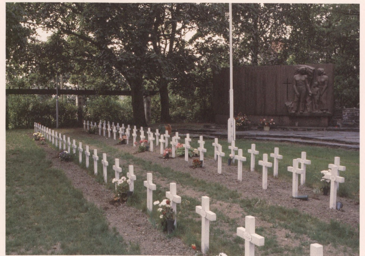
Vihdin kirkkotarhan sankarihauta-alueella on säilytetty puuristit.

Sankarihaudat, sodissa kaatuneiden yhtenäiset veljeshaudat yhteisen muistomerkin äärellä, ilmestyivät Suomen kirkkomaille talvella 1918. Sotatoimien keskellä Vaasassa toiminut senaatti antoi ohjeet haudata kaatuneet suojeluskuntalaiset kotipiittäjiensä kirkkomaille yhteiseen hautaan, sotilaallisiin ja yksinkertaisiin menoin, silmällä pitäen myös yhteisten muistomerkkien pystyttämistä tulevaisuudessa. Talvisodassa palattiin samaan käyttöön. Ylipäällikön määräyksen mukaisesti kuljetettiin sekä vuosien 1939–1940 että 1941–1944 sodissa kaatuneet kotiseurakunnan sankarihautoihin.