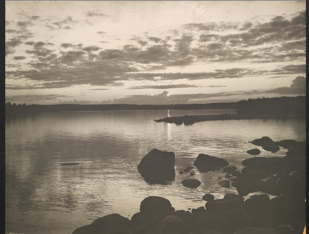
Aarne Tengén: Rantamaisema , 1915, hopeagelatiinivedos, SVM