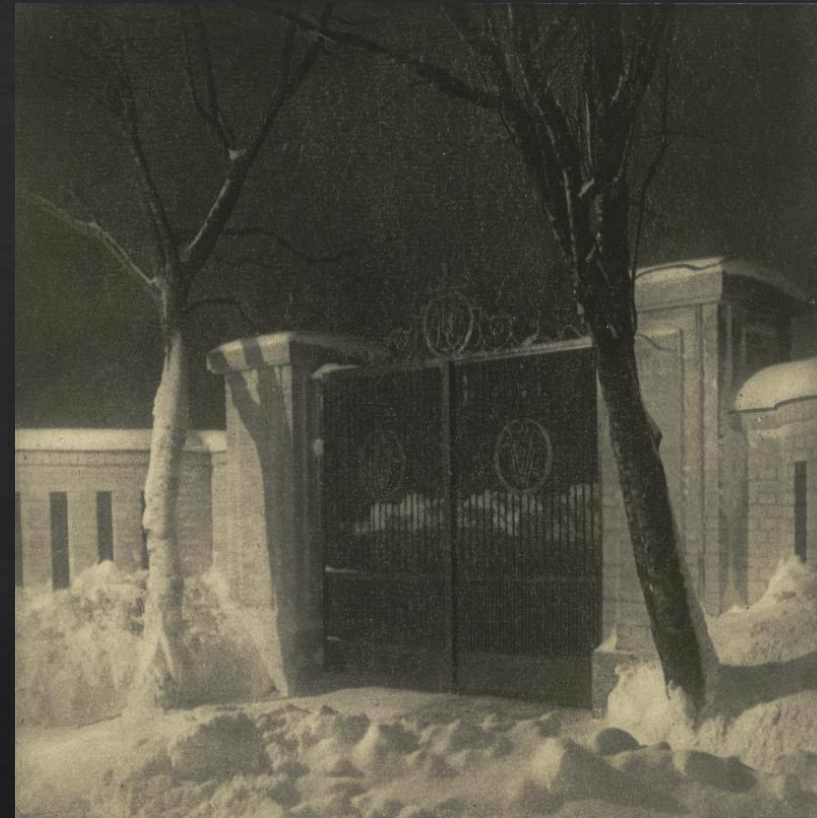
Oiva Kallio: Aihe Kaivopuistosta , 1924, bromiöljysiirtovedos, SVM