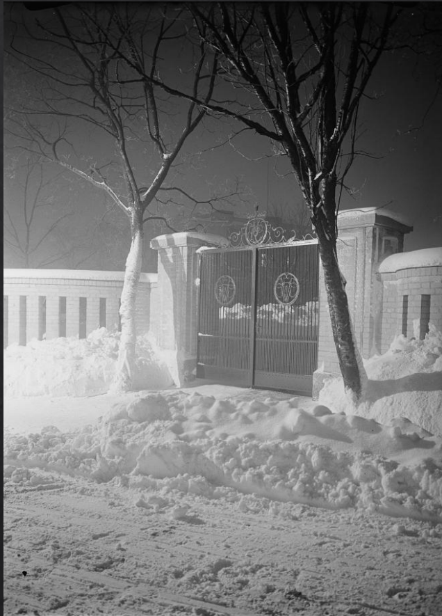
Oiva Kallio: Aihe Kaivopuistosta , 1924, hopeagelatiininegatiivi, SVM