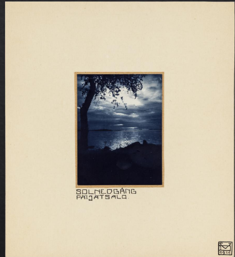
Väinö Donner: Solnedgång, Päijätsalo , 1914, hiilivedos, SVM