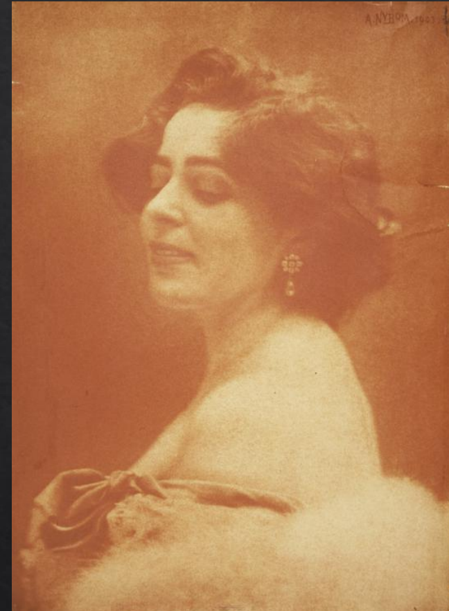
Alfred Nybom: Paronitar von Schindler , 1903, kumibikromaattivedos, SVM