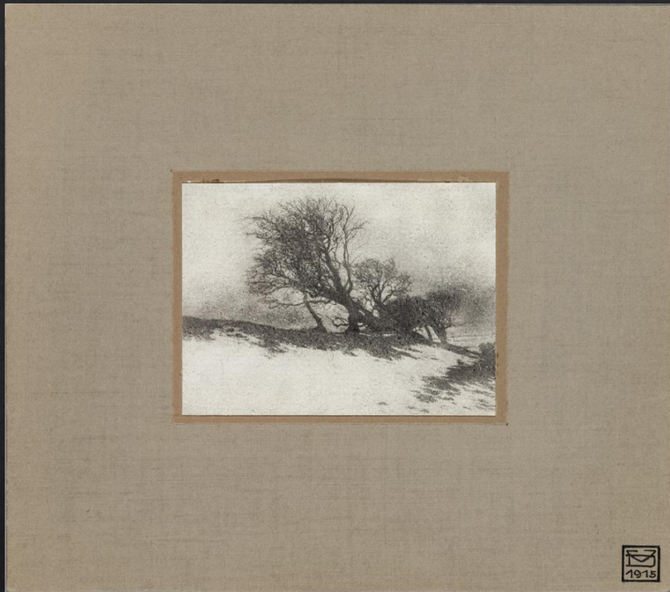
Väinö Donner: Danska dyner , 1915, bromiöljyvedos, SVM