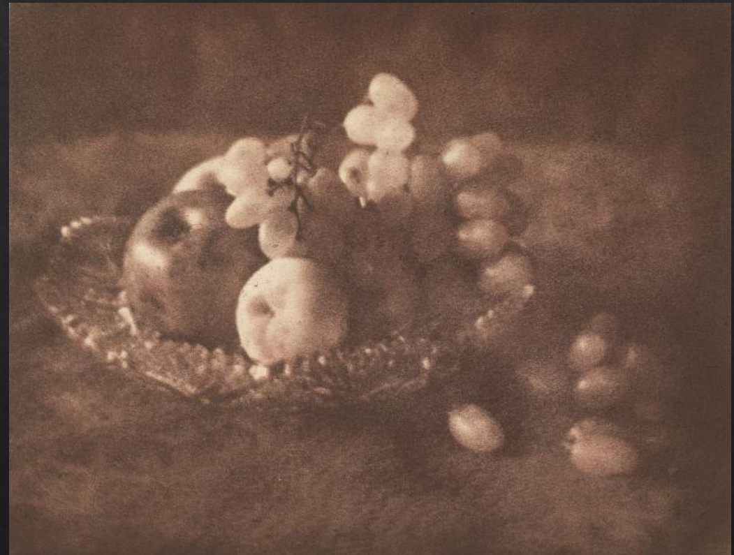
Aarne Pietinen: Hedelmiä , 1928, bromiöljysiirtovedos, SVM