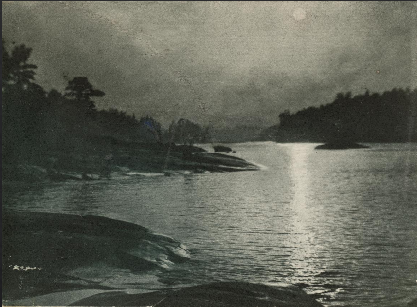
Aarne Uusikylä: Sumun hälvetessä , 1920-luku, bromiöljyvedos, SVM