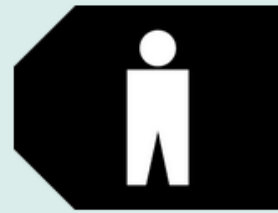
TK Men General (TK MG)