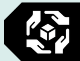
TK Culturally Sensitive (TK CS)