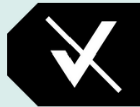
TK Non-Verified (TK NV)