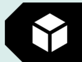
TK Secret / Sacred (TK SS)