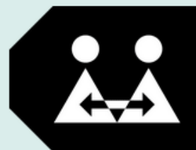
TK Women Restricted (TK WR)