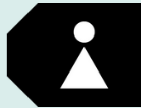
TK Women General (TK WG)