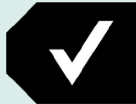
TK Verified (TK V)

Protocol Labels outline traditional protocols associated with access to this material and invite viewers to respect community protocols.