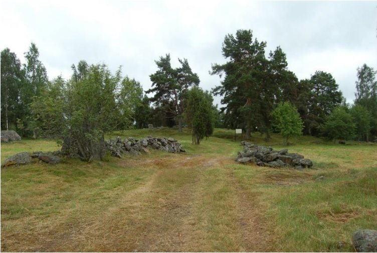
Laitila Savemäki. Vanhemman roomalaisajan kalmistoalueella on nähtävissä erilaisia kivirakenteita. Kalmisto sijaitsee peltojen välisellä moreeniharjanteella. Teija Tiitinen 2009, DG1992:8, Museovirasto.