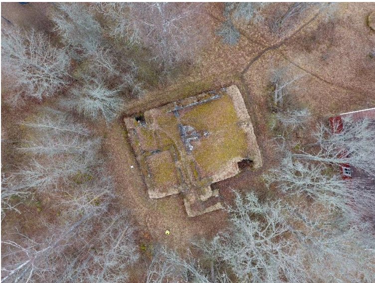
Salo Haapaniemen linna. Keskiajalla 1450–1525 rakennetun kivisen kartanolinnan rauniot. Linna raunioitui jo 1700-luvulla. Alueella sijaitsee yhä asuttu 1700-luvulla valmistunut kartano. Sanna Saunaluoma 2022, TMK VARK 157, Turun museokeskus.

Turun seutu oli jo rautakauden lopulla muodostunut Varsinais-Suomen asutuksen ja kaupankäynnin keskuksiksi. Alueen maantieteellinen asema tarjosi hyvät liikenneyhteydet sekä merelle että saaristoon ja toisaalta sisämaan pyyntialueille. Liikenteen solmukohtaan Aurajoen varrelle kehittyneelle kauppapaikalle sijoittui keskiajan alussa myös kirkollisen toiminnan keskus. Linnoitettu piispantila ja kirkko – eli Suomen lähetyshiippakunnan keskus – perustettiin 1200-luvulla Koroisiin. Siitä pidemmälle joen yläjuoksulle laivoilla ei enää ollut mahdollista nousta. 1200-luvun lopulla piispankirkko siirrettiin noin 1,5 kilometriä jokivartta alemmas Unikankareelle, jonka eteläpuolelle kirkko, Ruotsin kruunu ja dominikaanit perustivat Turun kaupungin. Kaupungin suojaksi Aurajoen suualueelle oli samanaikaisesti jo ryhdytty rakentamaan Turun linnaa. Valtakunnan itäosassa kirkollista valtaa tukemaan perustettiin piispankartano Kuusistoon 1300-luvun alussa, jolloin Koroisten merkitys oli jo hiipumassa. Kirkolliseen kulttuuriin liittyi myös maakunnan toisen keskiaikaisen kaupungin perustaminen Naantaliin vuonna 1443. Naantalin synty on poikkeuksellinen Suomen muihin kaupunkeihin verrattuna, sillä sitä ei perustettu hallinnolliseksi keskuksiksi. 1440-luvulla perustetun Birgittalaisluostarin viereen kehittyi välitellen kaupunki, kun paikalle saapuneet pyhiinvaeltajat tarvitsivat erilaisia palveluita.