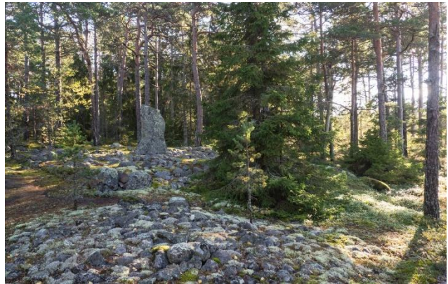
Pystykiviä roomalaiseen rautakauteen ajoittuvissa hautapaikoissa. Laitila Savemäki (vasemmalla). Rautakauteen vanhemmalle roomalaisajalle ajoittuvassa kalmistossa on runsaasti erityyppisiä kivistä tehtyjä hautarakenteita. Kuvan keskellä erottuu hautarakenteeseen kuuluva neliskulmainen pystykivi.