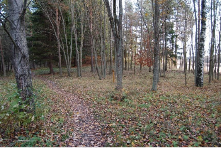
Turku Kotirinne. Neoliittisen kivikauden lopulla ja pronssikaudella käytetty asuinpaikka, josta on löydetty Suomen vanhimmat tunnetut ohranjyvät. Kuvassa metsässä sijaitsevaa asuinpaikan osaa. Teija Tiitinen 2005, AKDG5679:5, Museovirasto.