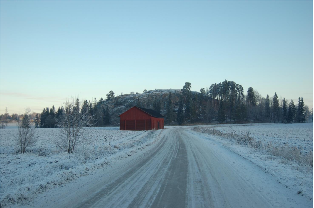
Lieto Vanhalinna. Aurajoen ja Hämeen Härkätien vierellä sijaitsevaa muinaislinnaa on käytetty pronssikaudelta keskiajalle, 1300-luvulle. Kuvassa korkealla kalliolla sijaitseva muinaislinna on kuvattuna talviaamuna Hämeen Härkätieltä. Teija Tiitinen 2005, AKDG5674:3, Museovirasto.