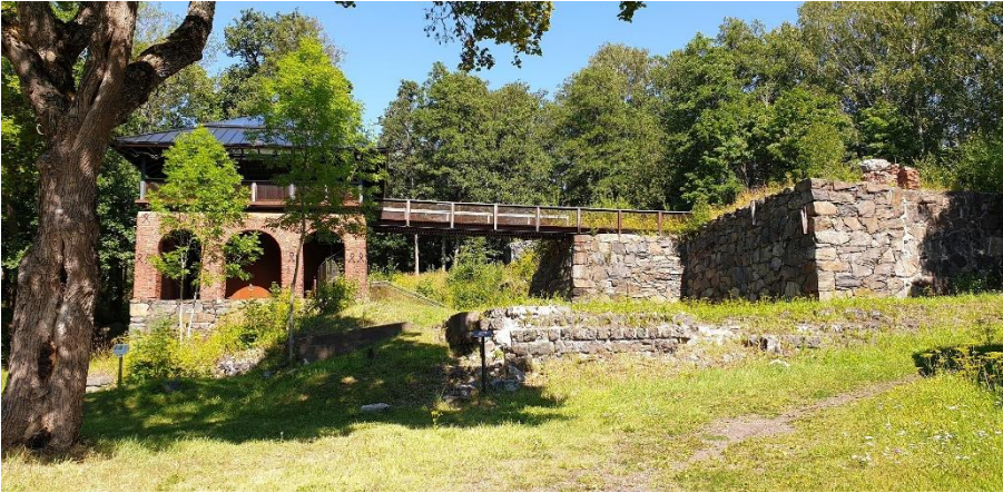
Kemiönsaari Taalintehtaan ruukki. 1600-luvulla perustetun ruukin masuunirakennus ajoittuu 1800-luvulle. Teija Tiitinen 2019, AKDG5856:1, Museovirasto.

Kuten koko Suomen etelärannikko, myös Varsinais-Suomi on tunnettujen hylkyjen osalta Suomen rikkainta aluetta. Jo mainitun Vidskärin keskiaikaisen hyllyn lisäksi VARK-kohteina ovat yksimaistoisien 1500-luvun puulaivan hylky (Kemiönsaari Metskär) ja 1600-luvun männystä rakennetun kotimaisen limisaumaisen talonpoikaisaluksen hylky (Kemiönsaari Purunpää Oxholmen 1) sekä useita ulkomaisten kauppa-alusten hylkyjä 1600-luvulta (Parainen Gråharuna) ja 1700–1800-luvuilta (Kemiönsaari Keulakuvahylky; Parainen Borstö 1, Skeppsbådarna itäpuoli ja Vrouw Maria). Nuorin mukana oleva hylkykohde on venäläinen purje- ja höyrylaivojen välikauden sota-alue, Kemiönsaari Ladoga, joka upposi vuonna 1915.