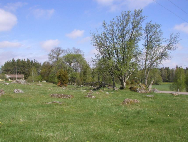
Laitila Mäki. Muinaispeltoalueen raivaushistoria on alkanut varhaisrautakaudella ja jatkunut viikinkiaikana. Alueelta on löydetty myös yksi kuppikivi. Valtaosa maan pinnalle näkyvistä rakenteista on kuitenkin todennäköisesti historialliselta ajalta. Alue on nykyisin laitumena.

Varsinais-Suomen yhteydet länteen ovat alkaneet tiivistyä jo kivikauden lopulla, mutta pronssikautisten rökkiöhautojen rakenteista löydettyissä esineissä nämä kontaktit ovat nähtävissä selvimmin. Läntisestä vaikutuksesta kertoo muun muassa Liedon Kotokallion hautaröykkiön pronssikauden II periodille (1500–1300 eaa.) ajoittuva hautaus, josta löytyneet hauta-antimet ovat peräisin nykyisen Pohjois-Saksan tai Tanskan alueelta.