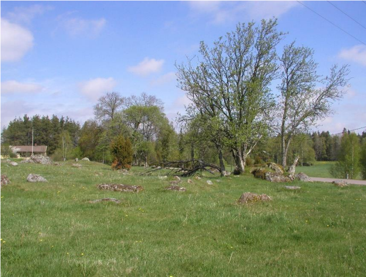
Letala Mäki. Ett forntida åkerområde, vars röjningshistoria inleddes under den tidiga järnåldern och fortsatte under vikingatiden. På området har det också hittats en skålgropssten. Största delen av de konstruktioner som syns på markytan är dock sannolikt från historisk tid. Området är numera betesmark. Teija Tiitinen 2010, AKDG5664:3, Museiverket.

Egentliga Finlands kontakter västerut började intensifieras redan i slutet av stenåldern, men dessa kontakter kan ses ännu tydligare i konstruktionerna på rösegravarna från bronsåldern och i de föremål som hittats i dem. Om västliga influenser berättar bland annat gravröset Kotokallio i Lundo, som dateras till bronsålderns period II (1500–1300 f.v.t.) och i vars grav det har hittats föremål med ursprung i nutida nordtyska eller danska områden.