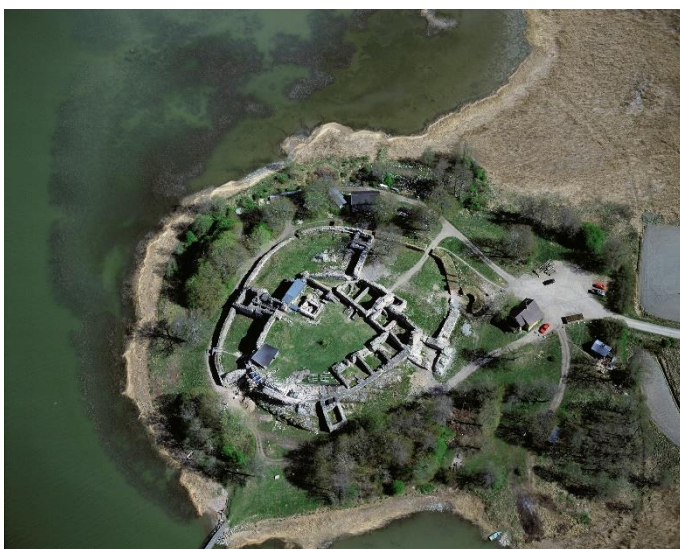
S:t Karins Kustö biskopsborg. Flygfoto av den medeltida biskopsborgen som ligger vid kusten längst ute på en udde skyddad av vallgravar. Ruinen efter borgen består av en huvudborg och tre förborgar. Efter reformationen 1527 bestämdes det att borgen skulle rivas.

Näringsgrenshistorien framkommer i de objekt som är förknippade med gruvindustrin och bland dem finns Malmbergets, Orijärvi och Vihiniemi gruvområden samt industriobjekt som de arkeologiserade strukturerna i anknäring till fornlämningarna i Dalsbruk på Kimitoön samt Kustö bruk i Salo. Av arbets- och tillverkningsplatserna bedöms kvarnarna vid Latokartano fors i Salo och i Kärpjoki i Lundo vara av riksintresse. Den senare har visserligen bedömts vara av riksintresse främst på grund av hällristningarna framför den från 1600-talet till slutet av 1800-talet.