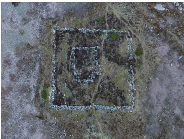
Pargas Jurmo Grönnviken. Flygfoto av stengrunden till och den omgivande muren runt ett skärgårdskapell från historisk tid. Objektet finns på en moränås i öppen omgivning i den yttre skärgården.