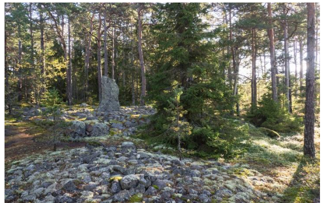
Bautastenar på gravplatser som kan dateras till den romerska järnåldern. Letala Savemäki (till vänster). Gravfält som kan dateras till järnåldern till äldre romersk tid där det finns gott om olika typer av gravkonstruktioner gjorda av sten. Mitt i bilden framträder en fyrkantig bautasten sten som är en del av gravkonstruktionen.