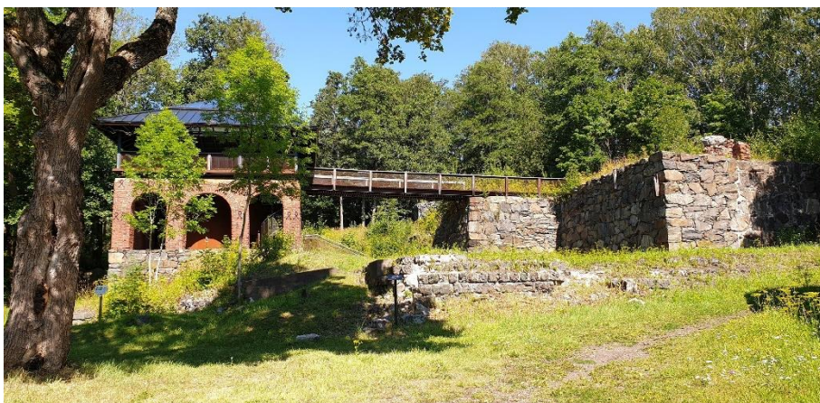
Kimitön Dalsbruks bruk (fi Taalintehtaan ruukki). Masugnsbyggnaden i det på 1600-talet grundade bruket dateras till 1800-talet. Teija Tiitinen 2019, AKDG5856:1, Museiverket.

Precis som hela Finlands sydkust är Egentliga Finland när det gäller vrak känt som ett av de fyndrikaste områdena i Finland. VARK-objekt utöver det redan nämnda medeltida vraket Vidskär är vraket efter ett enmastat träfartyg från 1500-talet (Metskär på Kimitoön), vraket efter ett 1600-tals inhemskt klinkbyggt träfartyg av furu i allmogestil (Kimitoön Purunpää Oxholmen 1), vrak efter utländska handelsfartyg (holländska, engelska, tyska och svenska) från 1600-talet (Pargas Gråharuna) och från 1700–1800-talet (Kimitoön Galjonsbildsvraket; Pargas Borstö 1, Skeppsbådarna östra sidan och Vrouw Maria) samt ett ryskt krigsfartyg från tiden mellan segel- och ångfartyg (Kimitoön Ladoga, sjönk 1915).