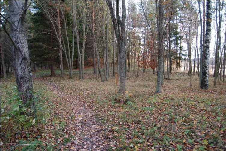
Åbo Kotirinne. Boplats som användes i slutet av den neolitiska stenåldern och under bronsåldern där Finlands äldsta kända kornkärnor har hittats. På bilden en videbevuxen del av boplatsen som finns i skogen och där det är betydligt fuktigare än det övriga området.