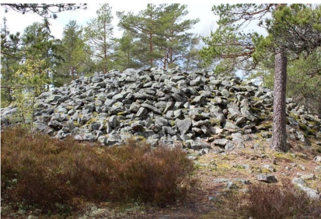
Salo Ilmusmäki. Det stora gravröset från bronsåldern ligger på en hög bergsbacke. Röset har en diameter på över 15 meter. Tanja Ratilainen 2020, TMK VARK 103, Åbo museicentral.

Vid istidens slut låg största delen av Egentliga Finland under havsytan och därför finns det i området inte boplatser från den tidigaste pionjärbosättningen. Det har också funnit sparsamt med bosättning i området under den yngre mesolitiska det vill säga förkeramiska stenåldern. Stenåldersobjekten av riksintresse i landskapet kan alla dateras till den neolitiska det vill säga keramiska stenåldern och till mitten och slutet av den (i grova drag 4000–1700 f.v.t.) kan största delen av områdets stenåldersobjekt dateras. De äldsta VARK-objekten från den neolitiska stenåldern hör till det keramiska skedet Jäkärälä omkring cirka 4000 f.v.t (Mynämäki Aisti och Kimitoön Nöjis).