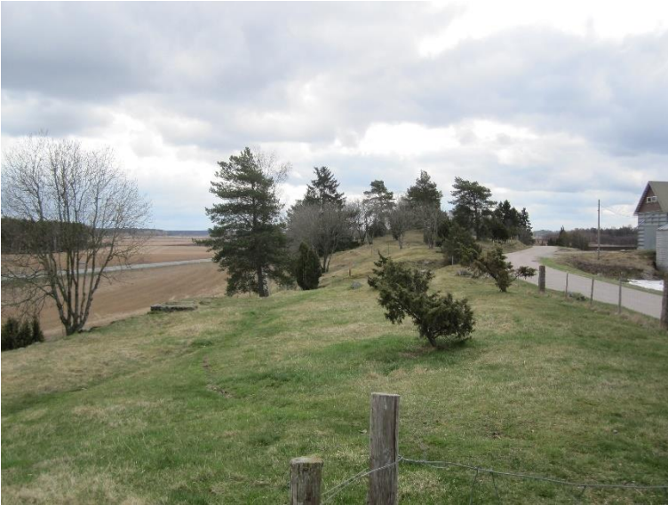
Letala Untamalas Myllymäki. Järnålders gravfält med gravkullar på åsen i Untamala. Gravfältet kan dateras till romartiden och folkvandringstiden. Teija Tiitinen 2010, AKDG7237:1, Museiverket.