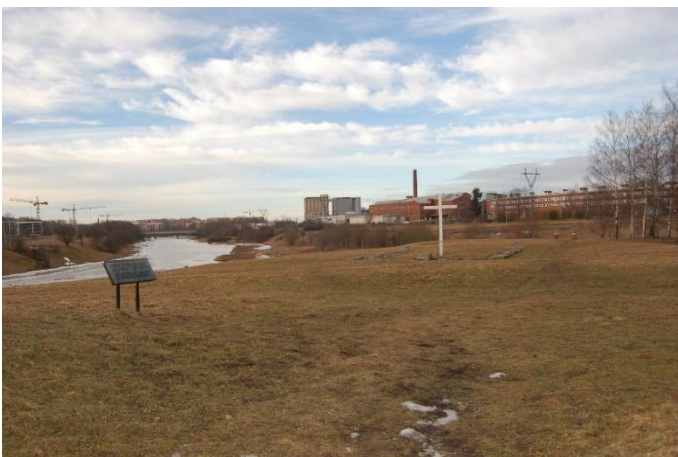
Åbo Korois udde. Administrativt centrum på 1200-talet, där det på den befästa udden funnits en kyrka, biskopens residens byggd av sten och ett försvarstorn. Objektet ligger på udden där Aura å och Lillån flyter samman.