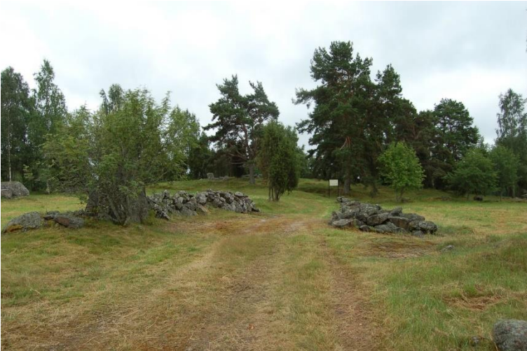
Laitila Savemäki. Vanhemman roomalaisajan kalmistoalueella on nähtävissä erilaisia kivirakenteita. Kalmisto sijaitsee peltojen välisellä moreeniharjanteella. Teija Tiitinen 2009, DG1992:8, Museovirasto.