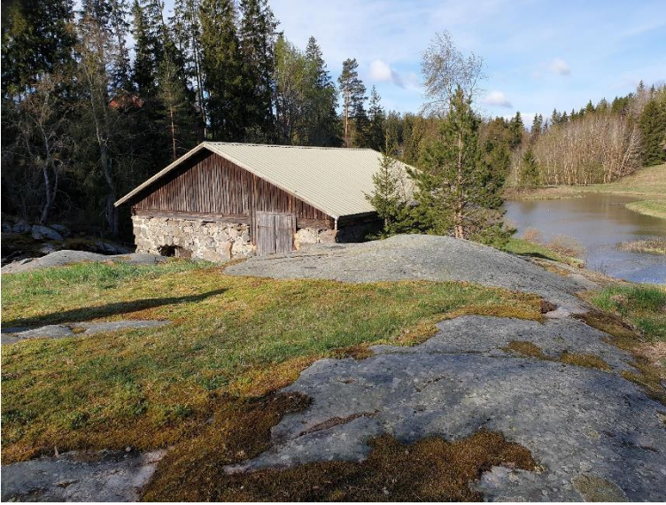
Lieto Kärpijoen mylly. Vanha vesimyllyn paikka, jonka viereisessä avokalliossa on hakkauksia 1600–1800-luvuilta. Vanhin hakattu vuosiluku on 1633.