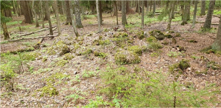
Borgå Hotton Storkärrbacken. Det jordblandade röset från järnåldern ligger på en skogklädd backsluttning. Teija Tiitinen 2019, AKDG5844:3, Museiverket.