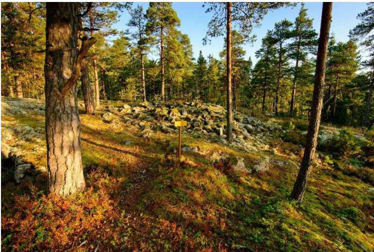
Siuntio Krejansberget 2. Pronssikautinen hautaröykkiö, joka sijaitsee korkean kallion päällä. Vesa Laulumaa 2014, AKDG3997:2, Museovirasto.

Pronssikausi on edustettuna VARK-kohteissa useilla aikakaudelle tyypillisillä kookkailla hautaröykkiöillä, joita löytyy korkeiden kallioiden päältä koko Uudenmaan rannikolta. Rautakauden alussa Uusimaa eriytyy kahteen erilaiseen alueeseen. Länsiosassa on runsaasti esiroomalaiselle ja roomalaiselle rautakaudelle (500 eaa. – 400 jaa.) sekä keskirautakaudelle (kansainvaellus- ja merovingiaika, 400–600 jaa.) ajoittuvia asuinpaikkoja ja hautauksia kuten tarhakalmistoja, röykkiöitä, polttokenttäkalmistoja. Karjaalla on useita yksittäisiä merkittäviä rautakauden kohteita (esimerkiksi Kroggårdsmalmen ja Hönsåkerskullen) ja Karjaan Lepinjärven kohteista muodostuu poikkeuksellisen hieno kokonaisuus. Uudenmaan länsiosaan verrattuna keskisen ja itäisen Uudenmaan varhais- ja keskirautakauden kohdemäärä on pieni. Itäisen Uudenmaan tunnetuin tämän aikakauden kohde on Porvoo Pikku Linnamäen roomalaisaikainen ruumis- ja polttohautauksia sisältänyt kalmisto.