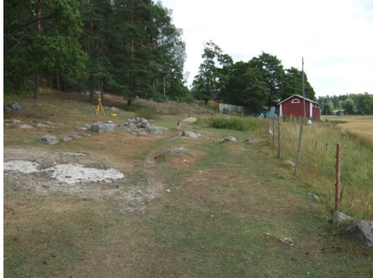
Kirkkonummi Vitträsk (vasemmalla). Suomen ensimmäinen tunnettu kalliomaalaus, jonka löysi säveltäjä Jean Sibelius vuonna 1911. Punaisella maalilla tehdyssä maalauksessa on geometrisiä kuvioita. Helena Ranta 2008, AKDG2033:1, Museovirasto. Porvoon Henttala (oikealla). Laaja mesoliittisellä ja neoliittisellä kivikaudella asutettu asuinpaikka sijaitsee jokilaaksossa etelään antavalla hiekkapohjaisella rinteellä. Simo Vanhatalo 2010, AKDG1917:17, Museovirasto.