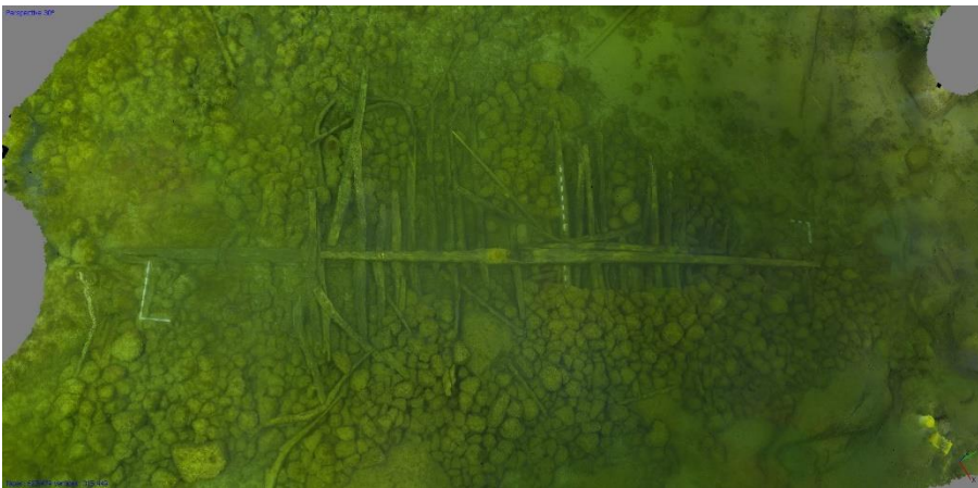
Raseborg Jussarö 1 Vraket efter ett svenskt krigsskepp som kan dateras till 1500-talet. Vrakets spant och plankor har kollapsat och ligger utspridda på havsbotten. Päivi Pihlanjärvi och Niko Anttiroiko, AKMA201701:19, Museiverket.

Största delen av de kända fartygsvraken finns vid kusten i Södra Finland. Antalet fartygsvrak som angetts vara av betydande intresse i Nyland är totalt 25. Bland dem finns krigs-, handels- och kustfartyg, av vilka de flesta kan dateras till 1700-talet. De äldsta vraken är från 1500- (Kyrkslätt Träskö Tunnavraket, Raseborg Esseholm och Russarö 1) och 1600-talet (Hangö Kabelvraket och Mulan). De yngsta vraken kan dateras till 1800- och 1900-talet. Bland dem finns också ett ångfartyg i järn (Kyrkslätt Sandviken) och en hjulångare från Krimkrigets tid (Sibbo Diana).