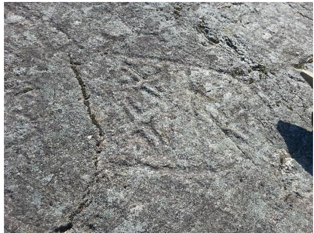
Raseborg Prästholmen. Årtalet 1488 som ristats in i berget under medeltiden och åtta vapenristningar. Hällristningarna hänför sig till de fredsförhandlingar som fördes på platsen mellan Sveriges och Tyska orden. Objektet ligger vid mynningen av Raseborgs å. Teija Tiitinen 2019, AKDG5813:1 ja AKDG5813:6, Museiverket.

I hela Nyland känner man till få fynd från den yngre järnåldern. De yngsta fynden från järnåldersobjekten i Karisregionen kan ofta dateras till vikingatiden, men längre österut saknas det så gott som helt yngre fynd från järnåldern. Det finns endast ett fåtal boplatser där man känner till kontinuerlig bosättning från järnåldern till medeltiden (Hangö Gunnarängen, Vanda Västersundom Gubbacka). Även om det finns få uppgifter om objekten från slutet av järnåldern, finns det gott om objekt från medeltiden. Största delen av dem är välbevarade övergivna byar som uppstod i början av medeltiden till följd av den svenska kolonisering som riktades till området. I sin helhet är de objekt som kan dateras till medeltiden i Nyland mångsidiga och imponerande.