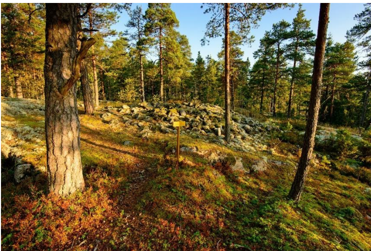
Sjundeå Krejansberget 2. Gravröse från bronsåldern, uppe på ett högt berg. Vesa Laulumaa 2014, AKDG3997:2, Museiverket.

Bronsåldern är välrepresenterad med flera stora gravrösen som tidstypiskt för perioden är belägna på krönet av höga hällar. Sådana gravrösen finns i hela Nylands kustområde. I början av järnåldern genomgår Nyland en särutveckling och det uppstår två olika områden. I den västra delen finns det gott om objekt som kan dateras till den förromerska och romerska järnåldern (500 f.v.t. –400 e.v.t.) och till den mellersta järnåldern (folkvandringstiden och merovingertiden, 400–600 e.v.t.). Objekten omfattar gravar (tarandgravfält, rösen, brandgravfält) och boplatser. Objekten i Lappträsket i Karis utgör en exceptionellt representativ helhet och dessutom är många av de enskilda objekten i Karis betydande (till exempel Kroggårdsmalmen och Hönsåkerskullen). Största delen av objekten från järnåldern är gravrösen. Jämfört med den västra delen av Nyland finns det i östra Nyland få objekt som kan dateras till den äldre och mellersta järnåldern. Ett av de kändaste av dem är Lilla Borgbackens gravfält i Borgå med skelett- och brandgravar från romerska tiden.