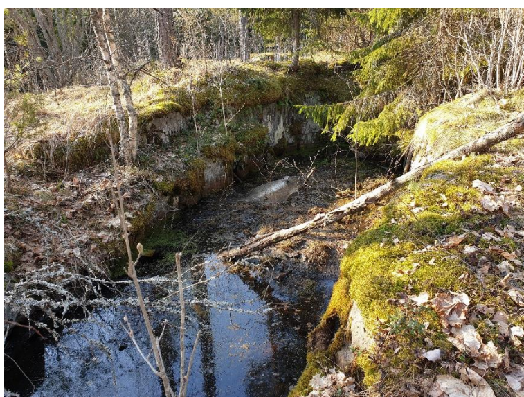
Lojo Mårbacka. Gruvschaktet i järngruvan från 1600-talet har fyllts med vatten. Teija Tiitinen 2019, AKDG6893:2, Museiverket.