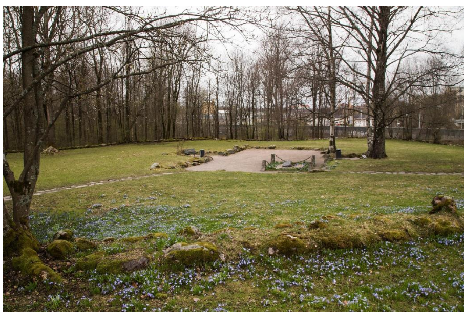
Helsingfors Gammelstaden (fi Vanhakaupunki). Platsen där Helsingfors äldsta kyrka fanns på 1500-talet. Stenarna från fundamentet kan numera ses mitt i parkens gräsområde. Helena Ranta 2021, AKDG6848:4, Museiverket.