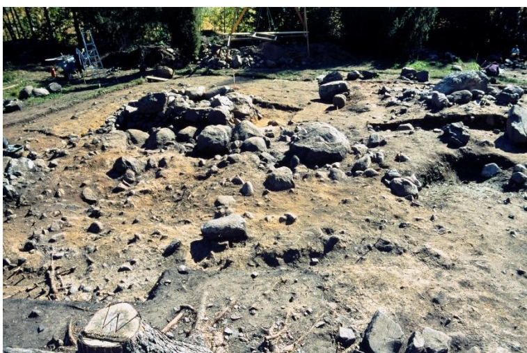
Vanda Västersundom Gubbacka. Den framgrävda stenkonstruktionen efter en ugn i ett medeltida hus. Veli-Pekka Suhonen 2003, RHO125357:206, Museiverket.