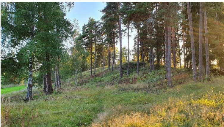
Borgå Lilla Borgbacken. Ett gravfält som ligger på en smal rullstensås och som kan dateras till romartiden under den tidiga järnåldern. Sari Mäntylä-Asplund 2019, AKDG6778:3, Museiverket.