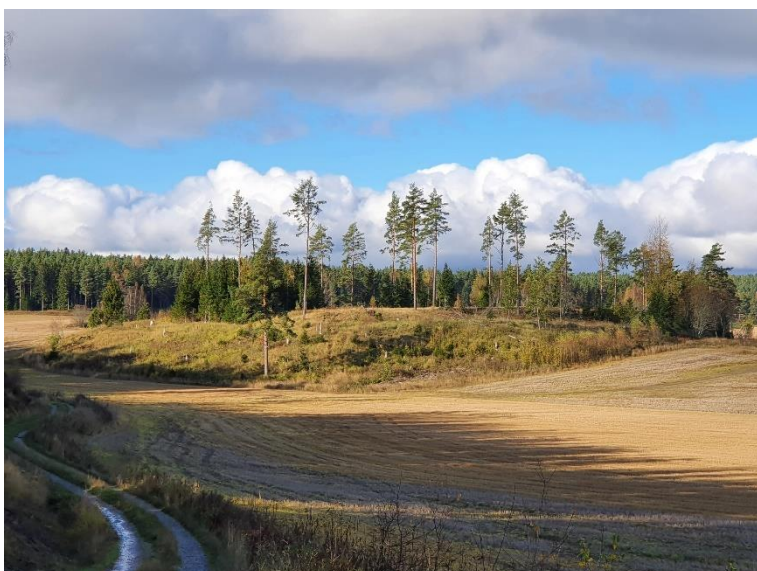
Raseborg Kullåkerbacken. Den medeltida byplatsen finns i en skogsdunge mitt på åkrarna. Byn avfolkades sannolikt till följd av digerdöden i mitten av 1300-talet. Sari Mäntylä-Asplund 2020, AKDG6783:1, Museiverket.