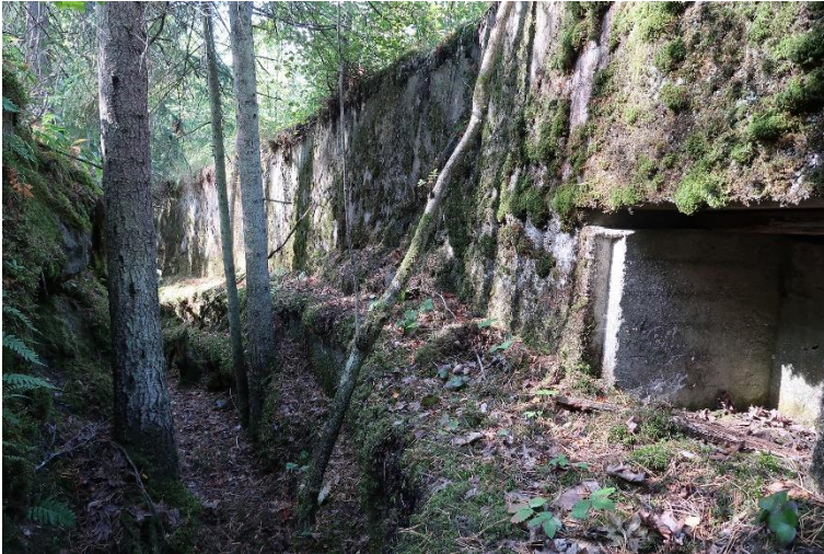
Helsingfors Tukikohta I:19 (Svarta backen). En skyttegrav som brutits i berget från den befästning från första världskriget som är en del av land- och sjöfästningarna i Helsingfors. Markku Heikkinen 2019, G54378, Helsingfors stadsmuseum.