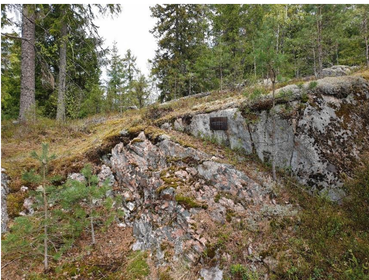
Askola Kopinkallio. Kvartsbrottet från den mesolitiska stenåldern finns i ett litet bergsområde i barrträdsdominerad skog. Teija Tiitinen 2019, AKDG5832:2, Museiverket.