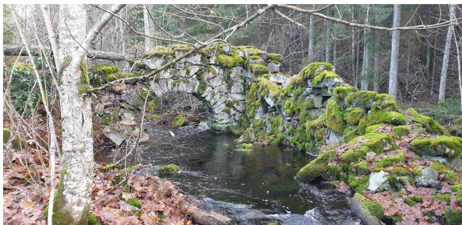
Raseborg Kullan mylly. Ruinen efter en vattenkvarn murad i gråsten från 1800-talet. Teija Tiitinen 2019, AKDG6931:1, Museiverket.