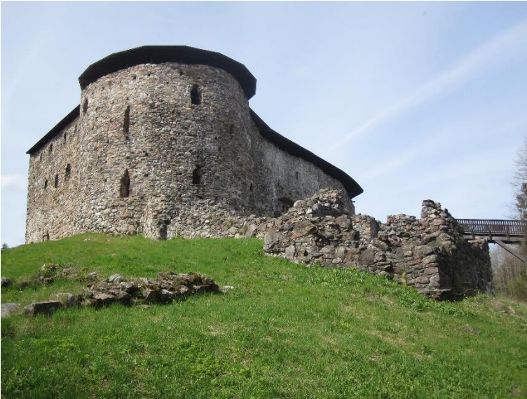
Raseborg Raseborgs slott. En medeltida stenborg som ursprungligen var byggt på en liten klippö och användes från 1300-talet till 1500-talet.

Över hälften av de objekt i Nyland som bedöms vara av arkeologiskt intresse kan dateras till historisk tid senare än medeltiden. Största delen av objekten från historisk tid är förknippade med det omfattande befästningsskedet på 1700-talet (Sveaborg, fästningarna i Lovisa och Hangö), upprustningen under Krimkriget (1850-talet) och land- och sjöfästningarna i Helsingfors under första världskriget som var en del av det försvarssystem som planerats för att skydda S:t Petersburg (byggdes 1914–1918). Till den militära verksamheten hänförs också objekten som är förknippade med freden i Åbo (1743) och militärlägren i Kungshamn i Lovisa på 1700-talet.