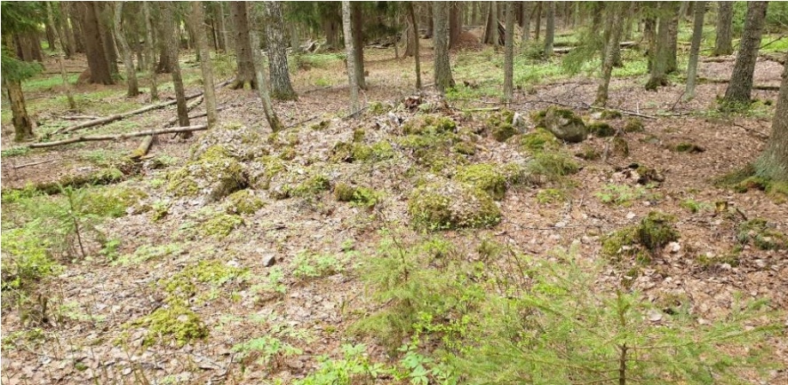
Borgå Hotton Storkärrbacken. Det jordblandade röset från järnåldern ligger på en skogklädd backsluttning. Teija Tiitinen 2019, AKDG5844:3, Museiverket.