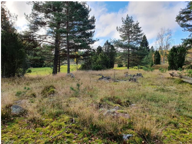
Ingå Norrby. En medeltida byplats som avfolkats före slutet av 1600-talet. På bilden stenkonstruktioner i gräset på en bergsbacke i närheten av odlingsmark. Sari Mäntylä-Asplund 2020, AKDG6782:1, Museiverket.