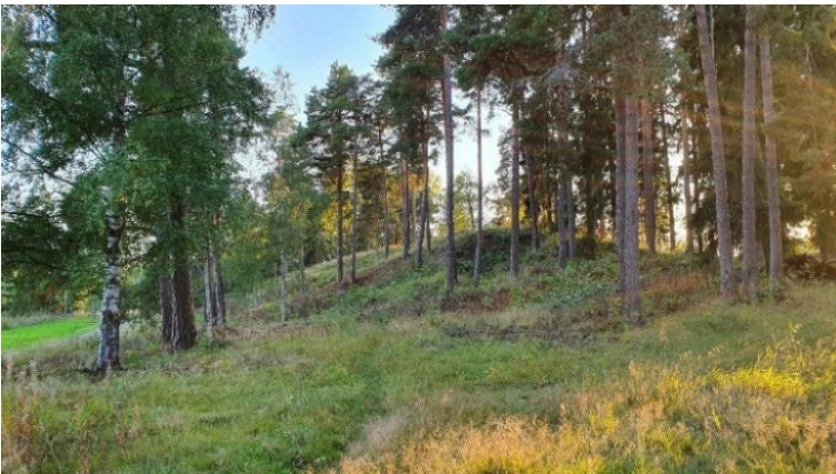
Porvoo Pikku Linnamäki. Kapealla sora-harjulla sijaitseva varhaisrautakaudelle roomalaisaikaan ajoittuva tarhakalmisto. Sari Mäntylä-Asplund 2019, AKDG6778:3, Museovirasto.