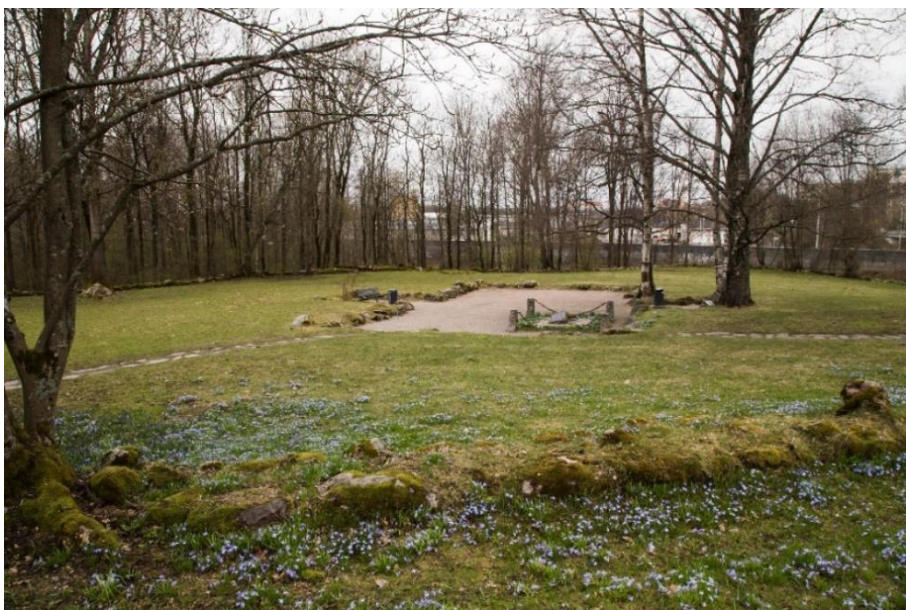
Helsinki Vanhakaupunki. Helsingin vanhimman kirkon paikka 1500-luvulta. Perustusten kivet ovat nykyisin esillä puiston nurmialueen keskellä. Helena Ranta 2021, AKDG6848:4, Museovirasto.