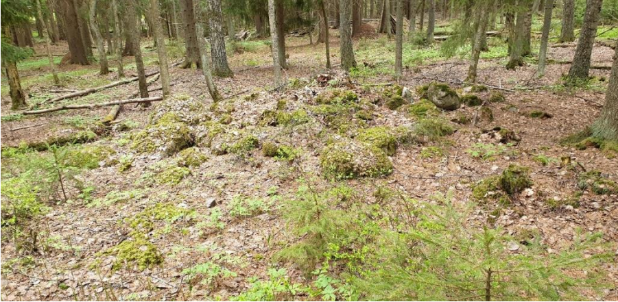
Porvoo Hotton Storkärrbacken. Rautakaudelle ajoittuva maansekainen röykkiö sijaitsee metsäisen mäen rinteellä.