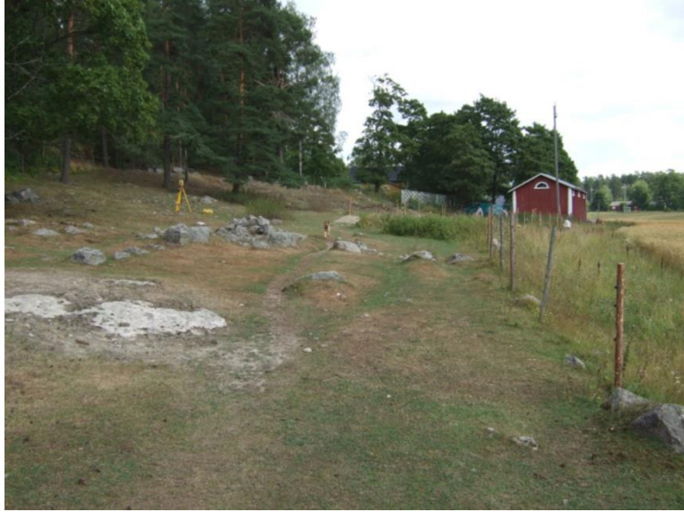
Kirkkonummi Vitträsk (vasemmalla). Suomen ensimmäinen tunnettu kalliomaalaus, jonka löysi säveltäjä Jean Sibelius vuonna 1911. Punaisella maalilla tehdyssä maalauksessa on geometrisiä kuvioita. Porvoon Henttala (oikealla). Laaja mesoliittisellä ja neoliittisellä kivikaudella asutettu asuinpaikka sijaitsee jokilaaksossa etelään antavalla hiekkapohjaisella rinteellä.