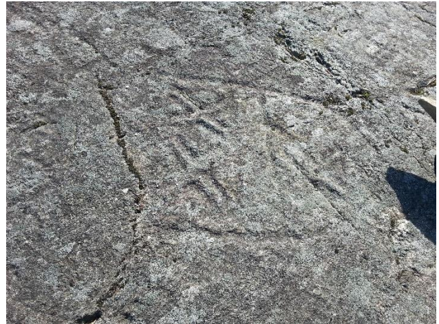
Raasepori Prästholmen. Keskiajalla vuonna 1488 kallioon hakattu vuosiluku ja kahdeksan vaakunaa. Hakkaukset liittyvät Ruotsin ja Saksalaisen ritarikunnan paikalla käymiin rauhanneuvotteluihin. Kohde sijaitsee Raaseporinjoen suulla. 2019, AKDG5813:1 ja AKDG5813:6.

Nuoremman rautakauden löytöjä tunnetaan niukasti koko Uudenmaan alueelta. Karjaan seudun rautakauden kohteissa nuorimmat löydöt ajoittuvat usein viikinkiaikaan, mutta idempänä nämä nuoremmat löydöt puuttuvat lähes kokonaan. Asutusjatkumo rautakaudelta keskiaikaan tunnetaan vain muutamalta asuinpaikalta (Hanko Gunnarängen ja Vantaa Västersundom (Länsisalmi) Gubbacka). Vaikka tiedot rautakauden lopun kohteista ovat niukkoja, keskiajan kohteita on runsaasti. Näistä suurin osa on hyvin säilyneitä autioituneita kylänpaikkoja, jotka syntyivät keskiajan alussa alueelle suuntautuneen ruotsalaisen uudisasutuksen seurauksena.