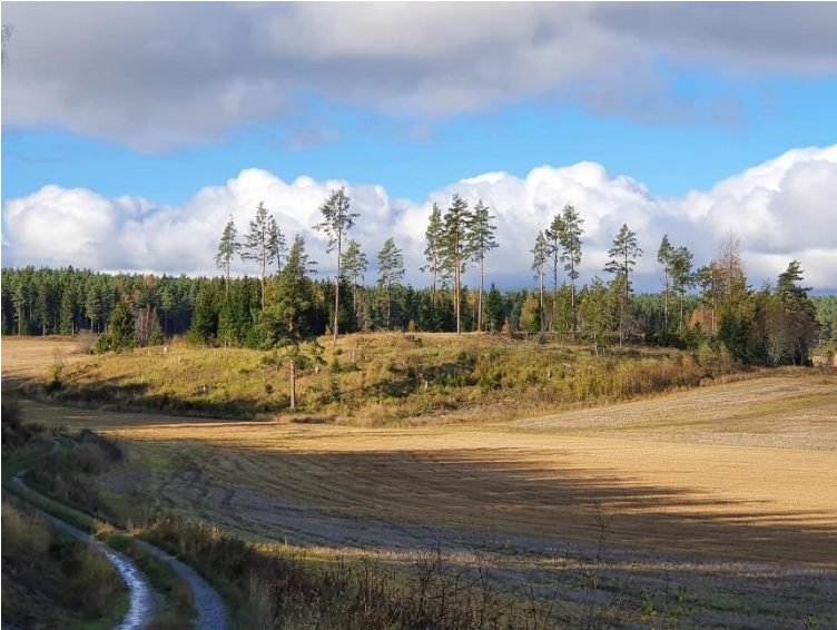
Raasepori Kullåkerbacken. Keskiaikainen kylänpaikka sijaitsee peltojen keskellä metsäsaarekkeessa. Kylä autioitui todennäköisesti mustan surman seurauksena 1300-luvun puolivälissä.