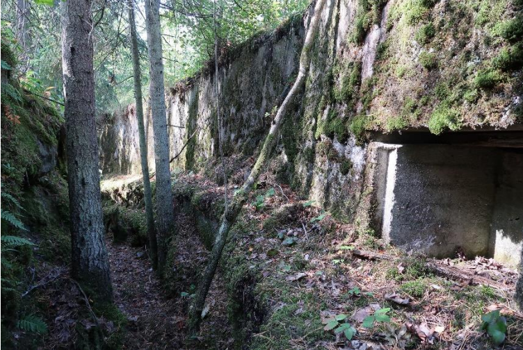
Helsinki Tukikohta I:19 (Mustavuori). Kallioon louhittua taisteluhautaa ensimmäisen maailmansodan aikaisessa linnoitteessa, joka on osa Helsingin maa- ja merilinnoitusta. Markku Heikkinen 2019, G54378, Helsingin kaupunginmuseo.