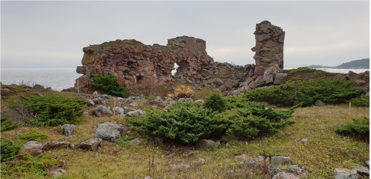
Hanko Gustavsvärn. Saareen rakennettu kivinen linnoitus, jonka rakentamisen aloittivat ruotsalaiset 1790-luvulla. Venäläiset veivät linnoitustyöt päätökseen 1800-luvun alkupuolella, mutta se räjäytettiin tarpeettomana jo vuonna 1854. Kuvassa raunioituneena säilynyttä linnoituksen muuria. Teija Tiitinen 2020, AKDG6565:3, Museovirasto.