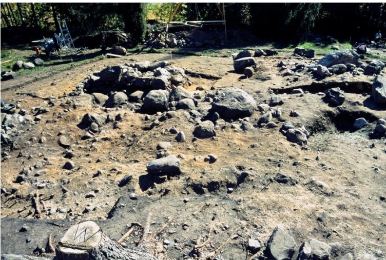
Vantaa Västersundom (Länsisalmi) Gubbacka. Keskiaikaisen talon luonnonkivistä tehty uunin kivirakenne kaivettuna esiin. Veli-Pekka Suhonen 2003, RHO125357:206, Museovirasto.