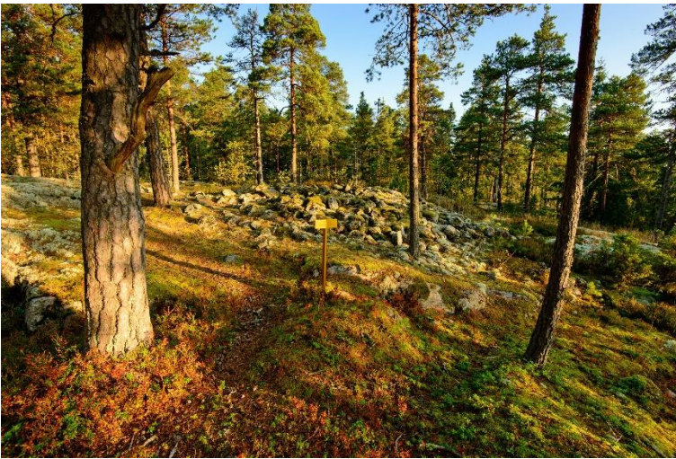
Siuntio Krejansberget 2. Pronssikautinen hautaröykkiö, joka sijaitsee korkean kallion päällä. Vesa Laulumaa 2014, AKDG3997:2, Museovirasto.

Pronssikausi on edustettuna VARK-kohteissa useilla aikakaudelle tyypillisillä kookkailla hautaröykkiöillä, joita löytyy korkeiden kallioiden päältä koko Uudenmaan rannikolta. Rautakauden alussa Uusimaa eriytyy kahteen erilaiseen alueeseen. Länsiosassa on runsaasti esiroomalaiselle ja roomalaiselle rautakaudelle (500 eaa. – 400 jaa.) sekä keskirautakaudelle (kansainvaellus- ja merovingiaika, 400–600 jaa.) ajoittuvia asuinpaikkoja ja hautauksia kuten tarhakalmistoja, röykkiöitä, polttokenttäkalmistoja. Karjaalla on useita yksittäisiä merkittäviä rautakauden kohteita (esimerkiksi Kroggårdsmalmen ja Hönsåkerskullen) ja Karjaan Lepinjärven kohteista muodostuu poikkeuksellisen hieno kokonaisuus. Uudenmaan länsiosaan verrattuna keskisen ja itäisen Uudenmaan varhais- ja keskirautakauden kohdemäärä on pieni. Itäisen Uudenmaan tunnetuin tämän aikakauden kohde on Porvoo Pikku Linnamäen roomalaisaikainen ruumis- ja polttohautauksia sisältänyt kalmisto.