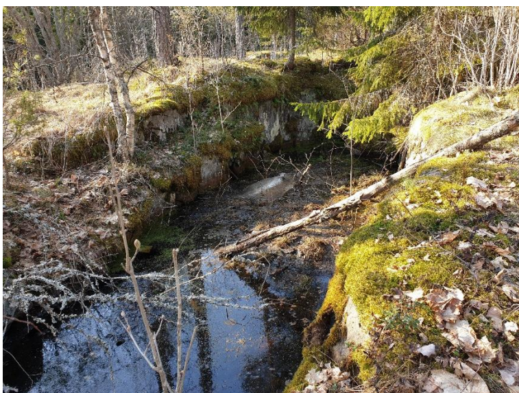
Lohja Märbacka. 1600-luvun rautakivoksen kaivoskuilu on täyttynyt vedellä. Teija Tiitinen 2019, AKDG6893:2, Museovirasto.