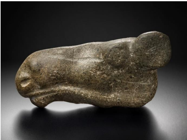
Huittinen Palojoki. Mesoliittisen kivikauden asuinpaikka, jonka merkittävin löytö on Huittisten hirvenpäänä tunnettu vuolukiviestä tehty veistos. Sen pituus on 14,5 senttimetriä. Asuinpaikka ajoittuu noin 6200–5700 eaa. Esine KM6292:1.

Satakunnan pronssikauden kohteita on tutkittu paljon. VARK-kohteisiin kuuluvat Nakkilan Rieskaronmäen hauta- ja asuinpaikka-alue, josta on tutkittu hautausten lisäksi pronssikautisen talon jäännökset, ja Nakkilan Selkäkankaan kookas (11 x 43 m) pitkä rökkiö, joka ajoittuu pronssikauden alkuun (1500–1200 eaa.). Selkäkankaan rökkiön ihmisluiden joukosta on löydetty aikaan hautaan asetetun nautan hampaat. Isotooppitutkimuksen perusteella nauta on syntynyt Ruotsissa ja tuotu Nakkilaan vasikkana. Satakunnan pronssikauden kohteisiin kuuluu myös Euran Panelian niin kutsuttu Kuninkaanhauta , joka on Suomen suurin (30 x 36 m, korkeus 4 m) ja yhä tutkimaton hautarökkiö.