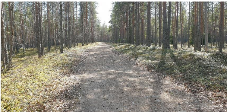
Karvia Kyrönkankaantie. 1500-luvun historiallisista lähteistä tunnettu tie kulkee harjua pitkin. Kuvassa tien parhaiten säilynyttä ja liikenteeltä suljettua osuutta kansallispuistosta. Teija Tiitinen 2021, AKDG6816:1, Museovirasto.