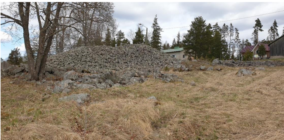
Eura Kuninkaanhauta. Suomen suurin pronssikautinen hautarökkiö sijaitsee peltoalueen reunalla asutussa maaseutuympäristössä. Rökkiön halkaisija on yli 30 metriä ja korkeutta sillä on kolmesta neljään metriä. Teija Tiitinen 2021, AKDG7242:3, Museovirasto.