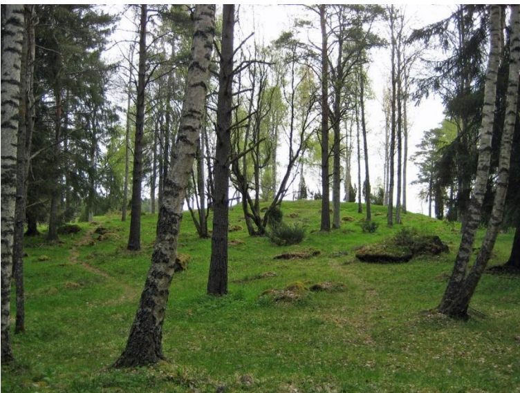
Eurajoki Linnan linna. Keskiajalla 1300- ja 1400-lukun taitteen molemmin puolin toimineen puulinnan raunio. Alun perin saareen rakennettu linna sijaitsee nykyisin peltojen viereisellä pienellä metsäisellä mäellä. Paikalla on suorakaiteen muotoinen vallihauta ja sitä reunustavat maavallit. Leena Koivisto 2009, AKDG759:1, Museovirasto.

Historiallisella ajalla kohteiden määrä kasvaa myös Satakunnassa. Valtakunnallisesti merkittäviksi niistä on arvioitu 21, joka on neljännes kaikista Satakunnan VARK-kohteista. Mukana on työ- ja valmistuspaikkoja (Porin Myllykosken myllynpaikat), kulkuväyliä kuten Kokemäen Kravin kanavauoma 1800-luvun alusta ja Karvian Kyrönkankaantie, joka on 1600-luvulla perustettu ratsutie ja sittemmin