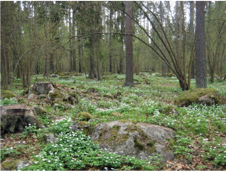
Eura Harola. Laajalla röykkiöalueella on lähes 700 röykkiötä. Osa röykkiöistä ajoittuu rakenteiden perusteella nuoremman roomalaisajalle ja kansainvaellusajalle. Osa muistuttaa taas enemmän raivausröykkiöitä. Kuvassa metsässä sijaitsevaa röykkiöaluetta keväällä ennen lehden puhkeamista puihin.

Satakunnan monipuolinen ja runsas rautakautinen asutus on painottunut maakunnan keski- ja eteläosiin eli historialliseen Ala-Satakunnan kihlakuntaan. Pohjoisempana asutus on ollut vähäisempää. Erityisesti Kokemäenjoen varsi ja Pyhäjärven ympäristö on ollut ja on yhä rautakauden tutkimukselle merkittävä alue. Sieltä tunnetaan muun muassa ensimmäiset merkit yhteyksistä Itämeren länsi- ja eteläpuoleisiin kristittyihin alueisiin, ja ruumishautaus on tullut alueella yleisesti käyttöön jo rautakauden puolivälissä noin vuoden 500 jaa. vaiheilla.