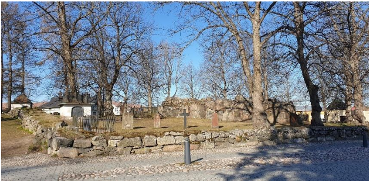
Rauma Rauman entinen kaupungin-kirkko. 1400-luvulta 1600-luvulle käytössä ollut kirkko ja hautausmaa. Kohde sijaitsee kaupunkialueella hoidettuna puistona. Teija Tiitinen 2021, AKDG6821:1, Museovirasto.