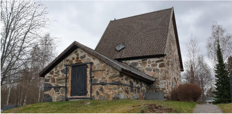
Kokemäki Pyhän Marian kirkon paikka. Vanha keskiaikaisen puukirkon paikalle on rakennettu kuvassa oleva kivisakasti 1550-luvulla. Paikan vanhimman kirkon oletetaan ajoittuvan viimeisintään 1200-luvun puoliväliin, tai jopa 1000-luvulle. Kohde sijaitsee yhä käytössä olevalla hautausmaalla. Teija Tiitinen 2021, AKDG6792:2. Museovirasto.

Rauman merialueen hylkykohteet – vuonna 1897 uponnut rahtialuksena toiminut purjealus Siiwo ja ensimmäisen maailmansodan aikana saksalaisen sukellusveneen upottama puinen kauppa-alus Ingersoll – ovat Satakunnan nuorimpia VARK-kohteita.