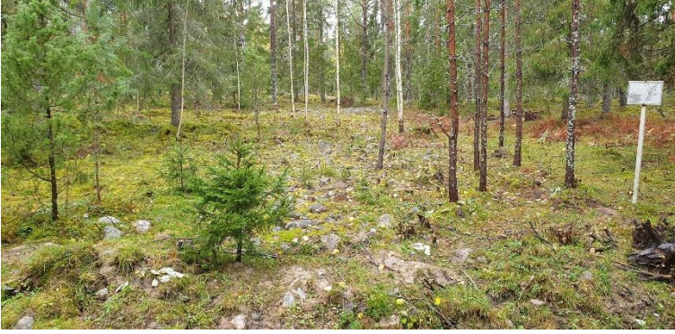
Rauma Salisuonmäki. Varhaisrautakaudelle, vanhempaan roomalaisaikaan ajoittuvassa kalmistossa on tarhakalmisto ja matalia hautaröykkiöitä. Kuvassa metsässä sijaitsevaa kalmistoaluetta. Teija Tiitinen 2020, AKDG6550:2, Museovirasto.