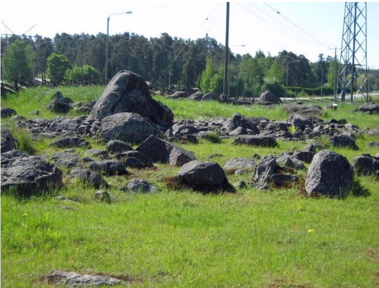
Eura Luistari. Laaja ja monipuolinen kalmistoalue on tunnettu varsinkin laajasta 500–1100 jaa. ajoittuvasta ruumiskalmistosta. Kohteessa on kuitenkin myös röykkiöhautoja. Leena Koivisto 2011, AKDG2241:3, Museovirasto.

Eurassa sijaitseva Luistarin ruumiskalmisto on yksi Suomen kansainvälisesti tunnetuimmista muinaisjäännöksistä. Laajasta kalmistosta on löydetty yli 1300 hautaa, jotka ajoittuvat 500–1100 jaa. Osassa haudoista on poikkeuksellisen rikkaita hauta-antimia, jotka osoittavat vilkkaita kontakteja eri puolille Itämeren ja sitä etäämmällekin. On arveltu, että osa Luistariin haudatuista vainajista olisi saattanut osallistua viikinkien idänretkille.