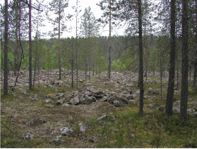
Inari Sotajoen suupankki. Ivalojoen ja Sotajoen yhtymäkohdassa sijaitseva 1800-luvun lopun kullanhuuhtomo. Kuvassa on turpeesta puhdistettu kivikko, jossa on erilaisia kullankaivuun aiheuttamia kaivantoja ja kasoja.