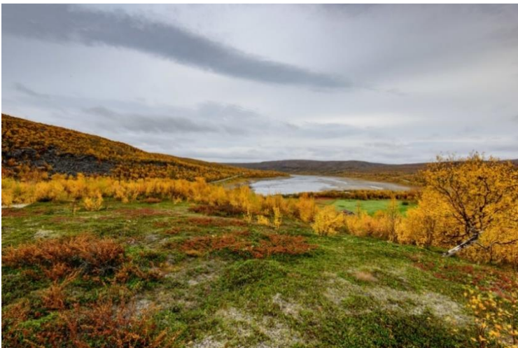
Utsjoki Ala-Jalve. Tenojoen varrella hiekkatörmällä sijaitseva asuinpaikka on ollut asuttuna neoliittisella kivilaudella, pronssikaudella ja varhaismetallikaudella. Asuinpaikan vieressä on tunnettu lohenpyyntipaikka.

Neoliittisen ajan lopulla noin 3000–2000 eaa. alueella harjoitettiin laajamittaista peuranpyyntiä. Tästä ovat todisteena lukuisat pyyntikuopat, joista suurin osa ajoittuu tutkimustulosten perusteella joko kivilauden loppuvaiheeseen tai sitä seuranneelle varhaismetallikaudelle noin 1000 eaa. Pyyntikuoppia on kuitenkin käytetty myös historialliselle ajalle saakka. Lemmenjoen varressa sijaitseva Lemmenjoen pyyntikuoppaketjut -niminen VARK-alue sisältää noin kolmekymmentä pyyntikuoppakohdetta, joissa on yli 600 pyyntikuoppaa. Koska peuran pyyntiin käytetyt kuopat ovat nimenomaan saamelaisalueelle tyypillisiä arkeologisia kohteita, noin puolet alueen VARK-kohteista sisältää pyyntikuoppia.