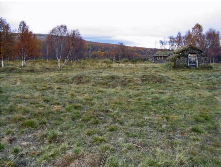
Utsjoki Välimaa. Tenon rantaterassilla sijaitseva jokisaamelaisten kenttä on historiallisen ajan asuinpaikka. Kuvassa keskellä yksi kodanpohjista. Taustalla on museotilan rakennuksia. Teija Tiitinen 2003, AKDG6858:1, Museovirasto.