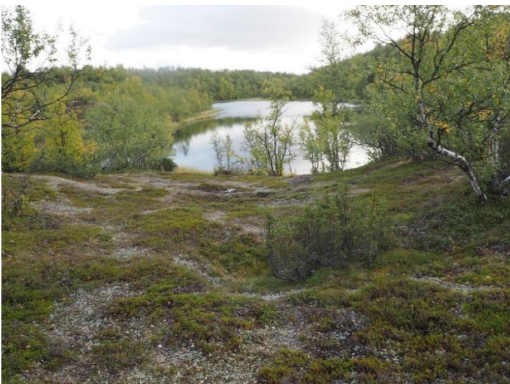
Enontekiö Pöyrisjärven polkutie. Pyyntikuoppakohde kuuluu Jierstirovan pyyntikuoppajärjestelmät -nimiseen VARK-alueeseen, jonka pyyntikuopat ajoittuvat neoliittisen kivilauden lopulle ja varhaismetallikaudelle. Petri Halinen 2021, AKDG6959:2, Museovirasto.