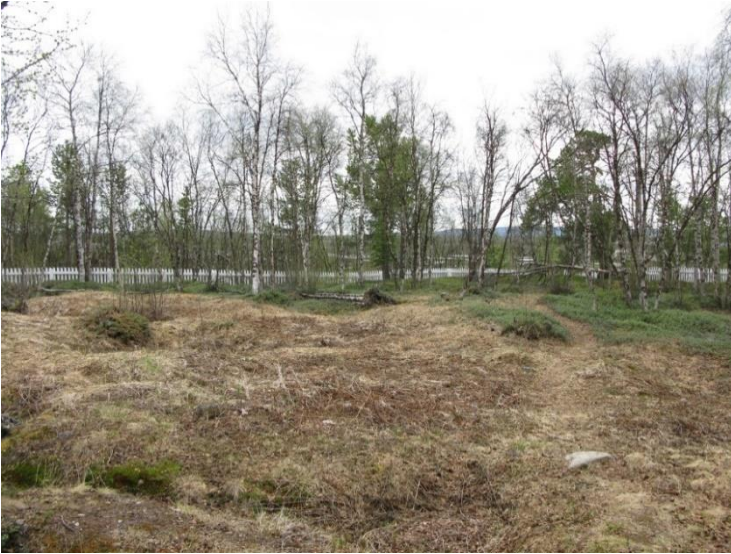
Enontekiö Markkina. Kohde on ollut Länsi-Lapin merkittävä kirkollinen ja hallinnollinen keskus ja markkinapaikka 1600-luvulta 1800-luvulle. Kuvassa on Markkinan kirkon ja hautausmaan paikka Sirikka-Liisa Seppälä 2008, AKDG432:7, Museovirasto.

Ruijanpolku, josta on ensimmäiset merkinnät jo 1500-luvun lopulta. Nykyään reittiä voi kulkea esimerkiksi Sompion luonnonpuistossa (Ruijanpolun VARK-alue).