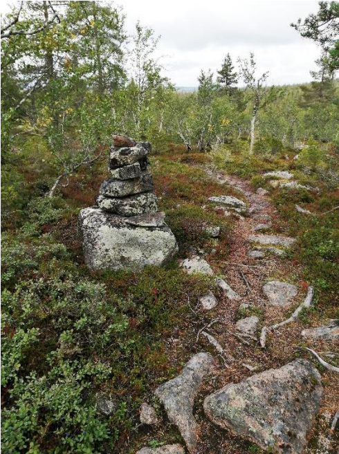
Sodankylä Ruijanpolku. Perämeren rannalta Jäämerelle eli Ruijan rannalle kulkenut polku mainitaan ensimmäisen kerran historiallisissa lähteissä 1500-luvun lopulla. VARK-alueeksi on valittu Sompion luonnonpuistossa kulkeva osuus, jossa polku on merkitty maastoon merkipuin ja -kivin. Kuvassa polkua ja merkkikivi. Juha-Pekka Joona 2021, SAAMVARK1:30, Saamelaismuseo Siida.