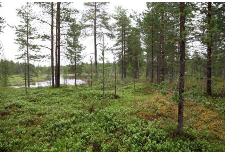
Inari Nukkumajoki 4. Joen varrella metsässä sijaitseva historiallinen inarinsaamelaisten talvikylän paikka, jossa erottuu kymmenkunta kodanpohjaa. Kuvassa yksi kodanpohjista. Petri Halinen 2022, AKDG7187:6, Museovirasto.