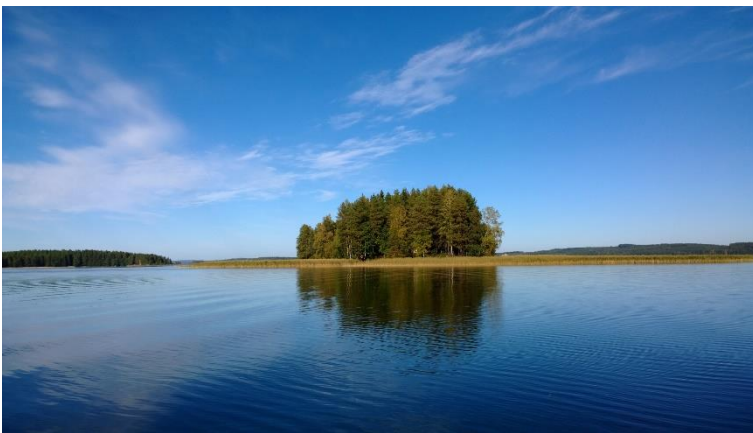
Kuopio Luukonsaari. Kallaveden saarella sijaitseva varhaismetallikautinen asuinpaikka, jonka löytöaineistojen pohjalta on tunnistettu ja nimetty yksi aikakauden keramiikkatyypeistä. Tanja Tenhunen 2014, KHMKUVV6166:7, Kuopion kulttuurihistoriallinen museo.