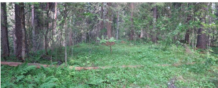
Iisalmi Jysmä. Neoliittiselle kivikaudelle ja pronssikaudelle ajoittuva asuinpaikka. Kuvassa jyrkkärinteisen moreenimäen laella sijaitsevaa asuinpaikan osaa. Teemu Mökkönen 2019, AKDG5777:2, Museovirasto.