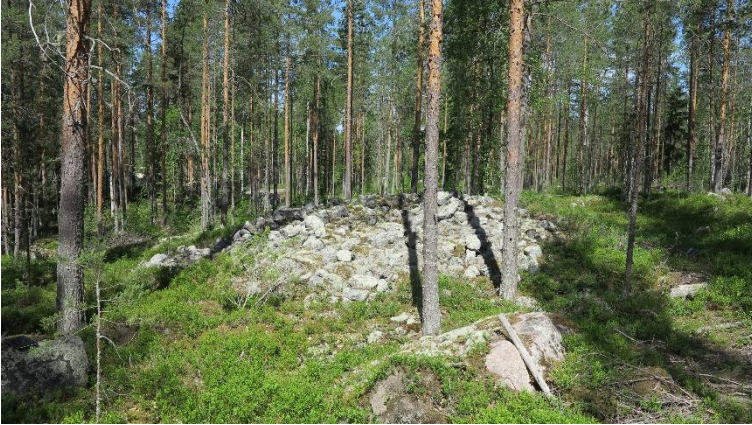
Kuopio Metelinkallio. Laaja useita varhaismetallikautisia lapinraunioita sisältävä kohde. Kuvassa yksi kohteen neljästätoista lapinraunioista.

Keskiaikaa nuorempia historiallisen ajan kohteita on mukana suhteellisesti paljon. Vanhimpia näistä ovat Täyssinän rauhan (1595) rajakivet Tuusniemen Ohtaansalmi ja Rautavaaran Tiilikan Rajakivi sekä Kuopion Piispanpuiston 1500-luvulta 1700-luvulle käytössä ollut kirkon ja hautausmaan paikka. Nuoremmat kohteet ovat tyypeiltään vaihtelevia. Mukana on edustava 1700-luvun sotilastorpan paikka (Keitele Hamulanniemi soldats torp) ja sotahistoriallisia kohteita (Koljonvirran vuoden 1808 taistelupaikan kohteet, I maailmansodan kenttälinoitteet Siilinjärvi Toivala Hanhimäki ja Tervo Vallikangas).