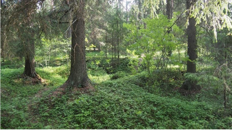
Iisalmi Koljonvirran korsualue. Vuoden 1808 Koljonvirran taisteluun osallistuneiden venäläissotilaiden korsujen pohjat näkyvät maastossa noin metrin syvyisinä kaivantoina. Teemu Mökkönen 2019, AKDG5778:1, Museovirasto.