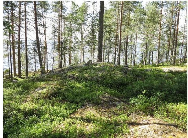
Aluskasvillisuuden peittämiä varhaismetallikautisia lapinraunioita. Kuopio Kuusikkolahdenniemi (vasemmalla) ja Pielavesi Kemilä (oikealla).