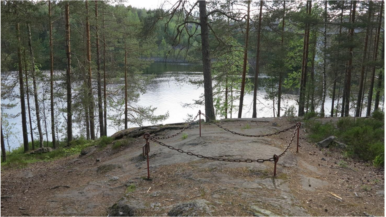
Tuusniemi Ohtaansalmi. Ruotsin ja Venäjän välisen Täyssinän rauhan (1595) kallioon hakattu rajamerkki. Teemu Mökkönen 2019, AKDG5799:1, Museovirasto.