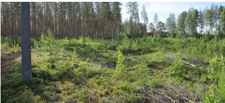
Tuusniemi Honkakangas. Suurikokoinen asumuspainanne neoliittisen kivikauden asuinpaikalla. Teemu Mökkönen 2019, AKDG5798:1, Museovirasto.