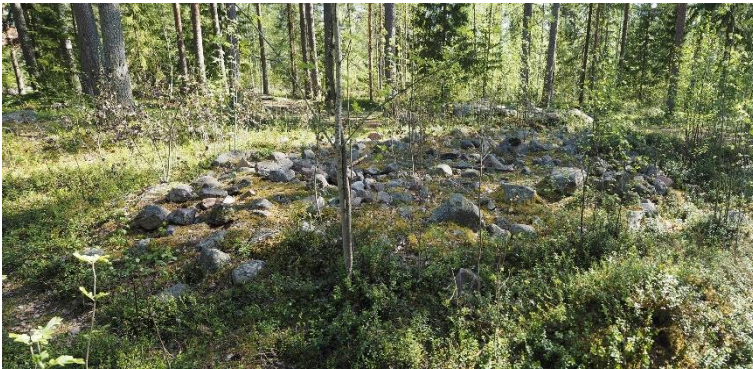
Oulu Välikangas. Merkittävä varhais- ja keskirautakauden kalmisto, jonka röykkiöhautoihin on haudattu roomalais- ja kansainvaellusajalla noin 150–500 jaa. Kuvassa yksi kalmiston matalista hautaröykkiöistä. Kohde sijaitsee asemakaavoitetulla alueella metsäsaarekkeessa. Teemu Mökkönen 2020, AKDG6398:2, Museovirasto.

Sisämaasta selkeästi keskiaikaisia kohteita ei tunneta. Lähelle tätä kuitenkin ajoittuu Vaalan Manamansalon 1500-luvun Vanha hautausmaa. Sisämaasta on mukana myös muita käytöstä poistuneita historiallisen ajan hautakohteita: 1700- ja 1800-luvuilla käytetty Utajärven Juorkuna Kiviniemi ja Kuusamon Iso-Pöyliö, josta on tutkittu 1600-luvulle ajoittuva saamelaisen noidan hauta.