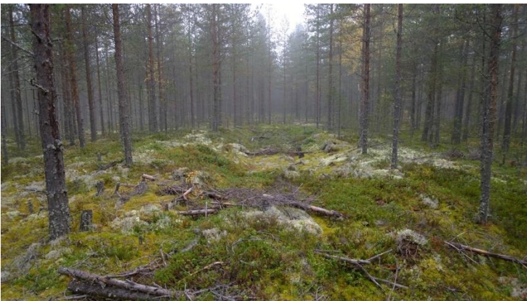
Liminka Niilonräme 3. Neoliittisen kivikauden asuinpaikka, jolla on useita asumuspainanteita. Kuvassa pitkä ja kapea neoliittisen kivikauden asumuspainanne kangasmetsässä. Painanne on kuvattuna pituusakselin suuntaisesti. Painanteen leveys noin neljä metriä. Petro Pesonen 2017, AKDG5322:59, Museovirasto.