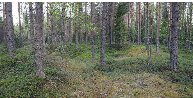
Muhos Pyhäkoski 1. Neoliittisen kivikauden asuinpaikka, joka ajoittuu tyypillisen kampakeramiikan aikaan. Kuvassa on pohjaltaan pyöreä asumuspainanne, joka on asuinpaikan asumuspainanteista kookkain. Sen halkaisija on noin 11 metriä. Teemu Mökkönen 2020, AKDG6386:1, Museovirasto.