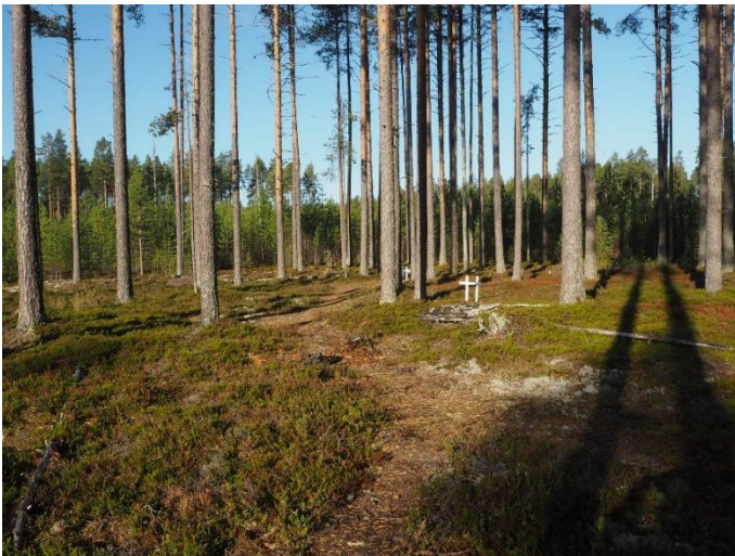
Vaala Manamansalon Vanha hautausmaa. 1500-luvun kirkon läheisyydessä sijainnut ruumiskalmisto on todennäköisesti ollut käytössä jo ennen kirkkoa ja myöhemmin 1570-luvulla tapahtuneen kirkon tuhoutumisen jälkeen. Kohdetta on tutkittu arkeologisin kaivauksin.

Nuorimpina kohteina mukana ovat Suomen sotaan (1808) liittyvä puolustusvarustus Siikajoki Vartti ja hollantilaisen kauppalaivan hylky Oulu Sofia Maria (uponnut 1859).