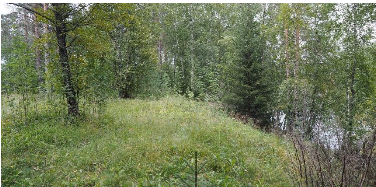
li Illinsaari Suutarinniemi. Hautapaikka, jossa on rautakauden lopun polttohautoja ja keskiajan alun kristillisiä ruumishautoja. Kohde sijaitsee lijoen saareissa lähellä jokisuuta.