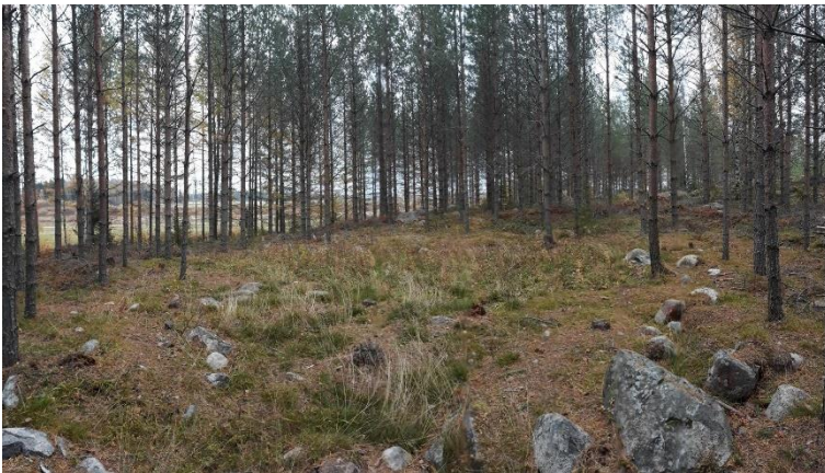
Sievi Kiurunkangas. Keski- ja myöhäisrautakautinen asuinpaikka, joka sijaitsee kuivatun järven metsäsaarekkeessa. Jouni Taivainen 2021, AKDG6966:1, Museovirasto.