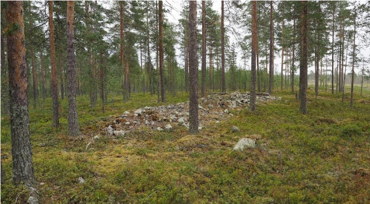
Li Makkarakangas. Pronssikautinen pitkä-röykkiö sijaitsee nykyisin mäntymetsässä matalalla moreeniharjanteella. Teemu Mökkönen 2020, AKDG6471:1, Museovirasto.