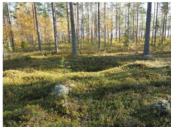
Esihistoriallisia pyyntikuoppia. Pyyntikuopat erottuvat maastossa laakeina painaumina. Taivalkoski Kattaisenvaara (vasemmalla) ja Vaala Martinkanta (oikealla).