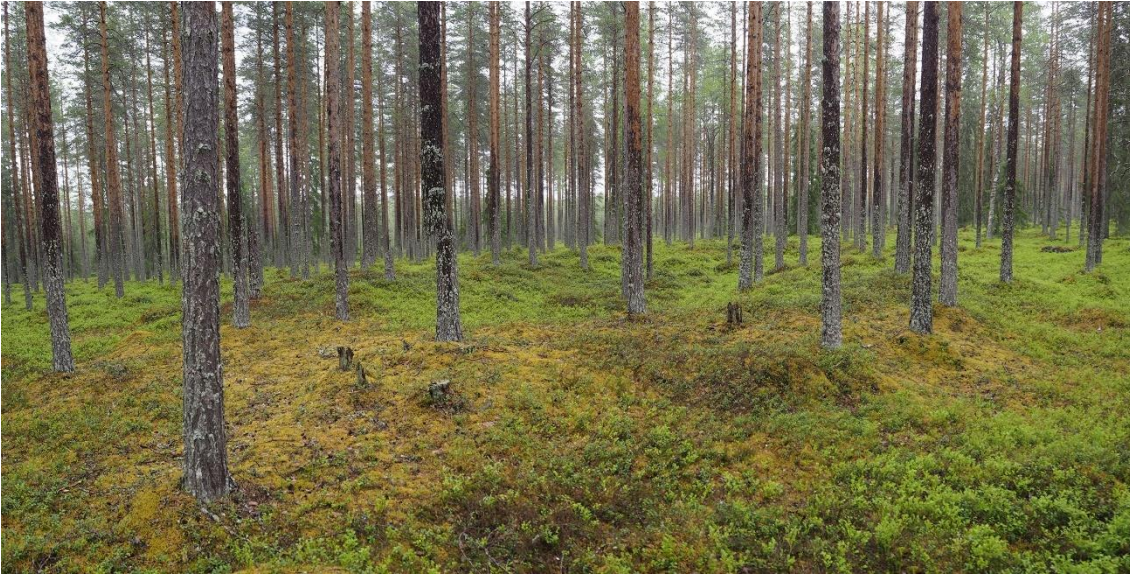
li Mäntyselkä N 2. Neoliittisen kivikauden aikainen asuinpaikka, jolla sijaitsee poikkeuksellisen kookas neoliittiselle kivikaudelle ajoittuva asumuspainanne. Painannetta ympäröi 4–5 metriä leveä valli. Painanteen pohja on noin 1,5 metriä vallin harjaa alemmalla tasolla. Kokonaisuudessaan rakenteen pohjan ala on noin 17 x 34 metriä. Teemu Mökkönen 2020, AKDG6375:2, Museovirasto.