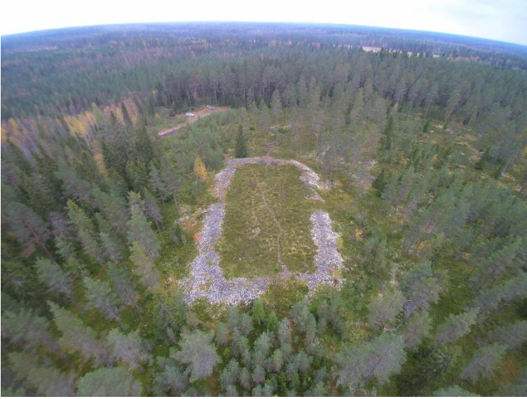
Raahe Kastelli Linnakangas. Neoliittiselle kivikaudelle ajoittuvan jätinkirkon kehävalli on kooltaan 36 x 64 metriä ja sen korkeus on paikoin jopa kaksi metriä. Kehävallin itäpuolella, kuvassa vasemmalla, on asuinpaikka-alueita, jossa on asumuspainanteita, röykkiöitä ja palaneiden kivien kasoja. Kyseessä on yksi Pohjois-Euroopan kivikauden monumentaalisimmista kohteista.