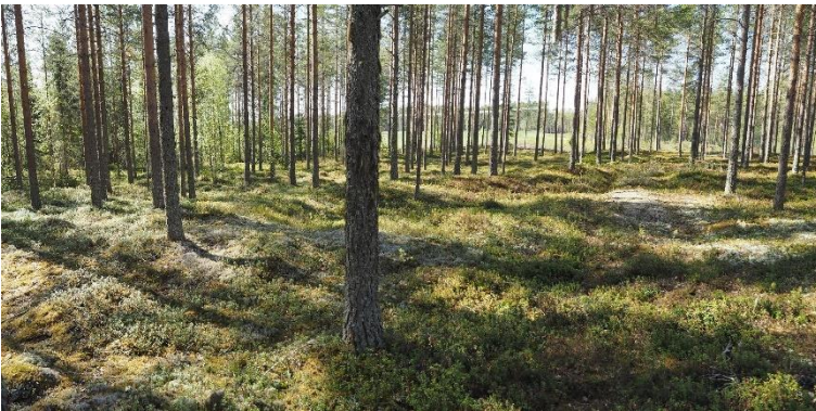
Oulu Peurasuo. Kivi- ja pronssikauden taitteeseen ajoittuva asuinpaikka sijaitsee pääosin mäntymetsässä. Kohteessa on kaksi pitkää ja kapeaa asumuspainannetta. Kuvassa pitkälaisen painaumanäköisen asumuspainanteen koko on noin 4 x 20 metriä. Teemu Mökkönen 2020, AKDG6393:1, Museovirasto.

Rannikon pronssikaudelle ja varhaisrautakaudelle (eteläisen Suomen esiroomalainen ja roomalainen rautakausi) ajoittuvaa ajanjaksoa kutsutaan Sisä-Suomessa ja Perämeren rannikolla yleisesti varhaismetallikaudeksi (1900 eaa. – 300 jaa.). Ajanjakson tunnetuista kohteista, ja siten myös VARK-kohteista, valtaosa on hautaröykkiöitä, joista on mukana pronssikauden alun pitkiä ja kapeita röykkiöitä (esimerkiksi Li Makkarakangas) ja ”normaaleja” pohjaltaan pyöreitä röykkiöitä. Pohjois-Pohjanmaan rannikolta tunnetaan myös nimenomaan varhaisrautakaudelle ajoittuvia röykkiö- ja latomuskalmistoja (Raahe Tervakangas ja Oulu Välikangas).