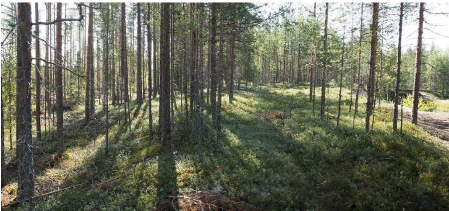
Oulu Vepsänkangas. Pohjois-Pohjanmaan neoliittisen kivikauden alun asuinpaikka, jonka vanhimmat saviastian palat ajoittuvat 5200–5000 eaa. Asuinpaikka-alue sijaitsee tasaisen hiekkakankaan suohon rajoituvalla reunalla. Asuinpaikasta ei ole maan pinnalle näkyviä merkkejä. Teemu Mökkönen 2020, AKDG6479:1, Museovirasto.