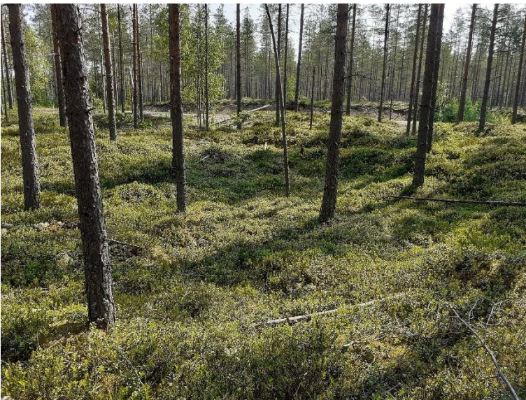
Kronoby Köyrisåsen 1. Bostadsgrop på en boplatsgrop som kan dateras till den neolitiska stenåldern. Bostadsgroparna framträder i tallskogen som flacka gropar. Teija Tiitinen 2021, AKDG6898:1, Museiverket.

I Österbotten är bostadsgropar karaktäristiska för boplatserna från den neolitiska stenåldern, speciellt bostadsgropar som kopplats samman och som bildar radhus. Det finns gott om sådana objekt i Kronoby och delvis också i den åsformation som är belägen i Mellersta Österbotten där tio stenåldersboplatser som ligger nära varandra bildar ett betydande VARK-område som omfattar cirka hundra bostadsgropar (Boplatsvallar i Bläckisåsen och Köyrisåsen). Bland objekten av riksintresse i Österbotten finns också några andra objekt med bostadsgropar från den neolitiska stenåldern samt en av Finlands sydligaste jättekyrkor (Pedersöre Esse-Svedjebacken).