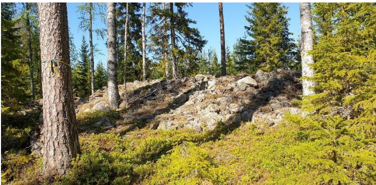
Malax Pörtom-Storstenrösbacken. Det väl bevarade och imponerande röseområdet ligger i en skogsklädd moränbacke. På bilden ett stort gravröse från bronsåldern.