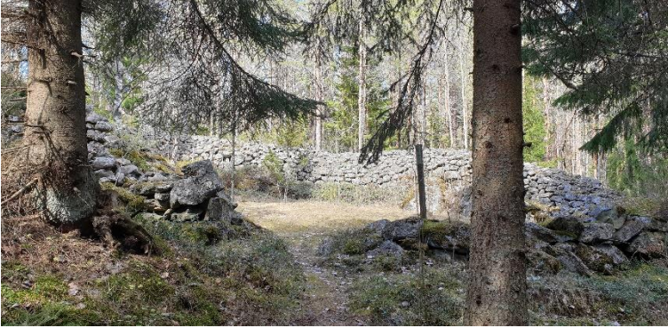
Närpes Finby Muliberget. En humlegård från historisk tid som omges av en 1,5–5 meter hög mur som är kallmurad av sten och har en portöppning. Objektet finns på en skyddad skogklädd sluttning som öppnar sig mot söder.