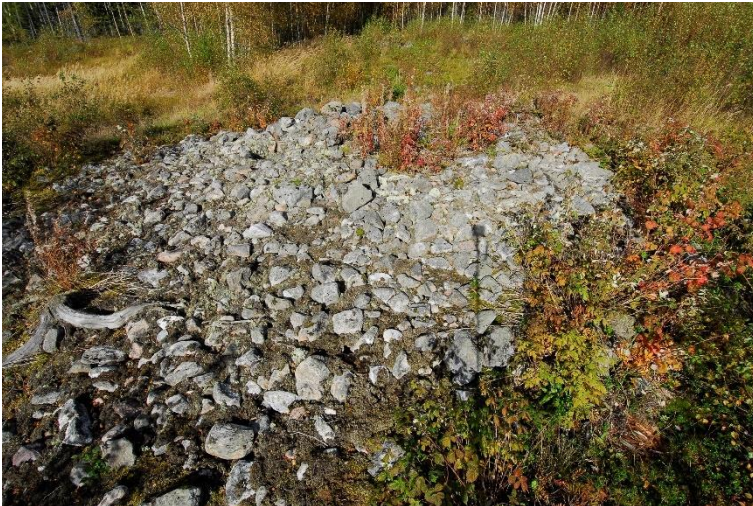
Malax Kalaschabrännan. Ett mångsidigt objekt från mitten av järnåldern med skålgropsstenar, gravrösen och en boplatz där det hittats flera fundament till hallhus. Objektet finns i skogsmark som angränsar till en myr. På bilden ett av objektets totalt tre stora gravrösen.

För Österbottens del finns det relativt få fynd från slutet av järnåldern, men det har dock funnits bosättning i området eftersom Korsholms församling grundades under den senare hälften av 1200-talet. Församlingskyrkan fanns på den plats där Vasa (Mussar) stad grundades senare på 1600-talet. Vasaregionen har uppenbarligen också varit ett objekt av strategiskt intresse, eftersom Albrekt av Mecklenburg anlade Korsholms slott där på 1360-talet. Det antas att det redan före det fanns en hamnplats där.