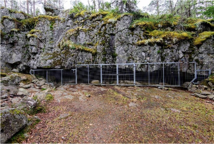
Kristinestad Varggrottan (fi Susiluola) i Bötom. I den grotta som bildats i en vågrät öppning i berget har det hittats föremål och spår av eld. Boplatsen kan dateras till den varmare perioden för 115 000–130 000 år sedan och har förknippats med Neandertalmänniskan.