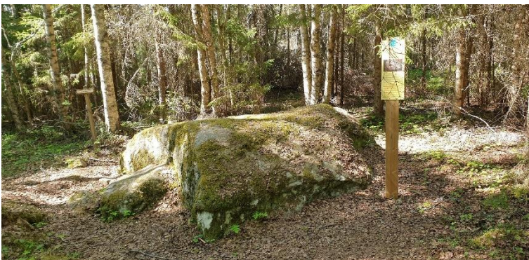
Malax Nisseshaga S. Omfattande boplatz- och gravfältsområde som kan dateras till mitten av järnåldern. Objektet ligger i skogen. På bilden områdets mest imponerande skålgropssten, med totalt cirka 50 skålgropar.

Under den yngre historiska tid som följer efter medeltiden med få objekt, ökar urvalet av objekttyper, vilket också syns i VARK-objekten. Med finns skeppsvarvet på Svartö i Vasa som verkade från 1700-talet till början av 1800-talet. En sällsynt konstruktion som finns i Närpes är Muliberget i Finby, en humlegård som är avgränsad med stenvallar. Den användes ännu i början på 1800-talet, men själva konstruktionen är äldre än så. Ön Boskäret som hör till Vörå har i sin tur anknytning till den för Kvarken betydelsefulla havsfångsten. På ön finns det kvar flera tomtningar från temporärt boende, uppdragningsplatser för båtar, en kompassros och en stenlabyrint. Intressant är också Solvägen i Kristinestad. Objektet är klassificerat som annat kulturarvsobjekt och är en omfattande formation av stengården med anknytning till betesgång.