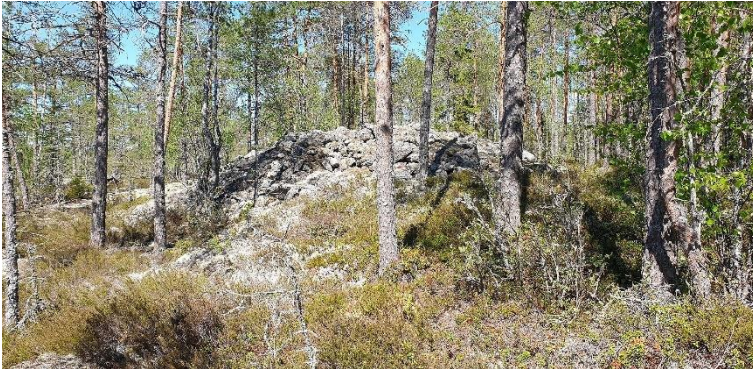
Kristinestad Lappfjärd-Lindåsen S. Röseområde från bronsåldern på en bergås. På bilden en av objektets tio gravrösen.

Även järnåldern i Österbotten präglas av rösegravar. Bland dessa har som VARK-objekt valts Kalli-olaakso/Kiimakankangas rösen i Laihela och en helhet med 44 rösen i Riitasaari samt Alhonmäki-Pahamäki i Vasa där det utöver rösen också finns en boplats.