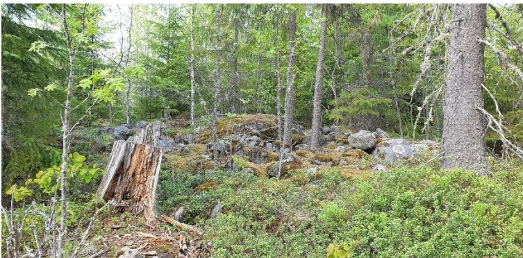
Vasa Tervajoki gruppen. Ett järnåldersobjekt med över hundra rösegravar där de gravar som undersökts huvudsakligen kan dateras till den yngre romartiden och folkvandringstiden. Rösena finns på backar som omger åkrarna. På bilden ett av gravrösena. Teija Tiitinen 2020, AKDG6359:1, Museiverket.

Det kanske mest kända järnåldersobjektet i Österbotten är Nisseshaga S i Malax. Det mångsidiga objektet består av 23 rösen, åtta offerstenar och åtminstone två boplatser. I Malax finns också Kalaschabrännan som är ett betydande och mångsidigt objekt från merovingertiden. Objektet omfattar tre stora rösegravar, fem offerstenar, en fossil åker och en boplats där det hittats fundament till hallhus som är väldigt sällsynta i Finland. Ett objekt av forskningshistoriskt intresse är också grav- och boplatsoområdet Gullydynt i Vörå som kan dateras till folkvandringstiden och merovingertiden, där det bland fynden också finns flera praktföremål som till exempel föremål dekorerade med germansk djuornamentik, ett par guldringar och ett bysantinskt guldmynt.