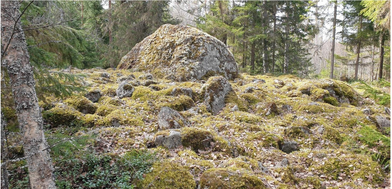
Laihela Kalliolaakso/Kiimakangas. Gravröse som kan dateras till folkvandringens- och merovingertiden i mitten av järnåldern. Det låga och ovanpå jämna röset som är tio meter i diameter har staplats runt en stor centralsten. Det mossbeklädda röset ligger i skogen. Teija Tiitinen 2021, AKDG6818:3, Museiverket.