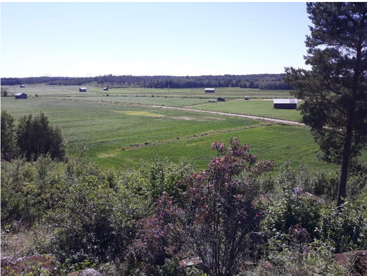
Vörå Oravais slagfält. Ett slagfält från Finska kriget (1808–1809) där Rysslands seger resulterade i att Finland lösgjordes från Sverige och blev ett storfurstendöme och en del av Ryssland. På åkerområdet finns rikligt av föremål från striden. Satu Mikkonen-Hirvonen 2021, AKDG6918:6, Museiverket.