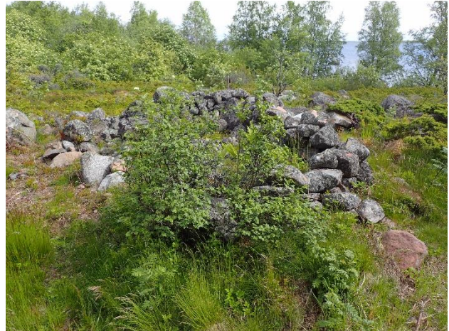
Malax Storskäret. Objekt i den yttre skärgården som kan dateras till historisk tid med bland annat stenla-byrinter (till vänster) och botten från säsongboende så kallade tomtningar som är byggda sten genom kallmurning (till höger). Objekten ligger i en öppen omgivning med få träd.