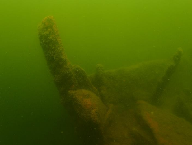
Larsmo John Grafton. Stäven av ett fartyg med metallskrov som sjönk 1905. Vraket är en del av den lokala berättelsetraditionen.