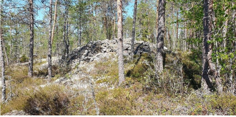
Kristiinankaupunki Lappfjärd-Lindåsen S. Kallioharjanteella sijaitseva pronssikautinen röykkiöalue. Kuvassa yksi kohteen kymmenestä hautaröykkiöstä. Teija Tiitinen 2020, AKDG6334:1, Museovirasto.