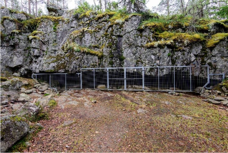
Kristiinankaupunki Karijoen Susiluola. Kallion vaakarakoon muodostuneesta luolasta on löydetty esineistöä ja tulenpidon merkkejä. Asuinpaikka on ajoitettu 115 000–130 000 vuotta sitten valinneen lämpökauden aikaiseksi ja liitetty Neandertalin ihmisiin.