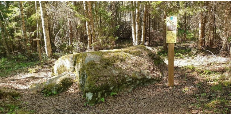
Maalahti Nissashaga S. Laaja keskirautakaudelle ajoittuva asuinpaikka- ja kalmistoalue sijaitsee metsässä. Kuvassa alueen komein kuppikivi, jossa on yhteensä noin 50 kuppia.

Rautakauden loppupuoli on Pohjanmaan osalta verraten niukkalöytöinen, mutta alueella kuitenkin on ollut asutusta, koska 1200-luvun jälkipuoliskolla perustettiin Mustasaaren seurakunta. Seurakuntakirkko on sijainnut paikalla, johon Vaasan (Mustasaaren) kaupunki perustettiin myöhemmin 1600-luvulla. Vaasan seutu on ollut ilmeisesti myös strategisesti merkittävä kohde, sillä 1360-luvulla Albrekt Mecklenburgilainen perusti sinne Korsholman linnan. Oletetaan, että paikalla olisi sijainnut jo tätä ennen satamapaikka.