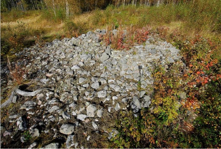
Maalahti Kalaschabrännan. Monipuolissa keskirautakauden kohteessa on kuppikiviä, hautaröykkiöitä ja asuinpaikka, josta on löydetty useita hallitalon pohjia. Kohde sijaitsee suohon rajutuvalla metsämaalla. Kuvassa yksi kohteen yhteensä kolmesta kookkaasta hautaröykkiöstä.