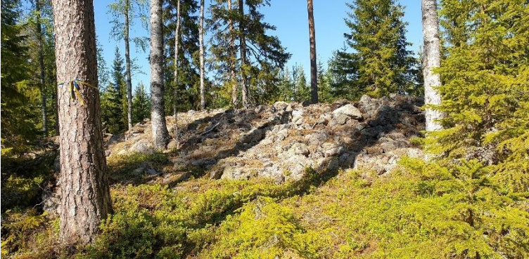
Maalahti Pörtom-Storstenrösbacken. Hyvin säilynyt ja näyttävä pronssikautinen röykkiöalue sijaitsee metsäisellä moreenimäellä. Kuvassa on kookas pronssikautinen hautaröykkiö. Teija Tiitinen 2020, AKDG6350:4, Museovirasto.