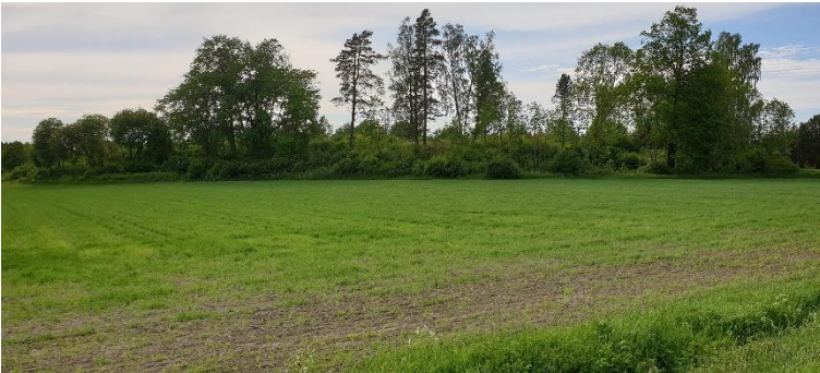
Vaasa Korsholma. 1300-luvulla perustettu linna koostui maavalleista ja hirsivaruksista. Moreenipohjaiseen merensaareen perustettu linna sijaitsee nykyisin peltöjen keskellä.