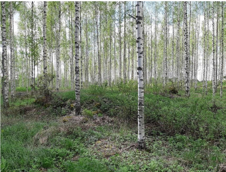
Sastamala Vuorainen. Keskiajalta periytyvä kylätontti, joka autioitui 1700-luvun alkupuolella ennen alueella toteutettua isojakoa. Kohde sijaitsee entisellä hakamaalla, joka metsitettiin 1990-luvun alussa.