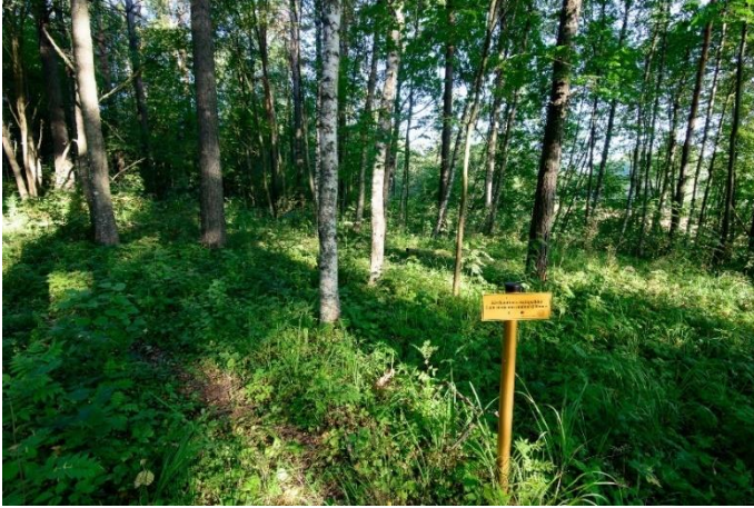
Kangasala Sepänjärvi 1. Neoliittisella kivikaudella, pronssikaudella ja varhaismetallikaudella käytetty asuinpaikka kuuluu tutkimushistoriallisesti merkittäviin Sarsan asuinpaikkoihin. Metsässä sijaitsevasta asuinpaikasta ei ole maan pinnalle näkyviä merkkejä.

Pronssi- ja varhaismetallikautisia kohteita Pirkanmaalta tunnetaan vähän. Suurin osa niistä on Sisä-Suomelle tyypillisiä hautaröykkiöitä eli lapinraunioita, joista useimmat sijaitsevat saarissa tai niemenkärjissä etenkin Näsijärven vesistöalueella. Pirkanmaan VARK-kohteissa on kolme lapinrauniokohdetta (Ruoveden Pilkanniemi, Tampereen Reuharinniemi ja Valkeakosken Visavuori).