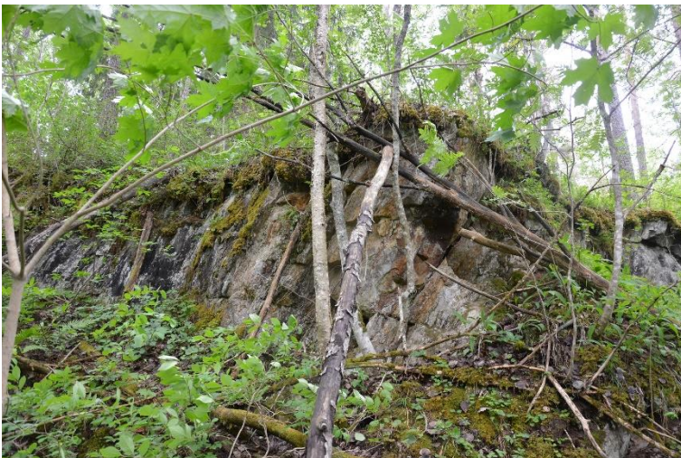
Kangasala Kalkkivuori. Historiallisen ajan kalkkivilouhos, jossa on myös neljä kalkkiuunin jäännöstä. Kuvassa louhittua aluetta. Kohde on nykyisin metsittyä. Ulla Moilanen 2016, KYY 149:160, Museokeskus Vapriikki.

Historiallisen ajan kohteissa heijastuu elinkeinojen monipuolistuminen ja ammattimaistuminen. Tervan- ja hiilenpoltto ovat molemmat edustettuna VARK-kohteissa (Valkeakosken Pyhäsuu, Parkanon Latikkalampi ja Pirkkalan Ania Kränstolppa). Mukana on myös peltojen raivaukseen liittyvä viljely-röykkiökohde Lempäälän Toritun kaskiröykkiöalue. Poikkeuksellisempiin kohdetyyppeihin puolestaan lukeutuvat Kangasalan Kalkkivuoren kalkkilouhos ja kalkinpolttouunit, Pälkäneen Vanha kalkkikaivos ja Ikaalisissa sijaitseva Wehuvarpeen 1700-luvulta peräisin oleva kestikievari.