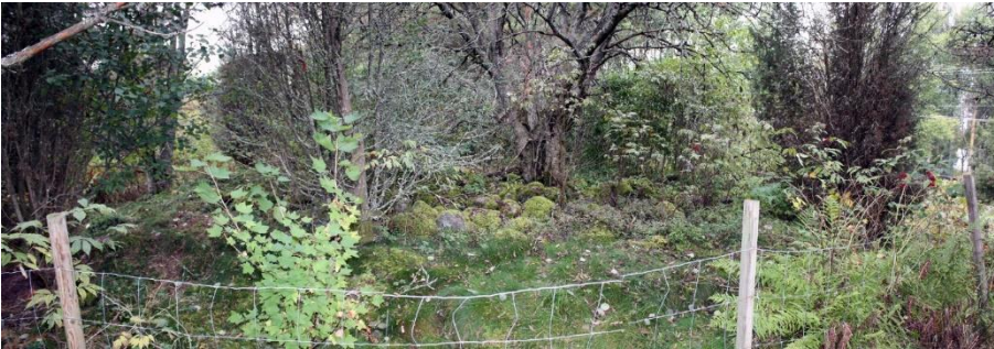
Satamala Kaukola. Laajalta rautakautiselta hautarökkiö- ja asuinpaikka-alueelta tunnetaan liki 390 kiven- ja maansekaisista hautarökkiötä. Vanhimmat löydöt ajoittuvat nuoremmalle roomalaisajalle ja nuorimmat rautakauden lopulle ristiretkiajalle. Kohde sijaitsee asutun maaseutukylän alueella, kosken kummallakin rannalla. Kuvassa on hautarökkiö.

Pirkanmaan vanhimmat rautakautiset haudat ovat yksittäisiä rökkiöön tehtyjä ruumishautauksia. Usein hautaamista samalla paikalla on kuitenkin jatkettu, ja näin on vähitellen muodostunut useiden rökkiöiden muodostamia kalmistoja. Esimerkiksi Lempäälän Päivääniemessä kansainvaellusajalla alkanut rökkiöhautojen rakentaminen on jatkunut aivan esihistoriallisen ajan loppuun saakka. Päivääniemen kalmisto on kulttuuri- ja tutkimushistoriallisesti merkittävä kohde, jonka huomattavimmat tutkimukset on tehty jo 1800-luvulla (vuodesta 1864 alkaen). Toinen tärkeä kansainvaellusaikainen rökkiökalmisto sijaitsee Sastamalan Liekosaassa, joka on Liekovedellä sijaitseva noin kilometrin pituinen saari. Saarella hautarökkiöitä on useammassa paikassa, mutta VARK-kohteeksi niistä on valittu 21 rökkiötä käsittävä kalmisto.