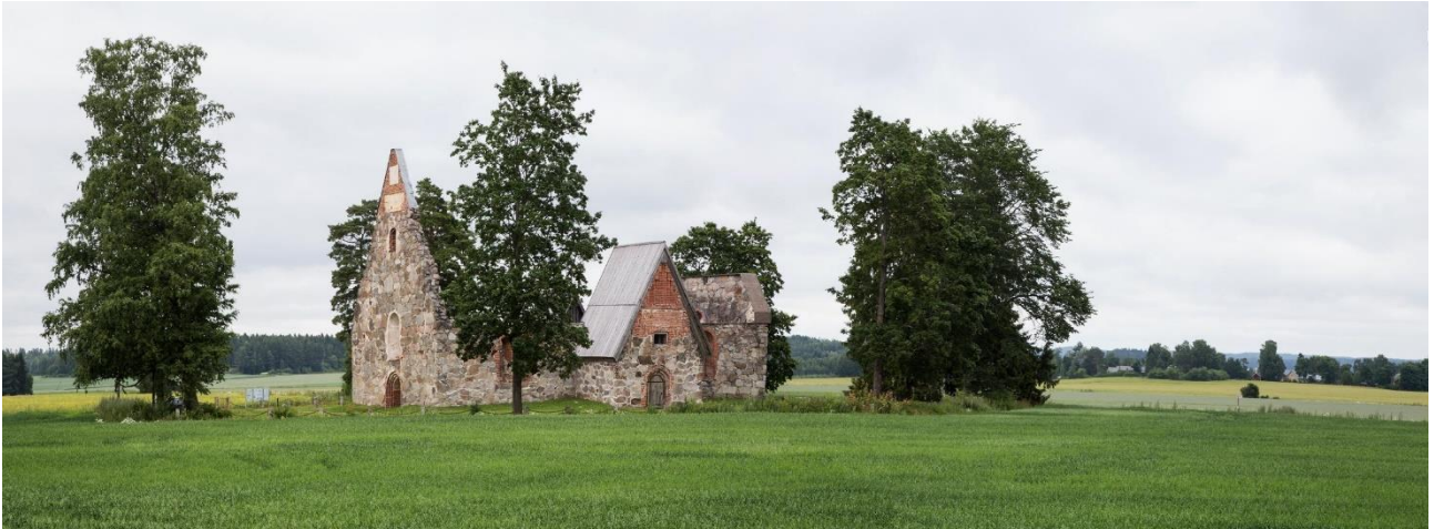
Pälkäne Rauniokirkko. 1500-luvulla rakennettu kivikirkko jäi pois käytöstä 1800-luvulla. Paikan hautausmaa on kirkkoa vanhempi. Vanhimmat löydöt ajoittuvat rautakauden lopulle. Kirkko sijaitsee peltojen keskellä avoimessa maisemassa. Helena Ranta 2017, AKDG5489:5, Museovirasto.