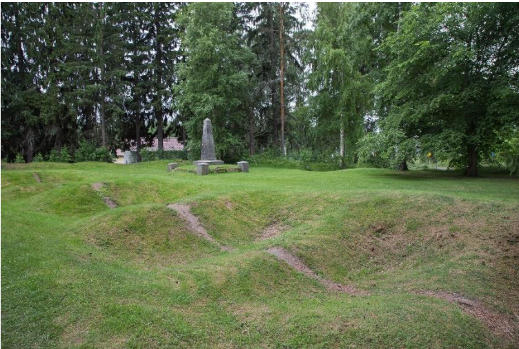
Pälkäne Kostianvirta. Ruotsille tappiollinen Kostianvirran taistelu käytiin vuonna 1713. Sitä seurasi Isovihana tunnettu venäläisten miehitysaika. Kuvassa on taisteluun liittyviä kaivantoja. Helena Ranta 2017, AKDG6798:2, Museovirasto.

Sisämaa-alueena Pirkanmaalta puuttuvat merkittävät historiallisen ajan puolustusvarustukset lukuun ottamatta isovihan aikaista Pälkäneen Kostianvirran taistelupaikkaa vuodelta 1713 ja ensimmäisen maailmansodan linnoitteisiin kuuluvaa Vesilahden Narvan maalinnoitusta. Kulkemiseen liittyviä muinaisjäännöksiä alkaa historiallisella ajalla muodostua runsaammin. Vesistöjen halkomassa maakunnassa vesistöt ovat olleet erittäin tärkeitä kulkureittejä sekä ihmisille että tavaroille. Valta-kunnallisesti arvokkaaksi kohteeksi on luokiteltu Lempäälässä sijaitseva Rikalan kanava, joka oli