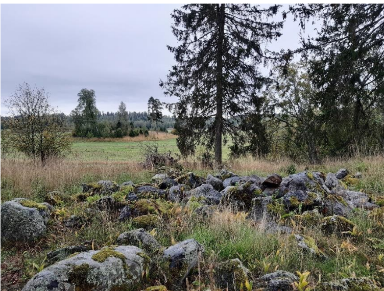
Vesilahti Pajalahdenranta ja Riihimäki. Rautakautisia kiven- ja maansekaisia rökkiöhautoja, jotka ajoittuvat kansainvaellusajalta ristiretkiajalle. Rökkiöt sijaitsevat peltoalueen kivikkosilla kumpareilla järven läheisyydessä. Kohde on osa Laukoin kartanon muinaisjännökset -nimistä VARK-aluetta.