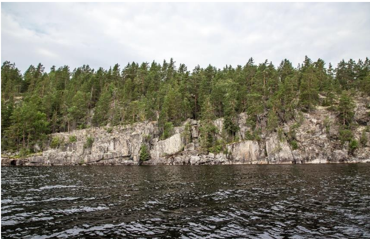
Kuhmoinen Pyhänpää. Neoliittiselle kivikaudella ajoittuva kalliomaalaus-sijaitsee kuvan keskellä rannassa olevan louhikon oikealla puolella. Maalaus on tehty suoraan veteen tippuvaan kalliopintaan. Helena Ranta 2017, AKDG6761:2, Museovirasto.