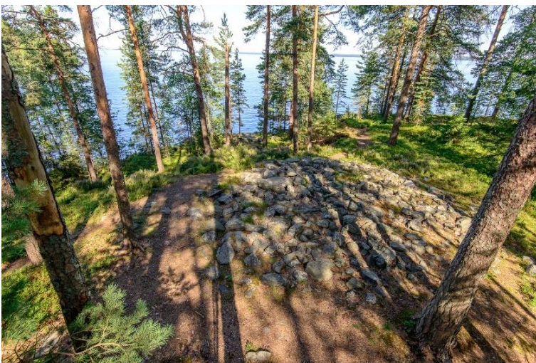
Tampere Reuharinniemi. Toinen Reuharinniemen varhaismetallikautisista lapinraunioista. Kohde sijaitsee metsässä järveen työntyvän niemen kärjessä. Vesa Laulumaa 2015, AKDG5442:1, Museovirasto.