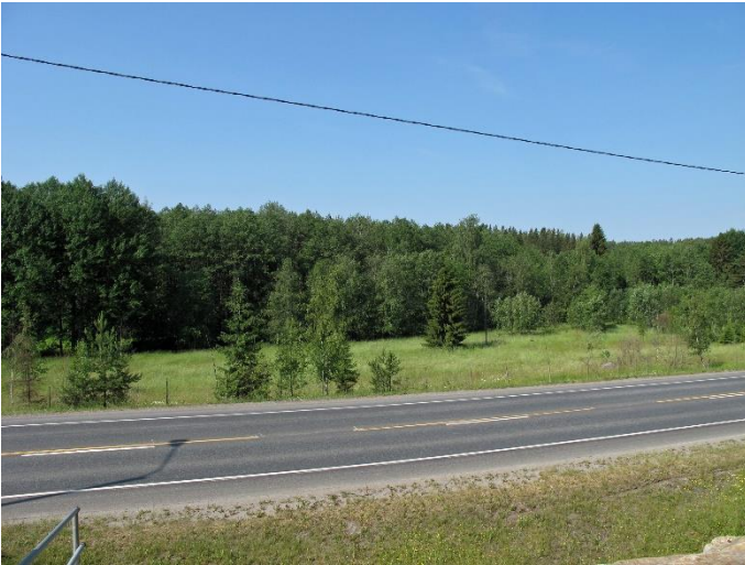
Lahti Ristola. Kivikautinen asuinpaikka, josta tunnetaan Etelä-Suomen vanhinta mesoliittisen kivikauden asutusta. Nykyisin asuinpaikka sijaitsee Porvoonjoen varressa noin 50 kilometrin päässä merestä, mutta mesoliittisen kivikauden asutuksen aikana se on sijainnut meren rannan tuntumassa. Esko Tikkala 2019, PHM(VA)34, Lahden museot.

Asuinpaikat ovat yleisimpiä neoliittisen eli keraamisen kivikauden kohteita. Päijät-Hämeestä on mukana neljän tämän aikakauden eri vaiheisiin ajoittuvaa asuinpaikkaa. Lahden Kilpisaari 1 on näistä vanhin. Se edustaa vanhemman varhaiskampakeraamiikan aikaa, jolloin saviastioiden valmistustaito levisi Etelä-Suomeen. Hieman nuoremmaksi ajoittuu jo edellä mainittu litin Salmenniemen asuinpaikka, josta on ainakin nuorempaan varhaiskampakeraamiikkaan ja tyypilliseen kampakeraamiikkaan ajoittuvaa asutusta, joka ajoittuu noin 4500–3500 eaa. Asuinpaikalla on tutkittu myös kookkaita pohjaltaan osin maahan kaivettuja asumuspainanteita. Salpausselkien eteläpuolelta on mukana myös edellä mainittu Lahden Ristola, jossa on mesoliittisen asutusvaiheen lisäksi myös laajoille alueille Keski- ja Pohjois-Euroopassa levinneen neoliittiselle kivikaudelle ajoittuvan nuorakeraamisen kulttuurin asuinpaikka (3. vuosituhat eaa.).