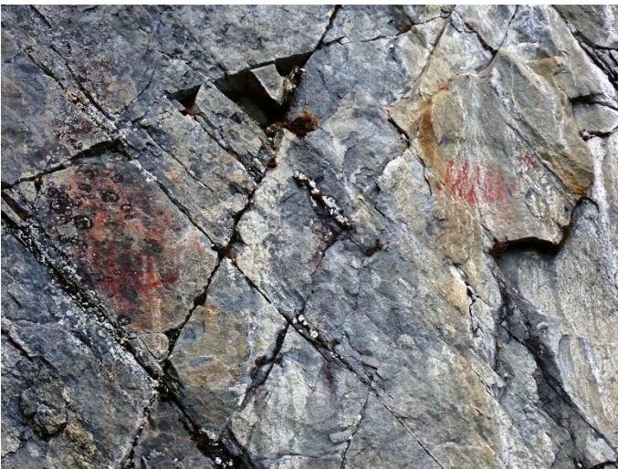
Asikkala Patalahti. Neoliittiselle kivikaudelle ajoittuva kalliomaalaus, jonka kuva-aiheina on kaksi venekuviota. Maalaus sijaitsee pystysuorassa kallioseinämässä Päijänteen rannalla. Esko Tikkala 2020, PHM(VA)9, Lahden museot.