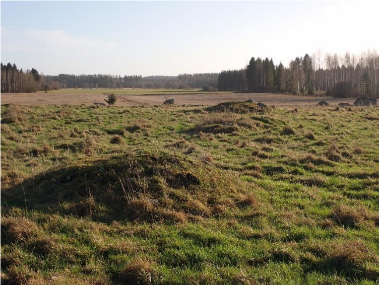
Hartola Pohjola (Pohjola). Historiallisen ajan autioituneella kylätontilla on nähtävissä kasvillisuuden peittämiä röykkiöitä (kuvassa), kiviaitoja, rakennuksen perustuksia ja kuppikiviä. Kohde sijaitsee laidunalueella. Esko Tikkala 2020, PHM(VA)15, Lahden museot.

Päijänteen eteläpuoleiselta alueelta on mukana yksi pitkään käytetty rautakautinen asuinpaikka, Lahden Paakkolanmäki 2 ja 3 (400–1000 jaa.), josta on löydetty normaalien asuinpaikkalöytöjen lisäksi hirsirakennuksen jäänteet, liesiä ja paalunsijoja ja kaksi viikinkiaikaista polttohautakalmistoa. Hollolasta mukana olevat kohteet ajoittuvat pääosin esihistoriallisen ja historiallisen ajan taitteeseen, ristiretki- ja keskiajalle. Näitä kohteita ovat Kapatuosian muinaislinna ja Kirkkailanmäen ruumiskalmisto, josta on sekä esineellisiä että esineettömiä kristillisiä haustausta. Jälkimmäiset viittaavat paikalla mahdollisesti sijainneeseen kirkkoon tai kappeliin.