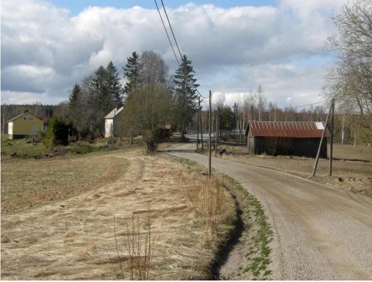
Hollola Kirkkailanmäki. Rautakauden lopulle ristiretkijälle ja keskiajalle ajoittuva ruumiskalmisto, jossa on myös polttohautauksia. Esineellisten haustausten lisäksi kalmistossa on esineettömiä haustausta, joiden oletetaan olevan kristillisiä. Kalmisto sijaitsee maalaismaisemassa ladon kohdalla tien molemmin puolin. Kalmistosta ei ole havaittavissa merkkejä maan pinnalle. Antti Bilund 2020, PHM(VA)106, Lahden museot.