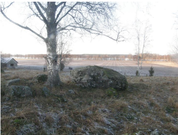
Sysmä Koskuemäki 2. Nuoramoisten rautakauden VARK-alueeseen kuuluva kookas kuppikivi, jossa on yhteensä 31 kuppia. Kohde sijaitsee peltojen välisellä harjanteella, joka on laidunalueena. Antti Bilund 2020, PHM(VA)61, Lahden museot.