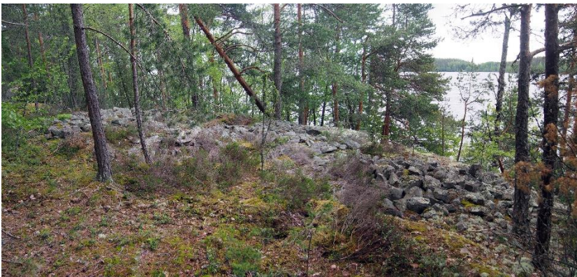
Iitti Hiidensalmi. Varhaismetallikautiset lapinraunionot sijaitsevat saarella järven rannan tuntumassa. Teemu Mökkönen 2019, AKDG5723:2, Museovirasto.

Suurin osa Päijät-Hämeen mukana olevista kohteista ajoittuu rautakaudelle, ja erityisesti viikinki- ja ristiretkiajalle eli myöhäisrautakaudelle (800–1150 eaa.). Kaikki kohteet sijaitsevat Ensimmäisen Salpausselän pohjoispuolella, jossa ne sijoittuvat Päijänteen eteläpuoleisten järvien alueelle Hollolaan ja Lahteen, Päijänteen rannoille Asikkalaan ja Padasjoelle, ja maankunnan pohjoisosassa Päijänteen itäpuolen jokien ja järvien rantamille Hartolaan ja Sysmään.