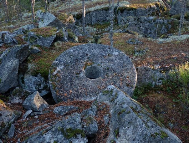
Orimattila Keituri Kivikallio. Historiallisen ajan louhos sijaitsee metsässä kallioalueella. Sitä on käytetty 1790-luvulta 1920-luvulle. Kuvassa on louhosalueella sijaitseva valmis myllynkivi.

aikaan. Sysmän kirkkoseudun kokonaisuuteen kuuluu mukaan myös keskiaikainen kirkko ja autioitunut pappilan tontti. Muut yksittäiset VARK-alueet Päijänteen itäpuolelta Hartolasta ja Sysmästä ovat pitkälti vastaavia kohteita, joissa on asutusjatkumo rautakaudelta keskiajalle ja usein myös nuoremmalle historialliselle ajalle.