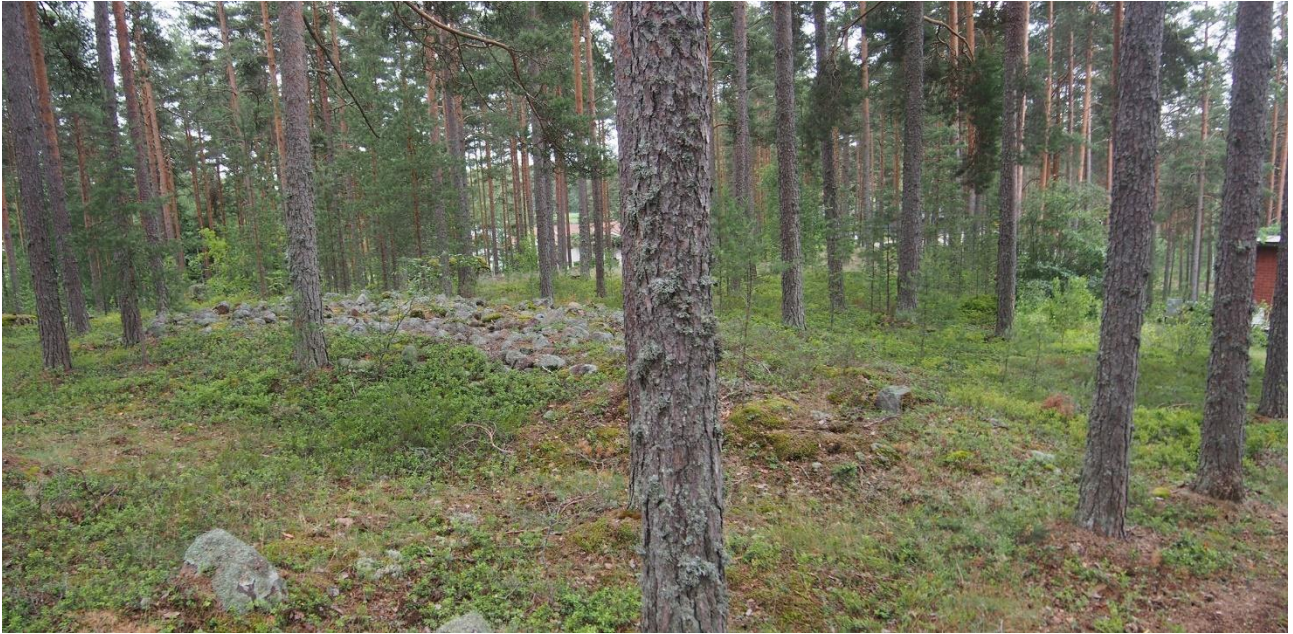
Pyhtää Hautaharju 1. Neljä yhteen kasvanutta hautaröykkiötä muodostavat kaksikymmentä metriä pitkän ketjun. Kohde sijaitsee moreeniharjun merenpuoleisessa päässä. Pohjoisin röykkiö (kuvassa oikealla) on lähes kokonaan sammalen peittämä. Teemu Mökkönen 2019, AKDG5758:1, Museovirasto.