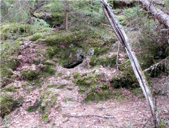
Hamina Hitonharjun Pirunpesä. Kideonkalosta on louhittu savukvartsia kivikaudella. Sisäänkäynti kallion sisäiseen onkaloon käy halkaisijaltaan noin puolimetrisen aukon kautta. Teemu Mökkönen 2019, AKDG5714:1, Museovirasto.

Pronssikauden kohteita edustavat rannikon röykkiö- ja latomuskalmistot, joista näyttävimpiä ovat Kotkan Höyterin kalmistokokonaisuus ja Virolahden Vähä-Harvajanniemen röykkiöt. Sisämaan kohteita edustaa muutama röykkiökohde Kouvolasta, mutta ne saattavat ajoittua myös vanhemman rautakauden puolelle. Sisämaan lapinraunioita ei Kymenlaaksosta ole mukana.