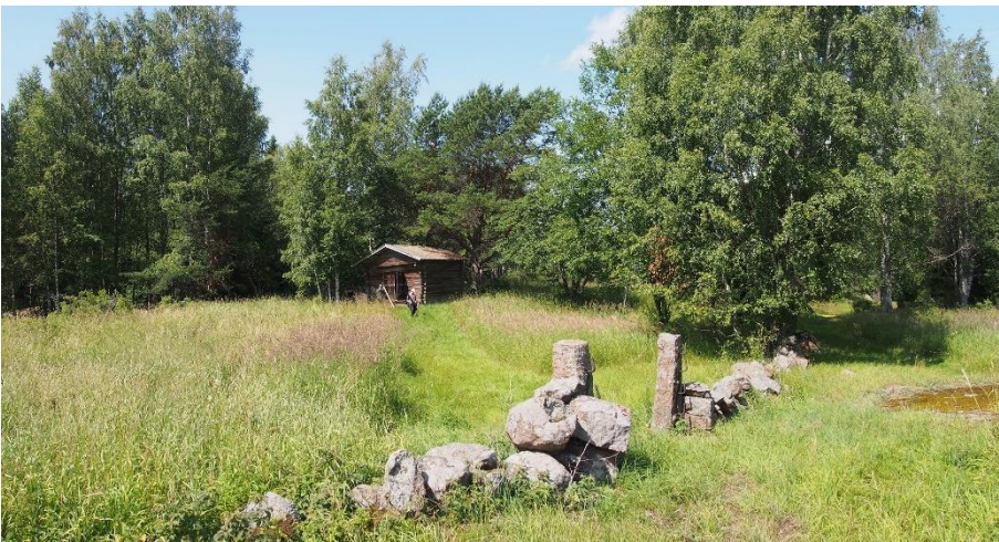
Hamina Kuorsalo. Autioitu-neella kylänpaikalla on re-hevä niitty. Viimeistään keskiajalla syntynyt kylän-paikka autioitui 1800-lu-vulla kylän siirryttyä uuteen paikkaan. Teemu Mökkö-nen 2019, AKDG5819:1, Museovirasto.