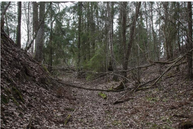
Kouvola Nappa lauttavalkama. Lauttavalka-maan vievän Ylisen Viipurintien vanha pohja on kulunut näyttäväksi uraksi joen törmällä. He-lena Ranta 2019, AKDG5764:1, Museovirasto.