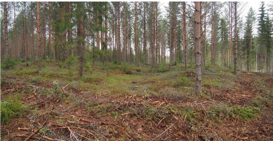
Virolahti Karpankangas. Neoliittisen kivikauden asuinpaikka, jossa on isompia, korkeitten vallien ympäröimiä pitkänomaisia asumuspainanteita. Kuvassa kohteen isoin painanne (40 x 13 m) kuvattuna pituusakselin suuntaisesti. Teemu Mökkönen 2019, AKDG5743:2, Museovirasto.