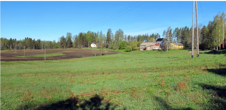
Hamina Tonttila. Tonttilan kivikautinen asuinpaikka-alue seurailee aikansa merenrantaa lähes kilometrin pituisena loivan peltorinteen yläosassa. Asuinpaikka-alue on pääosin pellolla, mutta osin myös metsässä. Teemu Mökkönen 2019, AKDG5720:1, Museovirasto.