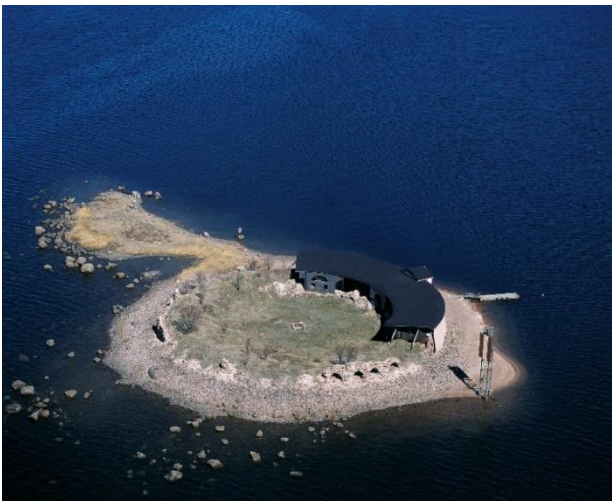
Kotka Fort Slava. 1700-luvulla rakennetun Ruotsinsalmen merilinnoituksen osa. Linnoitus on osa linnoitteista ja hylkyalueesta koostuvaa Ruotsinsalmen VARK-aluetta. Lentokuva Hannu Vallaksen kokoelma 2003, RHO125410:1, Museovirasto.

Historiallisen ajan kohteiden nuorinta kerrostumaan edustavat ensimmäisen maailmansodan linnoituslaitteet Kotkan Kokonkoski 1 ja 2 ja Kouvolan Kettulanvuori.