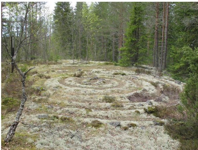
Miehikkälä Ylikorvenkangas. Sisämaassa sijaitseva jatulintarha on osittain jäkälän ja muun kasvillisuuden peittämänä. Kohde ajoittuu historialliselle ajalle. Teemu Mökkönen 2019, AKDG5735:1, Museovirasto.