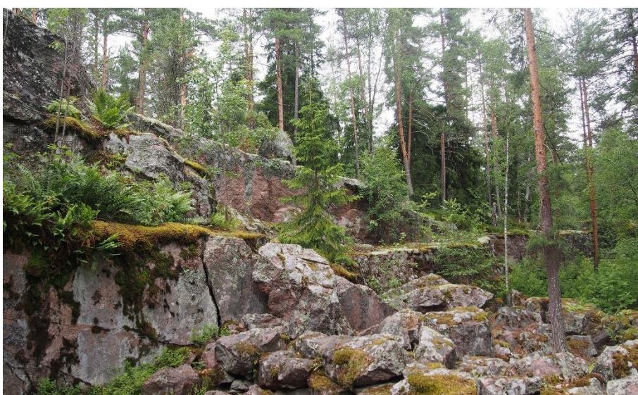
Virolahti Pyterlahden Hevonniemen louhokset. Kuvassa oleva louhos Q toimi 1860-luvulla. Alueelta on louhittu muun muassa Pietarin lisäksi kirkon pylväät. Teemu Mökkönen 2019, AKDG5756:5, Museovirasto.