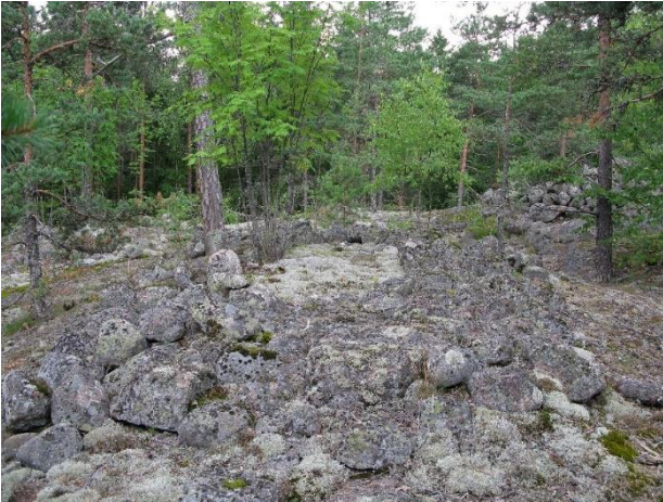
Kotka Sunakieli. Laivalatomusta muistuttava hauta-rakenne (f) on osa useasta arkeologisesta kohteesta koostuvaa Höyterin röykkiöt -nimistä VARK-aluetta. Kohteet ajoittuvat pronssikaudelle ja osin varhais-rautakaudelle. Helena Ranta 2011, AKDG4729:2, Museovirasto.

Keskiaikaisia arkeologisia kohteita tunnetaan Kymenlaaksosta vain muutama. Virolahden Lapurin 1200-luvun lopulle ajoittuva hylky on Suomen vanhin tunnettu hylkykohde. Keskiaikaisissa kyläkoh-teissa Haminan Kuorsalossa ja Virolahden Ala-Pihlajan Jokipellossa on myös nuorempia kerrostu-mia.