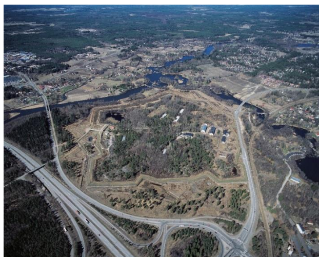
Kotka Kymminlinna. 1700-luvun lopulla ja 1800-luvulla rakennettu linnoitus on osa Pietarin suojaksi rakennettua puolustusjärjestelmää. Lentokuva Hannu Vallaksen kokoelma 2003, RHO125406:1, Museovirasto.