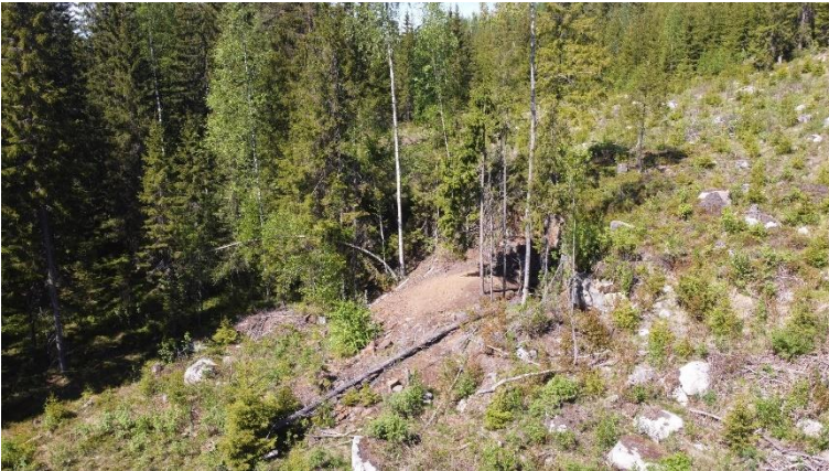
Jyväskylä Halsvuoren hopeakaivos. 1700-luvun hopeakaivos sijaitsee metsäisessä jyrkässä rinteessä. Kuvan keskellä näkyy jätemaakasaa, joka ympäröi pienikokoista avokaivosta.