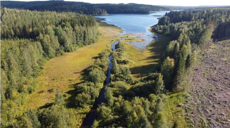
Keuruu Suolahti Suojoki. Keskiaikainen muinaissatama tai venevalkama sijaitsee nykyisin joen rantaniityllä. Kosteassa ja soistuneessa maaperässä on säilynyt kymmenien ommeltujen veneiden osia, ahkioita ja muuta orgaanista tavaraa. Miikka Kumpulainen 2020, K2528/0063, Keski-Suomen museo.