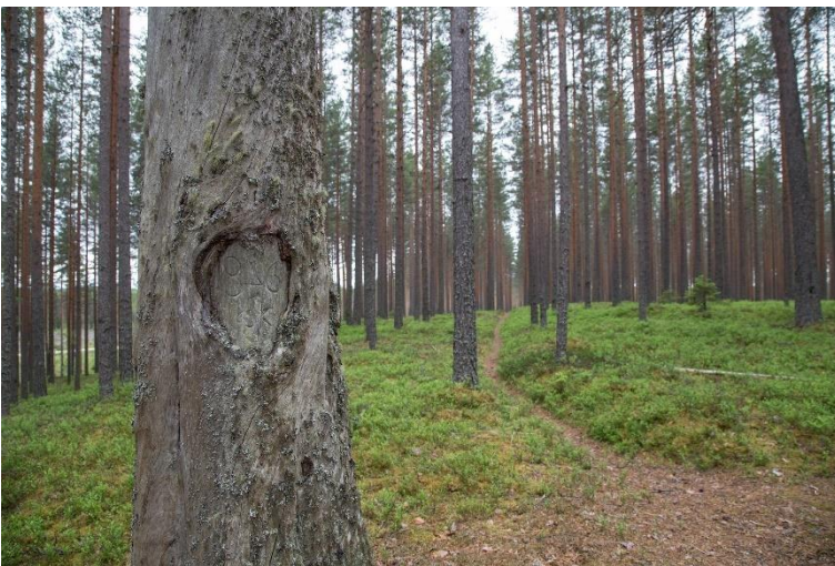
Saarijärvi Pyhäkangas. 1800-luvulle ajoittuva karsikkopuiden alue. Kaiverretut pilkat on tehty mäntyjen runkoihin, jotka sijaitsevat kangasmetsässä vanhan tien varrella.

Historialliseen aikaan ajoittuvia muinaisjäänköksiä Keski-Suomessa on jo enemmän. 1600–1700-luvuilla alkaneen varhaisen teollisuuden vaiheesta kertoo Jyväskylän Halsvuoren Hopeakaivos (käytössä 1700-luvulla). Kolmen maakunnan, Keski-Suomen, Pohjois-Pohjanmaan ja Pohjois-Savon, rajalla sijaitseva Rillankiveksi kutsuttu maakuntien rajakivi on myös VARK-kohteena. Vanhimmat sitä koskevat varmat tiedot ajoittuvat 1700-luvulle, mutta todennäköisesti se on toiminut maakuntien rajana jo 1400-luvulla.