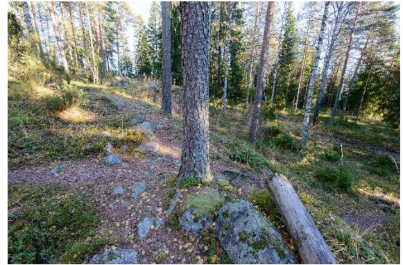
Jämsä Linnasenmäki. Rautakauden lopulle tai keskiaikaan ajoittuva muinaislinna sijaitsee Jämsänjoen varrella jyrkän mäen laella (vasemmalla). Metsässä sijaitsevan linnan matalan kivivallin jäänteitä on yhteensä 125 metrin matkalla (oikealla). Valokuvat: Miikka Kumpulainen 2020, K2528/0044, Keski-Suomen museo. Vesa Laulumaa, AKDG4644:2, Museovirasto.

Pelkästään rautakauteen ajoittuvia kohteita tunnetaan jo huomattavasti enemmän. Valtakunnallisesti merkittäviksi niistä on arvioitu kolme: Jämsän Hiidenmäen ja Kissankallion viikinkiaikaiset polttokenttäkalmistot sekä Viitasaaren Rantala B -niminen lapinraunio. Jälkimmäisen tutkimuksissa vuonna 1926 siitä löydettiin putkikirves, pronssinen rannerengas ja sormus sekä nuoremmalle roomalaisajalle (200–400 jaa.) ajoittuva roomalainen kullattu lasihelmi.