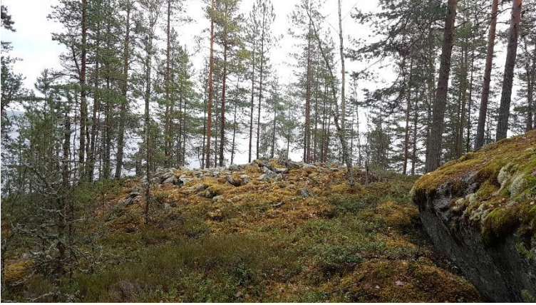
Jyväskylä Koukkukallio. Varhaismetallikautinen lapinraunio sijaitsee näyttävällä paikalla järven rantakalliolla. Miikka Kumpulainen 2020, K2528:0019, Keski-Suomen museo.