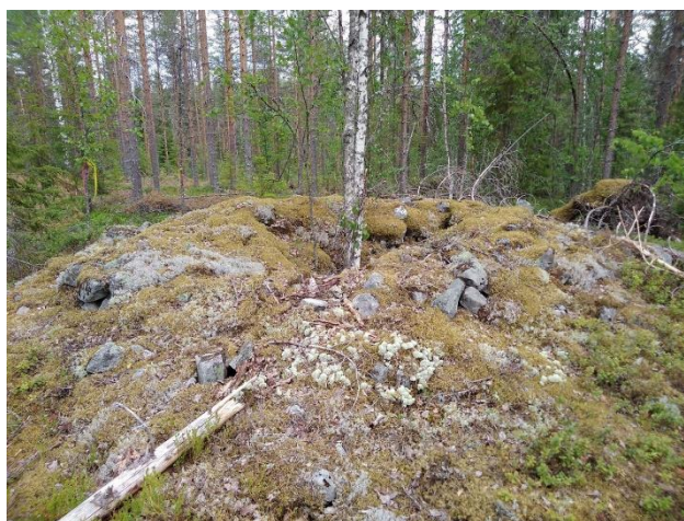
Bostadsgrop som kan dateras till den neolitiska stenåldern (till vänster, Kaustby Kangas) och ett stenröse på en boplats som kan dateras till samma tid (till höger, Karleby Kuurnakangas). Objekten finns numera i inlandet i skogar på sandmark. Lauri Skantsi 2020, KHRARK65:7 och KHRARK65:43, K.H. Renlunds museum.