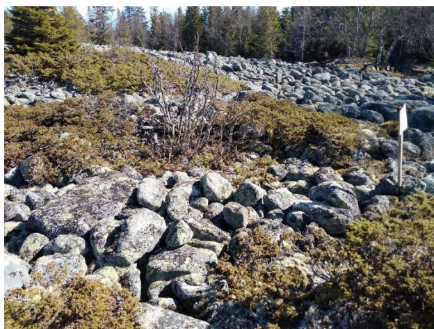
Säsongboplatser som hänförs till utnyttjande av den yttre skärgården under historisk tid (till vänster Karleby Grillskäret, till höger Karleby Norra Hamnskäret) På bilderna tomtningar som byggts genom att kallmura av natursten, det vill säga botten till säsongbostäder som använts av fiskare. Lauri Skantsi 2020, KHRARK65:20 och KHRARK65:60, K.H. Renlunds museum.