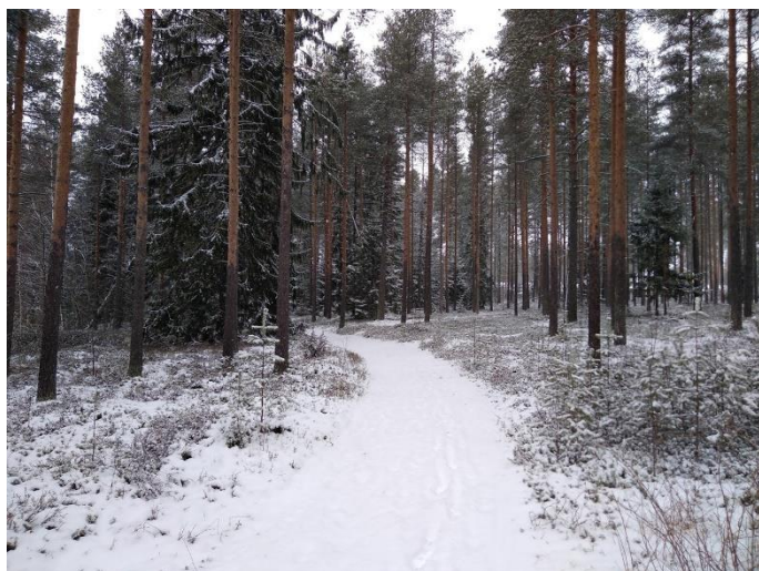
Vetil Kiikkuniemi 2. Boplatser som kan dateras till början av stenåldern och som en gång i tiden fanns vid mynningen av Perho å. Det finns inga synliga tecken på markytan efter boplatserna som finns i skog på sandmark. Lauri Skantsi 2021, KHRARK65:172, K.H.Renlunds museum.

De äldsta VARK-objekten i Mellersta Österbotten kan dateras till början av den neolitiska det vill säga den keramiska stenåldern. Det här skedet representeras av Kukkuuniemis tre omfattande boplatser i Vetil, som under bosättningstiden (cirka 5200–4000 f.v.t.) varit belägna där Perho å utmynnade i havet. Bland fynden från objekten finns både äldre och yngre tidig kamkeramik, varav det yngre skedet också omfattar en asbestblandad version av den yngre tidiga kamkeramiken som spridit sig till kusten från Saimens avrinningsområde.