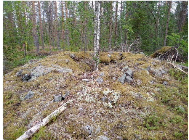
Neoliittiselle kivikaudelle ajoittuva asumuspainanne (vasemmalla, Kaustinen Kangas) ja samaan aikaan ajoittuvalla asuinpaikalla sijaitseva kiviroykkyö (oikealla, Kokkola Kuurnakangas). Kohteet sijaitsevat nykyisin sisämaassa hiekkapohjaisissa metsissä. Lauri Skantsi 2020, KHRARK65:7 ja KHRARK65:43, K. H. Renlundin museo.