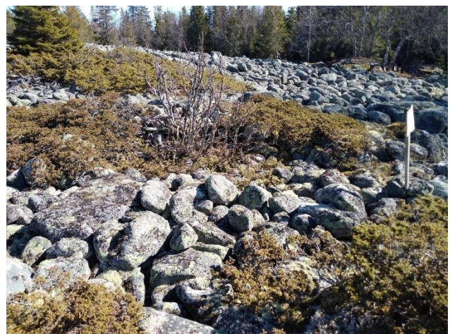
Historiallisen ajan ulkosaariston hyödyntämiseen liittyviä sesonkiasuinpaikkoja (vasemmalla Kokkola Grillskäret, oikealla Kokkola Norra Hamnskäret). Kuvissa luonnonkivistä kylmämuuraamalla rakennettuja tomtning-jäännöksiä eli kalastajien käyttämä sesonkiasumuksen pohja. Lauri Skantsi 2020, KHRARK65:20 ja KHRARK65:60, K. H. Renlundin museo.