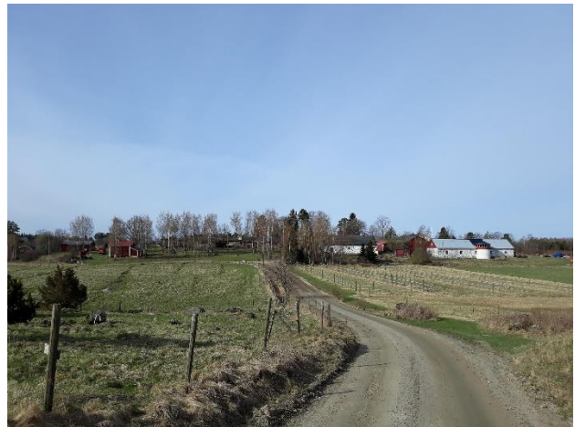
Hattulan Retulansaarella sijaitseva VARK-alue koostuu rautakaudelta historialliselle ajalle ajoittuvista kohteista. Kiettarassa (vasemmalla) on rautakautisia hautaröykkiöitä, peltoraunioita ja kaksi kuppikiveä. Retulassa (oikealla) on sijainnut historiallisella ajalla tiivis kylätontti, jonka asutus on alkanut löytöjen perusteella jo rautakaudella. Kohteet sijaitsevat pääosin peltojen reunoilla laidunmaalla ja metsissä. Olli Soininen 2021, AKDG6861:2, ADGG6865:1, Museovirasto.