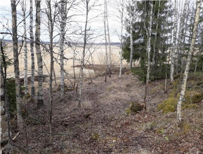
Humppila Järvensuo 1. Kuivatun järven rannalla sijaitseva neoliittisen kivikauden asuinpaikka, jonka kerrostumat ovat osin kuivalla maalla ja osin märkien suokerrosten alle jääneenä nykyisellä suo- ja peltoalueella. Suokerrostumien säilömät puuesineet ajoittuvat noin 4000–1750 eaa. Olli Soininen 2021, AKDG6867:1, Museovirasto.

Neoliittisen kivikauden nuorakeraamista kulttuuria (2900–2100 eaa.) pidetään ensimmäisenä vaiheena, jolloin yhteydet länteen ja etelään vahvistuvat ja oletetaan, että Suomeen olisi tuolloin tullut myös uusia asukkaita. Tähän vaiheeseen kuuluvista paikoista VARK-kohteeksi on valittu Hämeenlinnan Perkiön erittäin runsaslöytöinen asuinpaikka. Sieltä on löydetty yli 30 000 keramiikan palaa, jotka edustavat koristelultaan ainakin 120 erilaista astiaa. Oletetaan, että Perkiössä olisi sijainnut keramiikan valmistukseen erikoistunut verstaas.