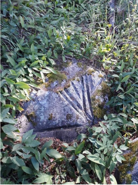
Hämeenlinna Gammelgård 2. Miekanhiontakiveksi kutsuttu uurrehiontakivi. Vastaavia kiviä tunnetaan Suomesta viisi. Ne ajoittuvat esihistorialliseen aikaan. Olli Soininen 2020, AKDG6549:1, Museovirasto.

Varhaismetallikautisia ja pronssikautisia kohteita on Kanta-Hämeessä vähän. Tämä voi johtua puutteellisesta tutkimustilanteesta. Varhaismetallikautta tai pronssikautta VARK-kohteissa edustaa Forssan Salmistonmäen asuinpaikka ja Janakkalan Hakoisten VARK-alueella sijaitseva Hampgulan asuinpaikka, joka ajoittuu pronssi- ja rautakaudelle. Nämä molemmat ovat kooltaan varsin pienialaisia ja sijaitsevat kumpareilla peltojen keskellä.