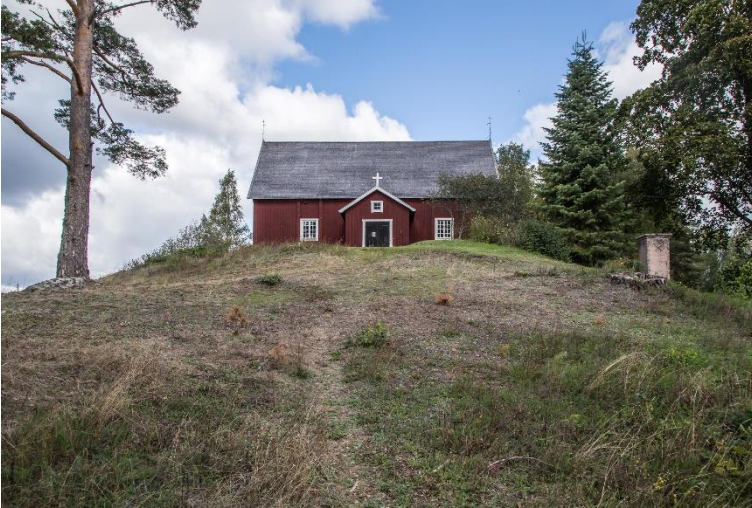
Loppi Lopen Vanha kirkko. 1660-luvulla valmistunut puukirkko ja kirkkomaa jäivät pois käytöstä vuonna 1805. 1400-luvun alkupuolella itsenäistyneen seurakunnan aikaisempien kirkkojen oletetaan sijainneen tällä samalla paikalla. Kirkkoa käytetään yhä kesäkuukausina.