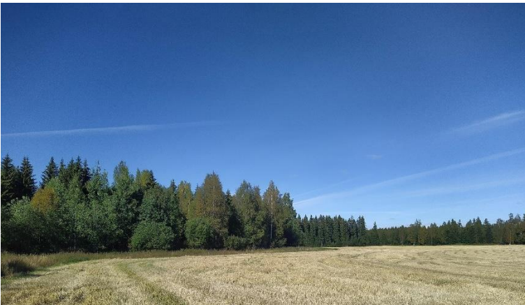
Riihimäki Silmäkenevan saari 1 A-C. Suosaarekkeessa sijaitseva neoliittisen kivikauden asuinpaikka, jonka löytökerros on jäänyt suokerrosten alle. Silmäkeneva on ollut aikoinaan suurempi vesiallas, jonka kautta Vantaanjoki on laskenut. Allas on nykyisin soistunut ja osin peltona. Sen saarissa on kivilautisia asuinpaikkoja, joista ei ole maan pinnalle näkyviä merkkejä. Olli Soininen 2021, AKDG6939:1, Museovirasto.