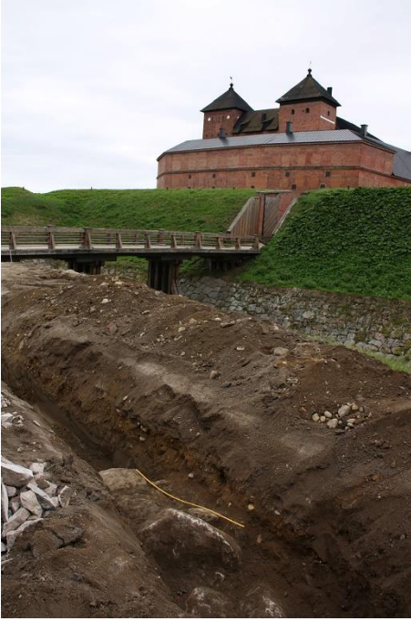
Hämeenlinna Hämeen linna. Keskiaikaisen linnan rakentaminen aloitettiin jo 1200-luvun lopulla. Linnaa ympäröivät kuivassa näkyvät puolustusvarustukset rakennettiin 1700-luvulla.

Kanta-Hämeen valtakunnallisesti merkittäviä puolustusvarustuksia ovat keskiaikaiset Hakoistenlinna, sen kanssa samaan VARK-alueeseen kuuluva Hangasmäki ja Tenholan linnavuori. Hakoistenlinna ympäristöineen on yksi Suomen laajimmista VARK-alueista, johon sisältyy linnan lisäksi seitsemän muuta rautakaudelle tai keskiajan alkuun ajoittuvaa kohdetta: asuinpaikkoja, kuppikiviä, viljelyröykkiöitä ja röykkiöhauta. Alueeseen kuuluva Hampgulan asuinpaikka osoittaa alueen asutuksen alkaneen jo pronssikaudella.