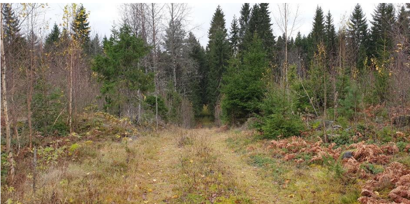
Hämeenlinna Pitkäjärven tieraunio. Keskiaikaisia Turun ja Hämeen linnoja yhdistäneen Hämeen Härkätien hyvin säilynyt osuus. Nurmettunut tienlinja kulkee metsässä.

Historialliseen aikaan ajoittuvat sen sijaan Janakkalan maalinnoitteet, jotka ovat ensimmäisen maailmansodan aikaisia Pietarin suojaksi rakennettuun puolustusjärjestelmään kuuluneita puolustusvarustuksia. Kanta-Hämeen historiallisen ajan kohteista maininnan ansaitsee myös 1600-luvulla rakennettu Lopen vanha kirkko Santa Pirjo, joka paikalla on sijainnut vanhempi kirkko viimeistään 1500-luvulla.