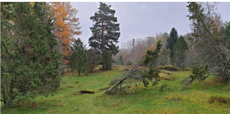
Forssa Salmistonmäki. Pronssi- ja varhaismetallikautinen asuinpaikka, joka sijaitsee jokivarressa entisen soistuneen lammen rannalla. Teija Tiitinen 2020, AKDG6556:2, Museovirasto.