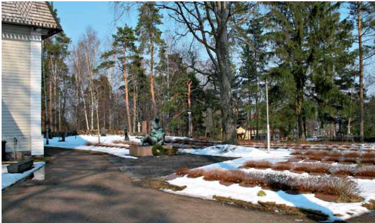
Kirkkolain suojelusäännökset koskevat myös kirkkopihaa sekä sen ja hautausmaan aitaa ja porttia. Elimäen 1952 valmistuneen sankarihauta-alueen ja sankaripatsaan on suunnitellut Aimo Tukiainen.

Monen kirkkoympäristön ja hautausmaan puusto alkaa olla ikääntynyttä, ja uusiminen edellyttää pitkäjänteistä suunnittelua. Periaatteena sekä kirkkopihojen suojelluilla alueilla että vanhoilla hautausmaa-alueilla tulee olla puuston varovainen maisemahoidollinen uudistaminen. Asemakaava-alueella ja toisinaan myös yleiskaava-alueella puiden kaatamiseen tarvitaan yleensä maankäyttö- ja rakennuslain (132/1999) mukainen, kunnan myöntämä maisematyöluupa.