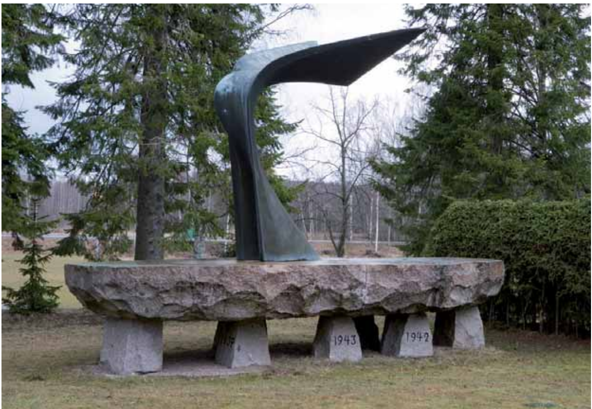
Tapio Wirkkalan 1958 suunnitteleman Kalvolan sankarimuistomerkkin kuuteen kivijalkaan on merkitty sotavuosi. Graniittipaaden yläpinnassa on kaatuneiden lukumäärään viittaavat "uhrikuopat" kuin kuppikivessä. Kaatuneiden nimet on kaiverrettu moderniksi draperiaksi tyyliteltyyn klassisen enkelin helmoihin.

si modernisoitumisen paineisiin. Kritiikki oli jo pitkään syyttänyt sotamuistomerkkejä kaavamaisuudesta ja taiteellisen kunnianhimon puutteesta. Muistomerkkien, joita oli ennen pidetty veistäjille kiitollisena työmaana, nähtiin ehkäisseen vapaan luovan työn. Taiteellisen uudistumisen vaatimuksissaan aikalaiskritiikki ei aina huomannut, että muistomerkkien joukossa oli myös monia taiteellisesti ansiokkaita teoksia. Sodat kokeneelle Suomelle sankaripatsaat tarjosivat kuitenkin yhteisiä muistojen paikkoja, joiden tarkoituksena oli myös lujittaa kansalaisyhteiskunnan konsensusta.