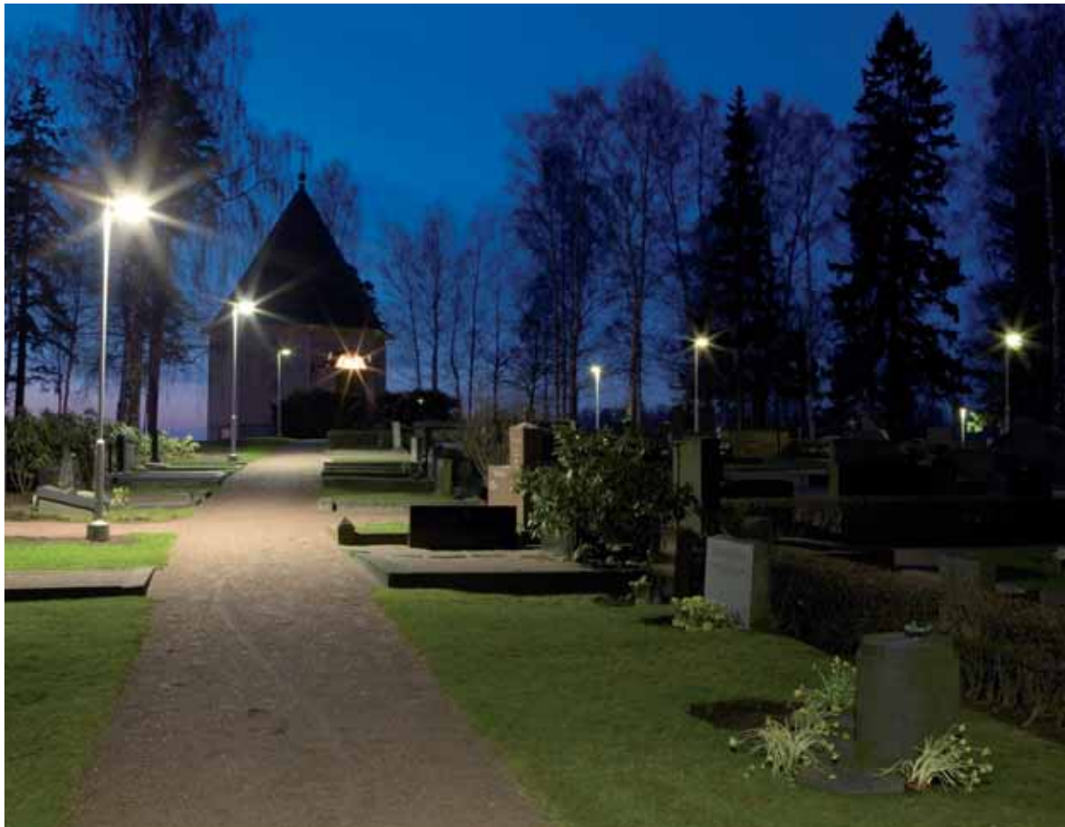
Salle Tiitila, Museovirasto

Rauhallinen ilta Leposaaren hautausmaalla Helsingin Kulosaaressa.