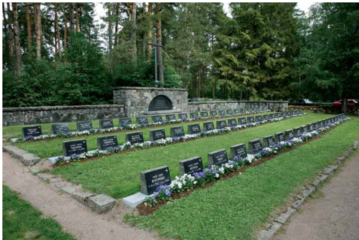
Jarkko Ojala, Köyliön seurakunta

Sankarihautausmaiden yhteismuistomerkit ovat niin keskeisiä, että niiden talvisuojaus on hankalaa. Sen sijaan yksityishenkilöiden kalkkikivisiä tai marmorisia hautamuistomerkkejä suojataan joskus talven ajaksi hyvin tuulettavalla vedenpitävällä suojalla.