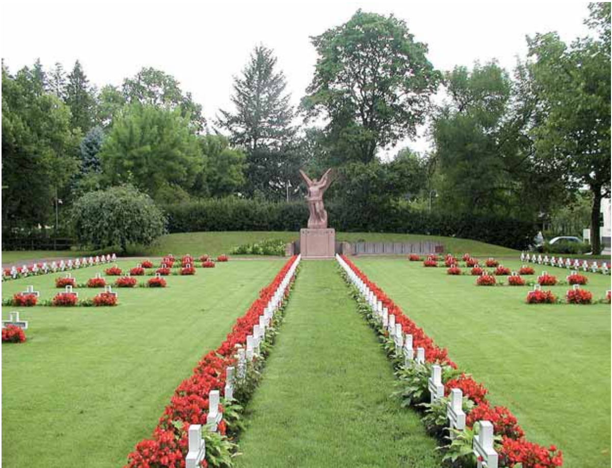
Riitta Hyövähti, Riihimäen seurakunta