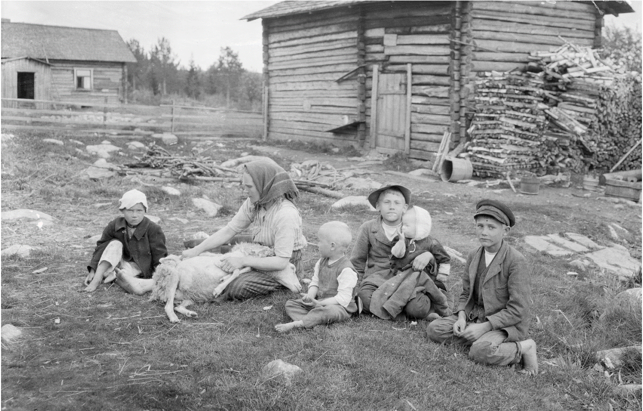
KK 1107:53 Lammasta keritään Kankaanpään Leppäruhkan kylässä. Kuva: U. T. Sirelius v. 1913