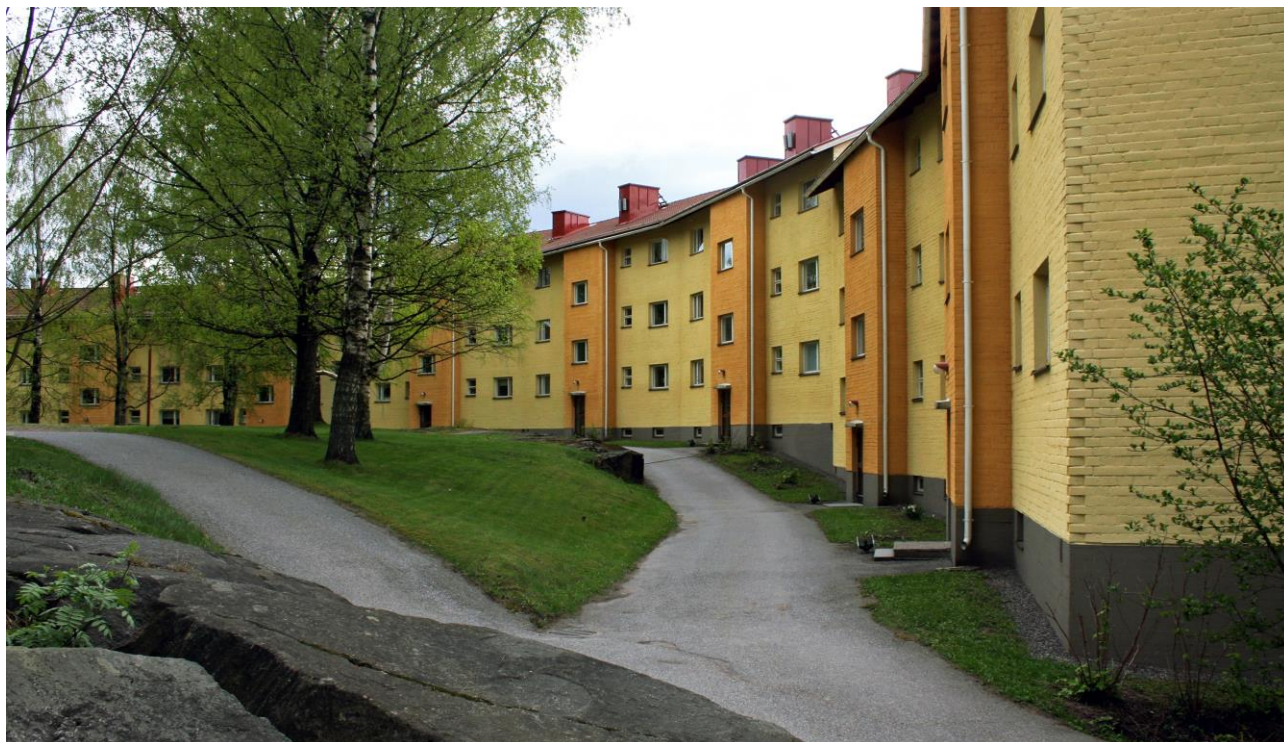
RHO125832:4 Kerrostaloja Maunulan Haavikonpolun varrella.

Museoviraston virkatehtäviin kuuluu rakennusten restaurointien ohjaus- ja valvontatyötä ja maankäytön valvontaa. Rakennusosafragmenttikokoelma ja Kulttuuriympäristön kuvakokoelma karttavat tämän työn ohessa.