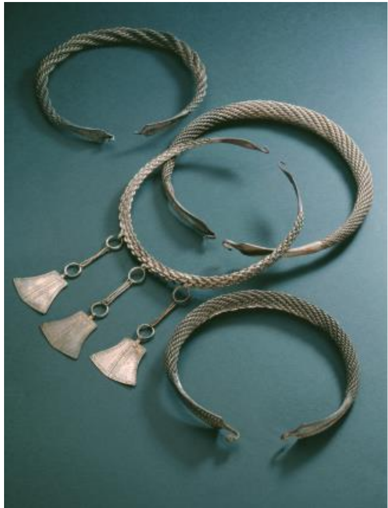
Ristiretkiajan hopeakätö KM 34004:1-4 Inarin Nanguniemestä.

Meriarkeologisten kenttätöiden yhteydessä nostettavat ja muinaismuistolain perusteella lunastettavat vedenalaislöydöt liitetään Suomen merimuseon kokoelmaan.