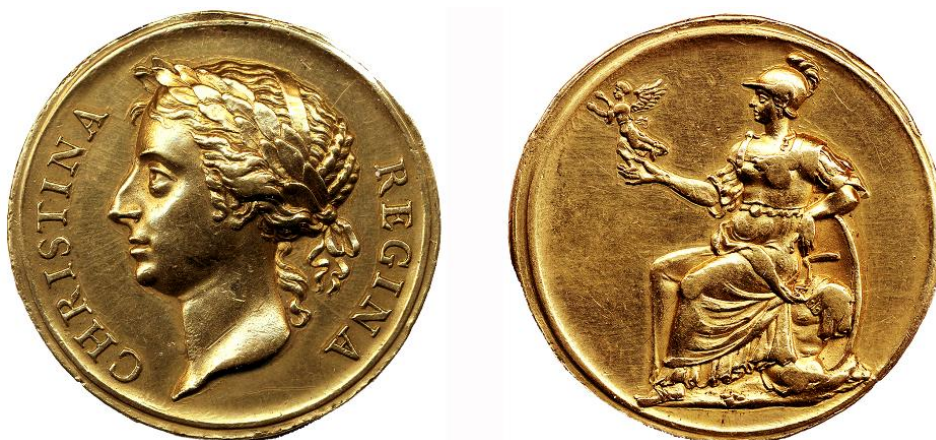
Kuningatar Kristiinan harvinainen kultamitali Antellin kokoelmasta.

Kirjastossa hankintapäätöksen voi tehdä hankinnoista vastaava tietoasiantuntija tai kirjastonjohtaja. Hankinnat kirjautuvat tilauksina, vaihtoina tai lahjoituksina ao. rekistereihin.