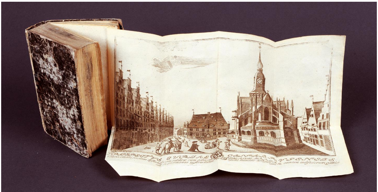
C. L. Reinhold, Architectura forensis I-II, Münster & Osnabrück , 1784.