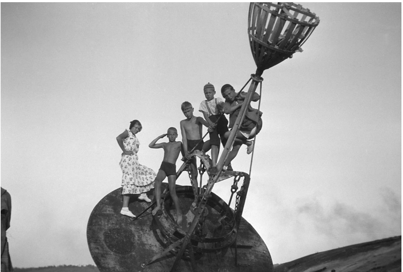
SMK91080:1 Lapsia Hylkysaaren luotsiaseman rannassa 1930-luvulla.

Kirjaston aineisto luetteloidaan Helka-, Melinda-, Kaakkuri- ja Arto-tietokantoihin sekä Museoviraston lehtiportaaliin, e-kirjaportaaliin tai muut e-aineistot kirjaston verkkosivuille. Kirjojen luettelointitietueita voidaan kopioida pohjaksi ulkomaisista kirjastotietokannoista. Tietueet rikastetaan muun muassa suomenkielisellä asiansanoituksella tai kuvailua täydentämällä. Tarkistuksia tehdään myös kansainvälisestä ISSN-rekisteristä. Luetteloviitteet voidaan saattaa tarvittaessa vaihtomuotoon ja avata avoimeksi metadataksi esimerkiksi Finnassa. Kirjastokokoelmat luetteloidaan kansainvälisellä Marc21-formaatilla. Asiansanoista käytetään yleistä suomalaista asiansanoitusta, museoalan asiansanoitusta ja tarvittaessa muita erikoisalojen asiansanoitusta. Ontologiat eivät ole toistaiseksi käytössä kirjastojärjestelmässä. Lisäksi käytetään kokoelmakarttaluokitusta ja kirjat luokitetaan kirjaston oman aiheenmukaisen hyllyluokitusjärjestelmän mukaan. Kirjastokokoelmat luetteloidaan kansainvälisten ISBD-luettelointisääntöjen mukaan. Ne tulevat muuttumaan RDA-luettelointisääntöiksi.