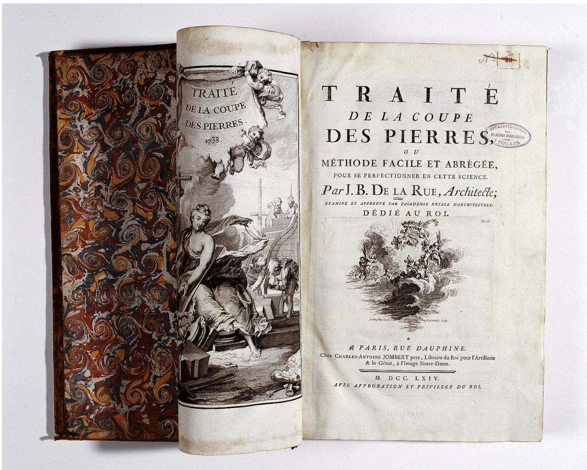
La Rue, J. B. de: Traité de la coupe des pierres .

Kokoelmapolitiikka on tarkoitettu joustavaksi työvälineeksi, jonka ajankohtaisuus tarkistetaan säännöllisesti. Se on myös tarkoitettu yleisohjeeksi ja lähtökohdaksi Museoviraston kokoelmien hoidon yksityiskohtaisemmalle määrittelylle. Museoviraston yksiköt voivat tehdä kokoelmapolitiikkaa täydentäviä yksityiskohtaisempia kokoelmapoliittisia asiakirjoja.