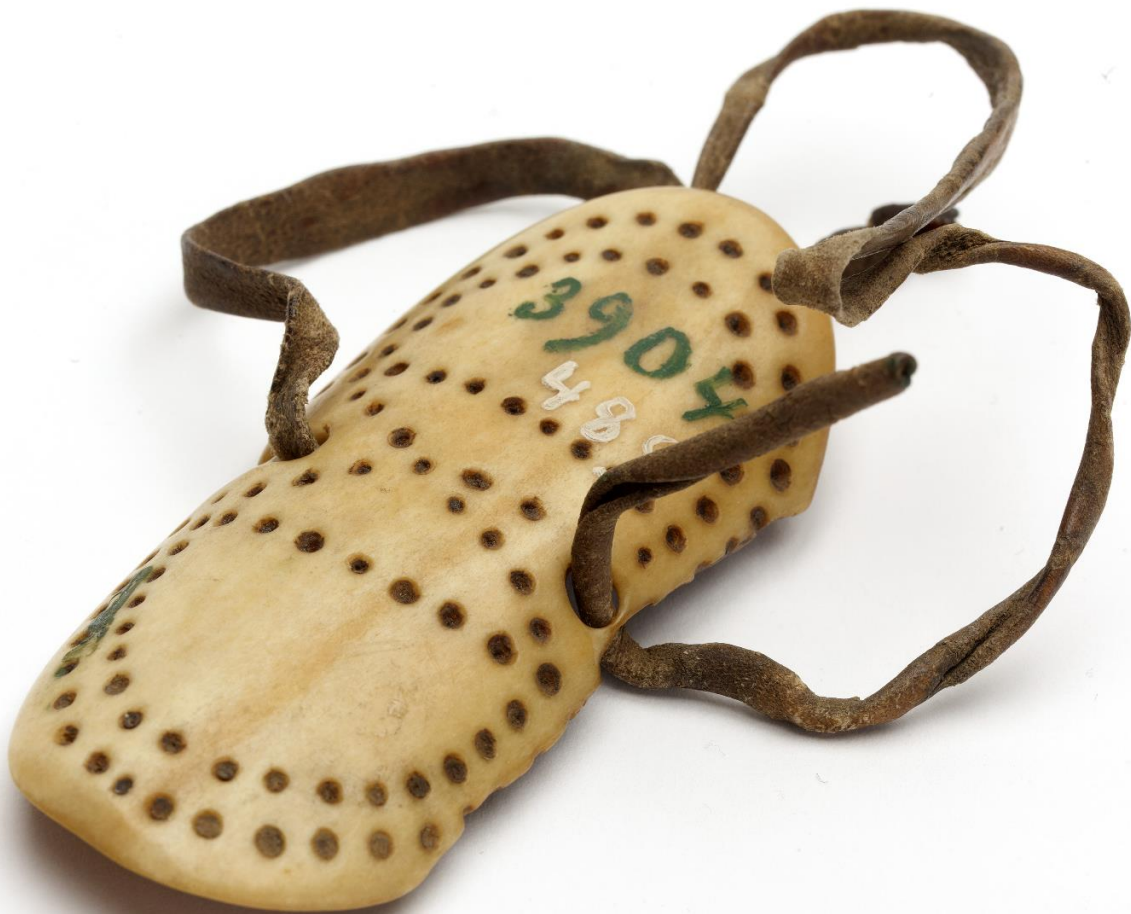
SU3904:489, Jousiampujan rannesuoja, hantit, Objoki, Siperia.

Kulttuurien museon kokoelmat valottavat suomalaisten yhteyksiä ulkomaille. Tulevaisuudessakin museon tallennusvastuuseen kuuluu suomalaisten kontakteista muuhun maailmaan kertovan aineiston kerääminen. Kulttuurien museon hallussa on vanhoja, jo ennen 1800-luvun puolta väliä saatuja harvinaisia kokoelmia Alaskasta, Siperiasta ja Etelä-Aasiasta. Näiden kartuttamista tullaan jatkamaan yhteistyössä eri toimijoiden kanssa ensisijaisesti tutkimusprojektien yhteydessä.