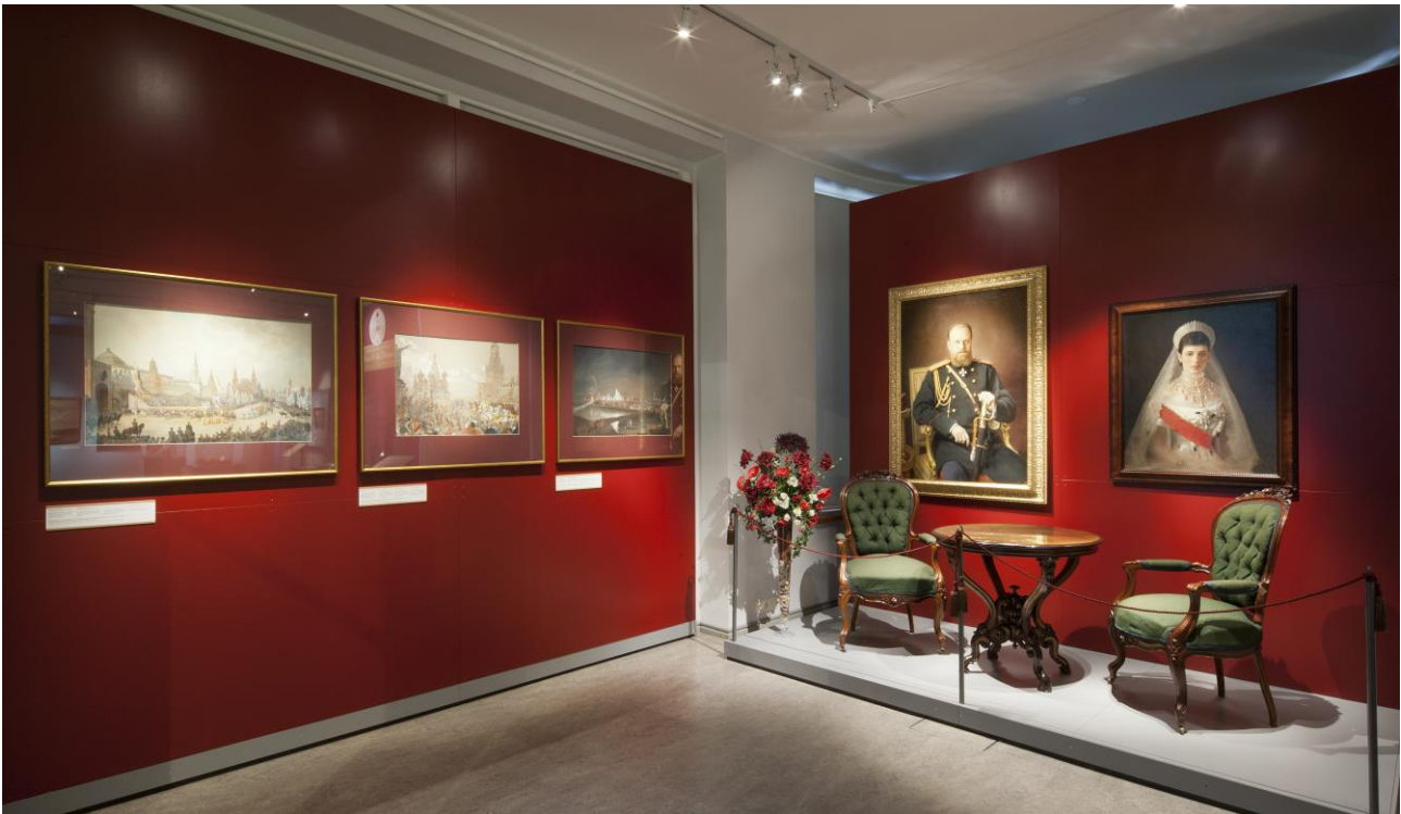
Keisarillista kesänviettoa näyttely.

havainnollistetaan esineiden käyttöä, tekotapoja, materiaaleja ja muotoja. Käyttökokoelman esineitä käytetään erityisesti koululaisille suunnatuilla opastuksilla sekä aistirajoitteisten käynneillä. Käyttökokoelman kosketeltavia esineitä käytetään myös erilaisissa tapahtumissa sekä tehtäväkierroksilla.