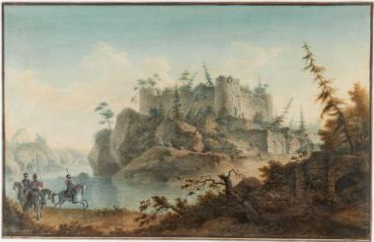
HK10000:795, M. N. Vorobjev: Raaseporin linnan rauniot.

Kulutustavaroiden laajasta tuotevalikoimasta pyritään valitsemaan yleisimmät ja tyypillisimmät. Tärkeä seikka on kotimaisen kulutustavaratuotannon keskeisten tuotteiden huomioonottaminen. Kansallismuseon keruupolitiikassa painotetaan kuluttajanäkökulmaa, minkä vuoksi hankitaan myös ulkomailla valmistettuja ja täällä käytettyjä tuotteita. Teollisesti valmistettujen esineiden osalta ei voida tehdä selkeää eroa historialliseen ja kansatieteelliseen aineistoon.